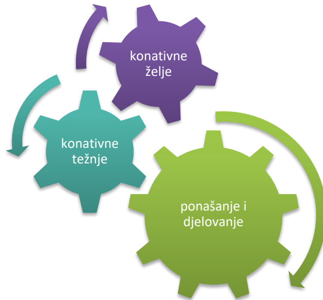
Slika 1. Mehanizam djelovanja prema konativnim karakteristikama