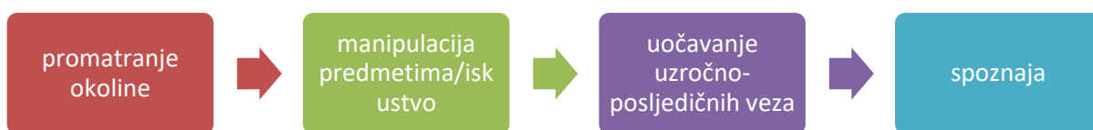
Slika 2. Spoznavanje okoline