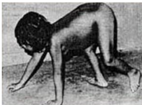
Slika 6. Jedno od „divlje“/fetalne djece – pronađeno 1990. g. u andskom gorju u Peruu, osam je godina preživljavalo na kozjem mlijeku, korijenju i bobicama, znalo je komunicirati s kozama, nikada nije naučilo govoriti