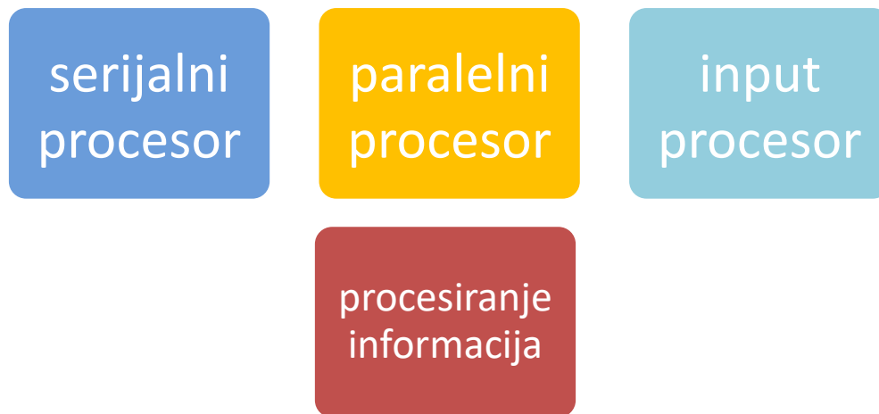
Slika 3. Moždani procesori

shvaća sve ono što će paralelni procesor uzeti u obzir pri simultanom procesiranju. Da bi input procesor mogao pravilno strukturirati informacije, one trebaju logično slijediti, proizlaziti iz nečega i biti vezane uz neke od različitih, širih područja.