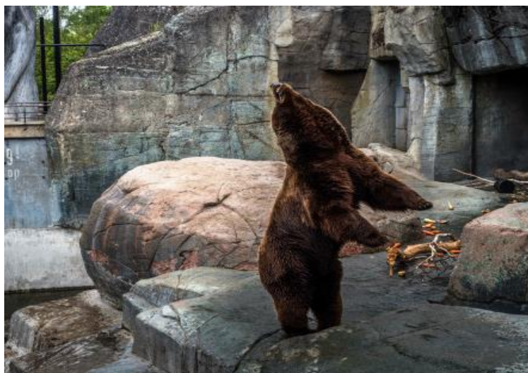
Slika 6: Primjer zoopsihoze, smeđi medvjed zabacuje glavu