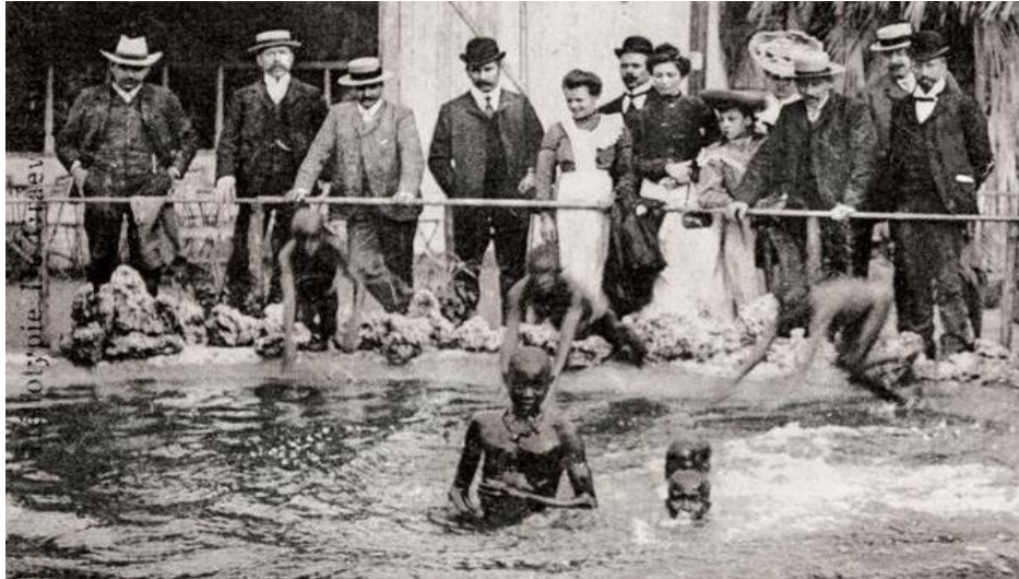
Slika 5: Prizor s izložbe ljudi