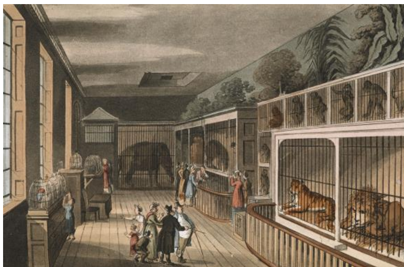
Slika 1: Menažerija, London 1812.

Zoološki vrt je kroz povijest poprimao različite oblike dok isti naziv još nije niti nosio. Zoološki vrtovi razvili su se iz zvjerinjaka, tzv. menažerija (Slika 1.) koje su nastale tijekom srednjeg vijeka. Izraz menažerija označava zbirke egzotičnih životinja, obično grupirane po skupinama, npr. mačke, primati i sl. Izvedenica je francuske riječi ménage , koja znači upravljati, sa sufiksom -rie , koji označava mjesto. Za razliku od životinja na rančevima i farmama, životinje menažerija nisu bile namijenjene za jelo. Uzdržavanje menažerija zahtijevalo je znatna ulaganja u prostor, rad i hranu. S obzirom na to, čin vođenja menažerije može se promatrati kao pokazatelj napredne razine u društvenom razvoju i znak financijske stabilnosti starijih kultura (Baratay i Hardouin-Fugier, 2002).