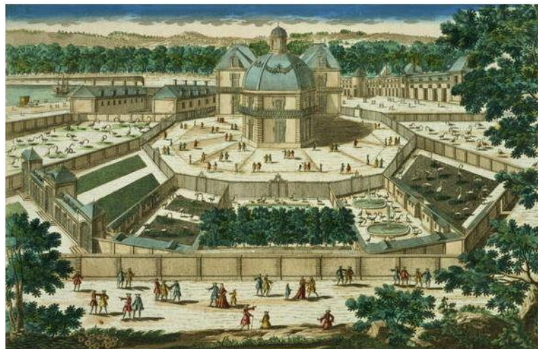
Slika 2: Kraljevska rezidencija Versailles, 17. stoljeće

mentaliteta i financijskih prilika izgubile na privlačnosti kod aristokracije. U puku su nastavile biti izrazito popularne kao npr. borbe s bikovima u Španjolskoj, borbe između bikova u Francuskoj i sl. (Baratay i Hardouin-Fugier, 2002). Francuski kralj Luj XIV. 1664. god. u sklopu palače Versailles (Slika 2.) izgradio je prvu modernu menažeriju zapadne Europe. Modernost nije bila izražena samo u njenim rijetkim i neobičnim životinjama, već i u brojnosti životinja na određenom mjestu, čime se prestalo s ranijim praksama raspršivanja životinja po imanjima vladara. Menažerija je bila dio baroknog spektakla versajske palače u kojoj su se osim egzotičnih stvorenja, mogle gledati i kazališne predstave, balet, parade, i sl. Francuski utjecaj širio se vladarskim dvorovima diljem Europe, a posebice je bio zamjetan u austrijskim dvorcima Belvedere i Schönbrunn te njihovim menažerijama (Hancocks, 2001).