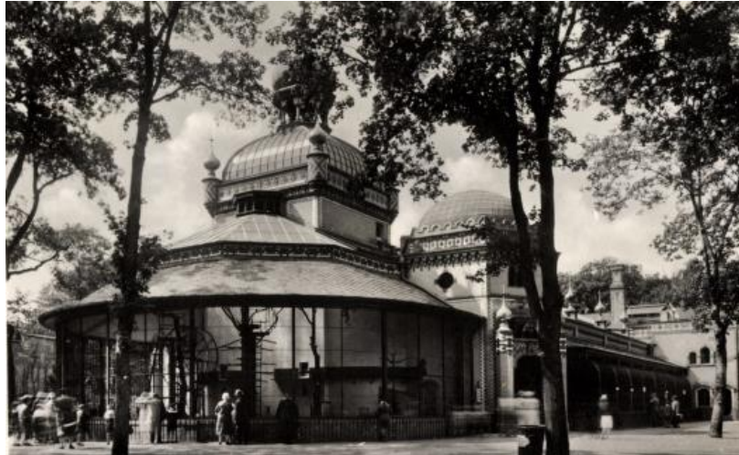
Slika 4: Nastamba primata, Berlin Zoo