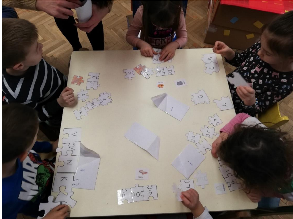
Slika 1. Slaganje riječi podravskog dijalekta

Četvrti su dan u vrtiću pripremljene dvije narodne nošnje – u Virovitici su to bile narodna nošnja podravskoga kraja (Gola) te narodna nošnja slavonskoga kraja (Suhopolje), dok je u Varaždinu uz podravsku narodnu nošnju pripremljena narodna nošnja varaždinskoga kraja (Petrijanec). Elementi pojedine narodne nošnje su se imenovali te međusobno uspoređivali.