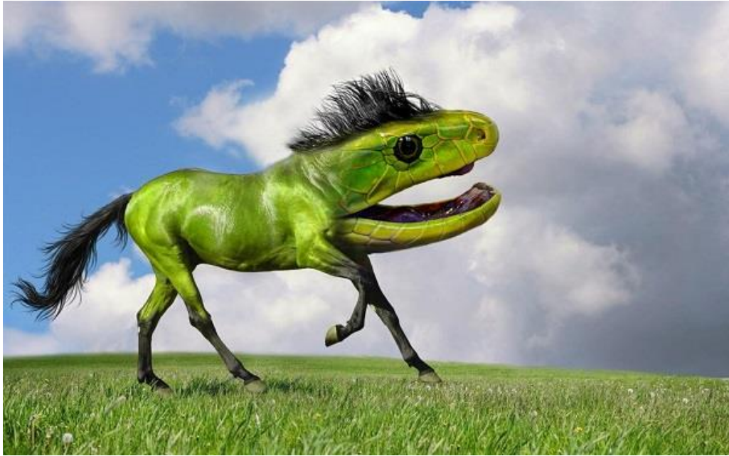
Slika 1: Neobična živalinja brez imena