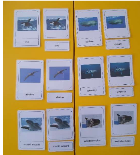
Slika 11. Vrste pingvina

Po završetku aktivnosti s karticama, djeca su izrađivala svoje knjižice sa životinjama Antarktike. Odgojitelji su pripremili predloške životinja koje su sva djeca trebala obojati, a oni koji znaju pisati, napisali su i naziv.