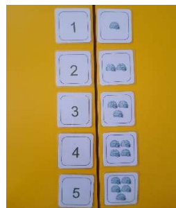
Slika 15. Sličice i brojke

Za djecu starije dobi prekinut je linearan slijed i otežana vježbu, kartice s lijeve strane tbile su pomiješane tako da se brojčane vrijednosti slože nasumce.