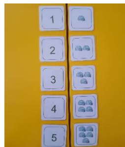
Slika 15. Sličice i brojke

Za djecu starije dobi prekinut je linearan slijed i otežana vježbu, kartice s lijeve strane tbile su pomiješane tako da se brojčane vrijednosti slože nasumce.