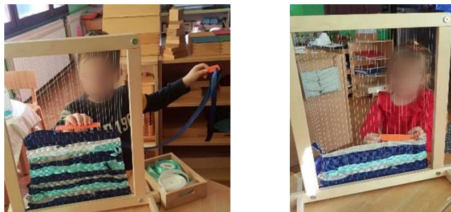
Slika 7. Okvir za tkanje

odgojitelj uveo djecu u aktivnost, udaljio se i nije ih dalje ometao. Aktivnost djevojčice i dječaka dugo je trajala, rad druge djece nije ometao njihovu koncentraciju. Po okončanju aktivnosti, djeca su svoj pribor vratila na mjesto na kojem su ga pronašli.