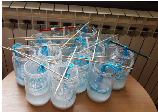
Slika 5. Završetak pokusa

Djeca su svakodnevno, samoinicijativno pratila promjene u staklenki i na niti vune koje su se događale koristeći povećalo. Predškolci su promjene bilježili crtežom svakih 5 dana, sve dok tekućina iz staklenke nije u potpunosti ishlapila. Crteži su na kraju ciklusa spojeni u knjižicu. Pojavljivala su se pitanja kod mlađe djece: „ Gdje je nestala voda? “. Stariji dječak odgovorio na slikovit način: “Pa vidiš kako je toplo blizu radijatora, voda je isparila. Kada polijemo majicu stavimo je na radijator da se osuši- tako se osušila i voda koja je bila u staklenci.“