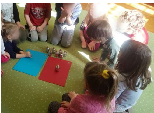
Slika 8. Zajednička aktivnost

Zadatak je odgojitelja bio pripremiti sredstva za rad; 4 para metalnih bočica s vodom određenih stupnjeva topline, podložak crvene i plave boje te prezentirati djeci način izvođenja vježbe. U lijevoj ruci dijete je držalo odabranu toplinsku bočicu, a desnom rukom tražilo odgovarajući par. Na crveni podložak stavljali su tople bočice, na plavi hladne. Kroz neposredno osjetilno iskustvo djeca su usvojila pojmove toplo i hladno te prepoznati gradaciju istih- toplo/toplije, hladno/hladnije taktilnim osjetom. Djeca su željno iščekivala doći na red jer u sobi je prisutan samo jedan primjerak pribora.