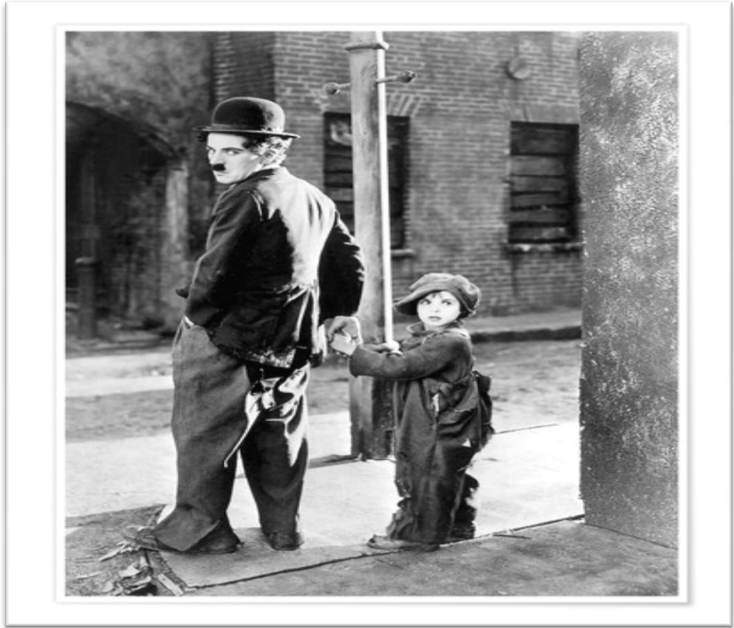
Slika 1. Plakat filma Mališan