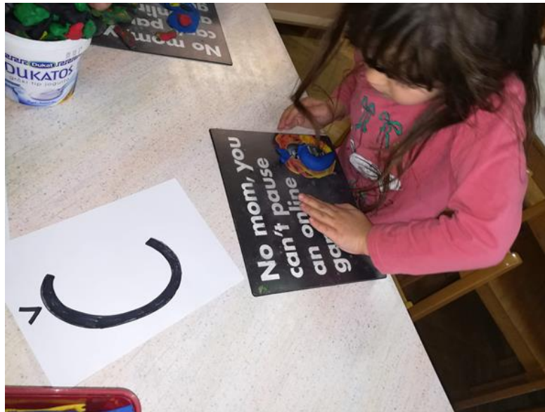
Slika 1. Fonološka osjetljivost, oblikovanje slova