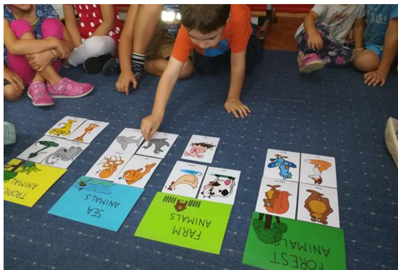
Slika 4. Igra „Gdje živi ova životinja?“