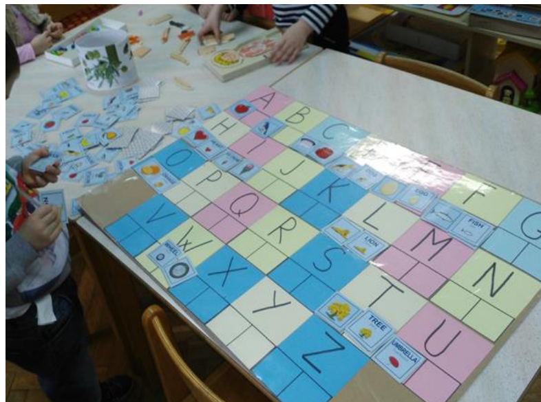
Slika 2. Pridruživanje slike i fonema