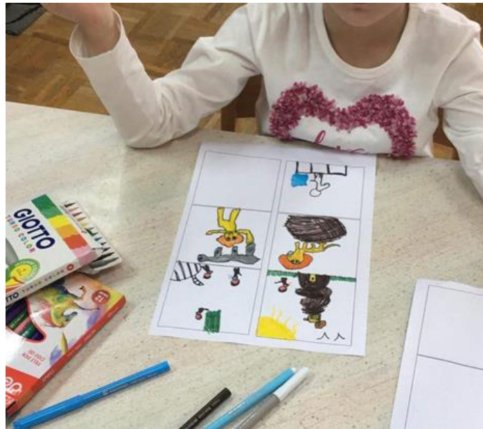
Slika 5. Djevojčica izmišlja priču o životinjama u Africi