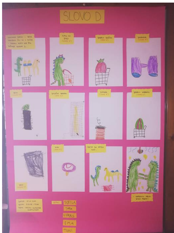
Slika 3. Pričanje priče sa slovom D