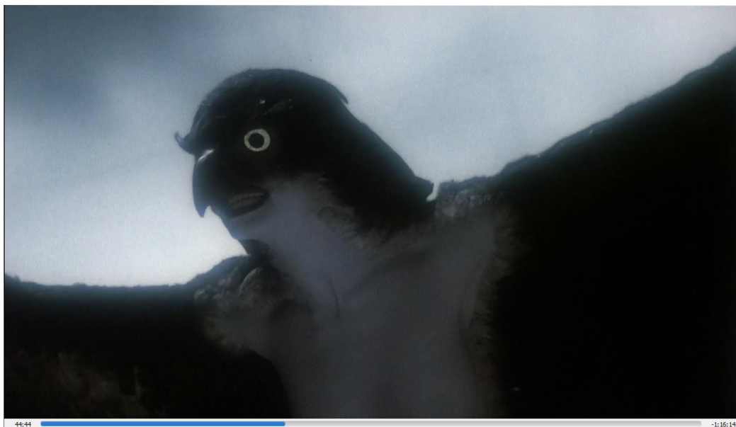
Slika 1. Fotografija harpije knjiga str 28 i scena iz filma