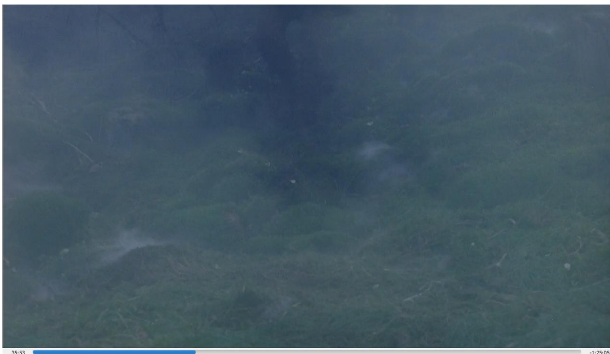
Slika 4. Fotografija magle iz filma

Radnja se odvija kao i u književnom djelu, no Birk govori Ronji: “Imaš srce od čelika, razbojnička kćeri!”. Kroz film Birk u više navrata izjavljuje pomalo romantične rečenice Ronji koje daju naslutiti da je gleda drugačije nego prijateljicu. Čitajući knjigu osobno nisam stvorila dojam da je riječ o romantičnom odnosu, nego o čvrstom prijateljstvu. Također, likovi pojedinih razbojnika su karakterizirani pa tako npr. doznajemo da je Lil Kippen svirač, komedijaš i zabavljač. U knjizi ni jedan razbojnik nije ovako okarakteriziran, osim Lubanje Pera koji odaje dojam mudrog starješine, za razliku od prikaza u filmu gdje on izaziva Mattisa, predstavlja neozbiljnog starog komedijaša koji mudrost skriva u sebi. U romanu su razbojnici predstavljeni kao homogenizirana skupina, bez osobitih isticanja karaktera pojedinaca. Oni ne igraju kao pojedinci bitnu ulogu u cijeloj priči nego su tu kao prezenteri okruženja u kojem Ronja odrasta. U filmu su okarakterizirana kako bi doprinijeli dinamičnosti, humoru i zabavi filma namijenjenog djeci. Tako primjerice, kada gledatelj na ekranu vidi Lill Kippena očekuje pjesmu rugalicu ili kakvu komičnu scenu.