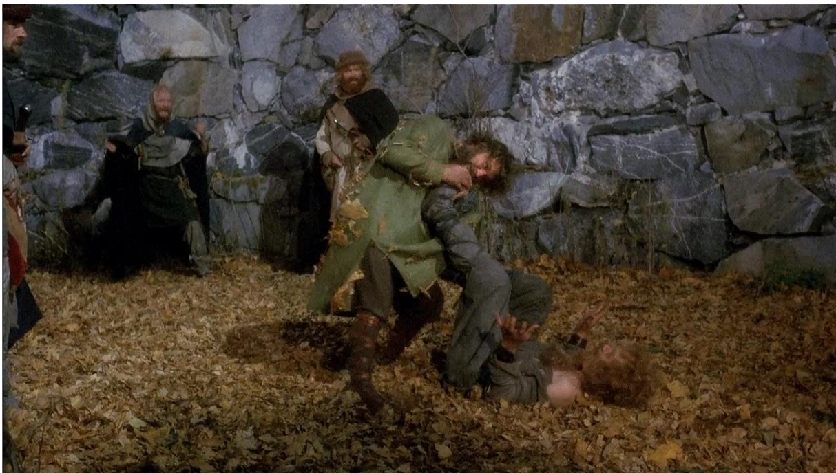
Slika 6. Fotografije borbe knjiga str205, prizor iz filma

Dolaze ranjeni u tvrđavu gdje ih dočekuju žene i djeca. Sjetno razgovaraju o djeci koja ne žele biti razbojnici. Birk se pred svima zaklinje da neće biti razbojnik. No očevi ipak prihvaćaju činjenicu izjavom „došlo je neko novo doba“. Ta izjava postaje afirmacija djece u njihovom društvu kao jednakih i uvažениh.