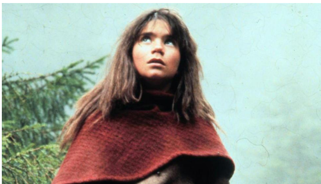
Slika 2. Fotografije Ronje iz romana i iz filma

Mattisove napomene u filmu Ronja kao da ne shvaća ozbiljno, one su izrečene „u vjetar“ dok otac kao dijete trči za njom. Ovdje je dočarana težnja djeteta za odvajanjem od roditelja. Ronja s tvrdave viče „Dajte mi opasnosti!“, a kamera panoramski prelazi preko krajolika kojeg će uskoro upoznati. Očeva gotovo ovisnost o njoj vidi se u prikazu roditeljske bespomoćnosti u svijetu odrastanja njihove djece. To je nezaustavljiv proces koji valja prihvatiti jer dijete pripada svijetu, a ne roditelju. Prikazi krajolika, tamne šume kroz koju se probija svjetlost, Ronjin odraz u jezeru dočarava sklad prirode i