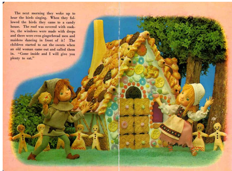
Slika 1: Lutkarska slikovnica