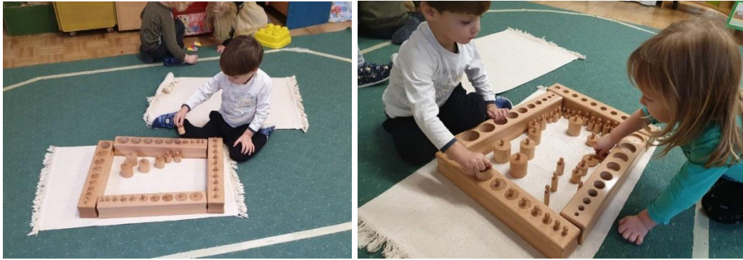
Slika 32. D1 Suraduje s prijateljem