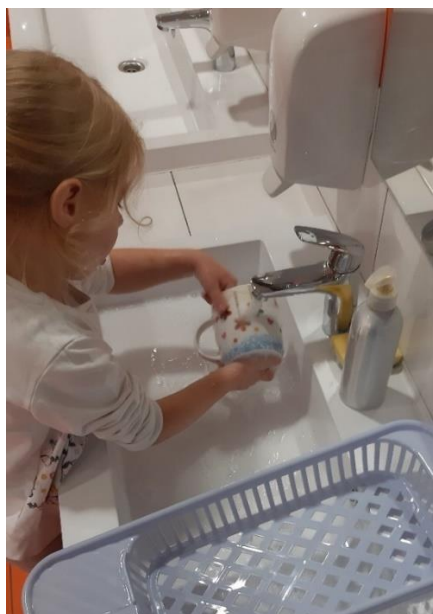
Slika 19. Pranje šalice