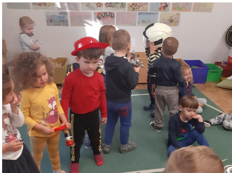
Slika 6. Nakon posjeta vatrogasca