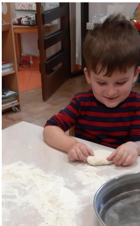
Slika 15. D2 mijesi kruh