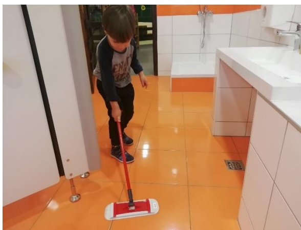
Slika 30. D1 Briše pod

produbljuje iskustvo ne koristi svoje sposobnosti u punom kapacitetu u aktivnostima ne uključuje maštu.