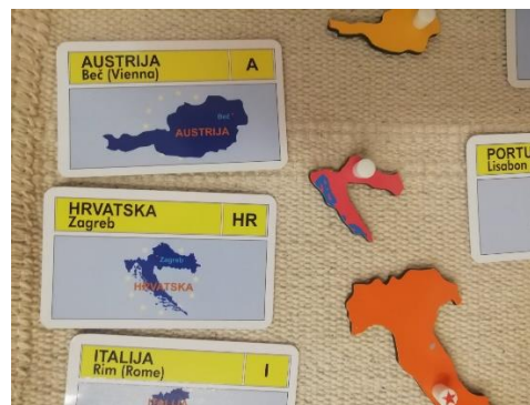
Slika 21. Karta Europe