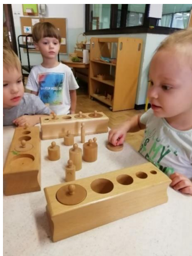
Slika 11. D1 promatra rad s priborom