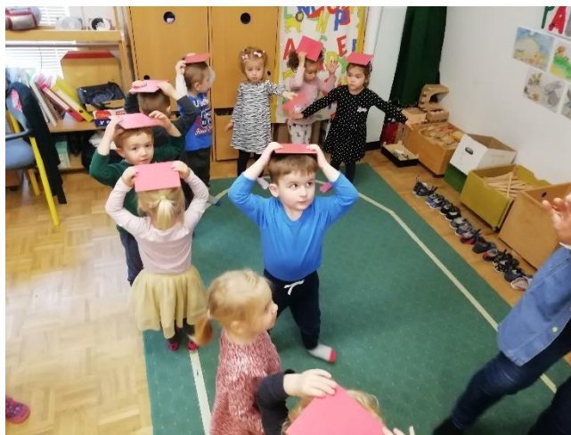
Slika 23. Hodanje po elipsi