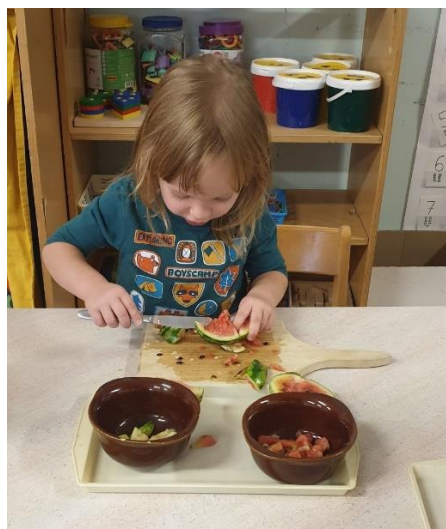
Slika 36. Rezanje mini lubenice