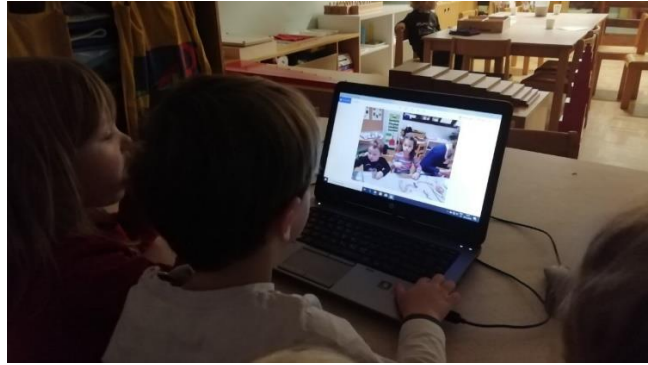
Slika 29. Pregledavanje fotografija