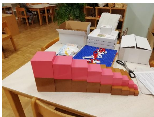
Slika 10. Uvođenje Montessori pribora