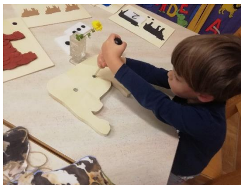
Slika 20. Upotreba alata