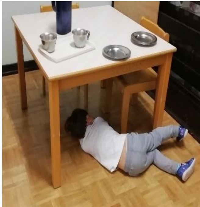
Slika 8. D1 Nezainteresiran za aktivnosti