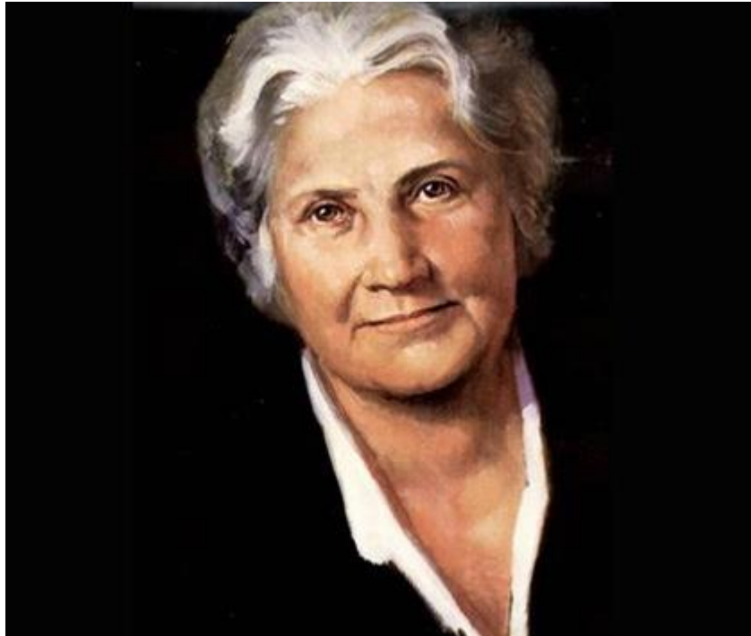
Slika 1. Maria Montessori