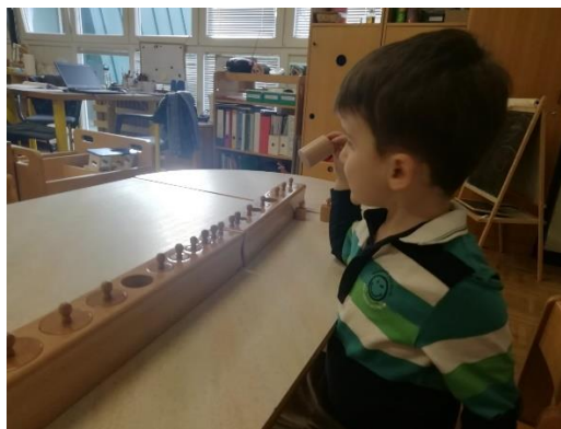
Slika 22. D2 Valjci za umetanje