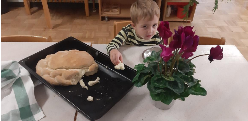
Slika 5. Dječak se skriva