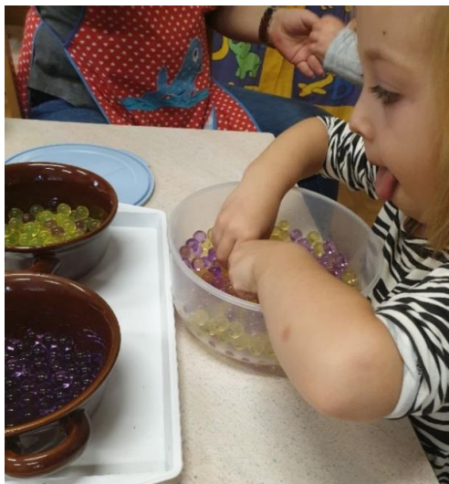
Slika 35. Razvrstavanje kuglica od gela

Montessori fenomen dugo stanje zaokupljenosti, gotovo meditirajuće. Montessori je koristila i naziv „djelatna meditacija“. Kod djevojčice na slici 35. možemo primijetiti upravo to stanje.