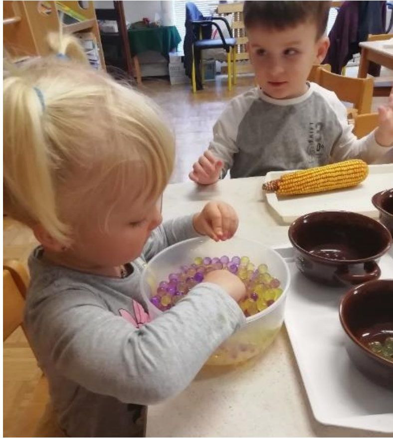
Slika 14. D2 Vježba sa klipom kukuruza