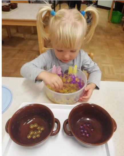
Slika 24. Vježba razvrstavanja kuglica od gela