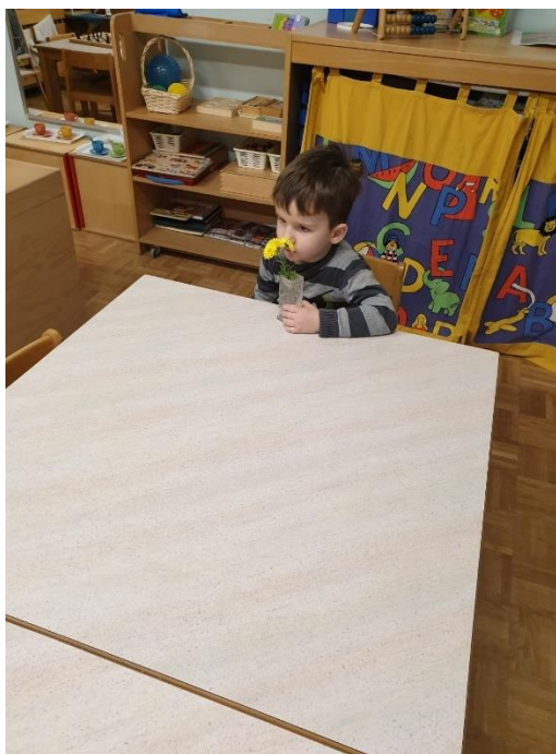
Slika 34. D2 Miriše cvijet