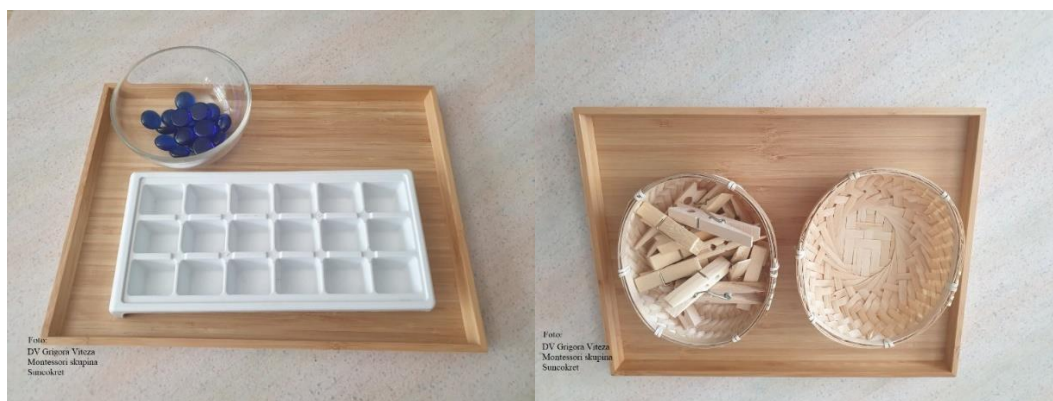
Slika 12. Pribor za aktivnosti svakodnevnog života