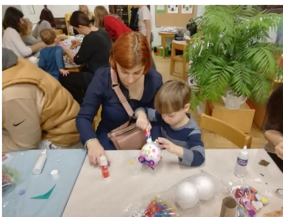
Slika 26. D1 i majka na radionici