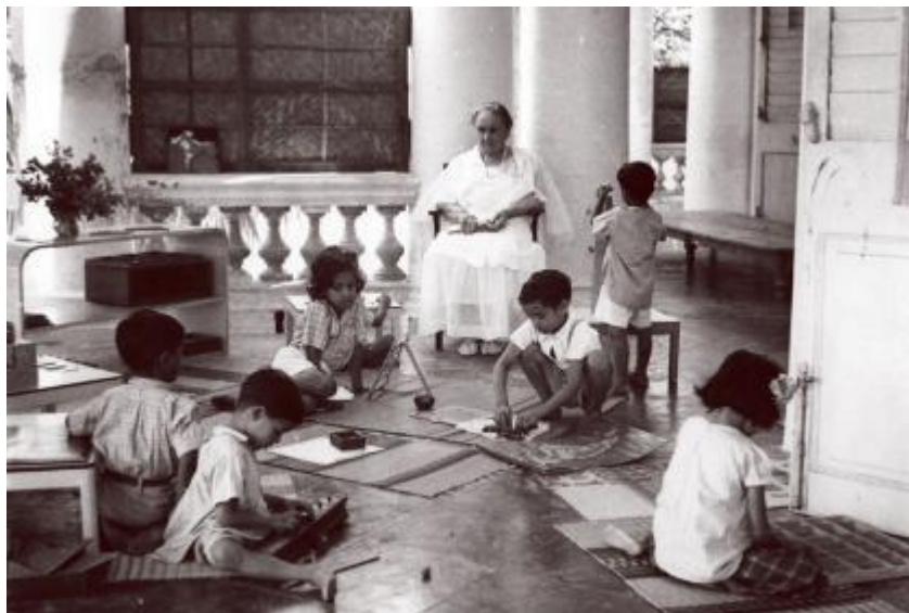
Slika 2. Maria Montessori promatra djecu