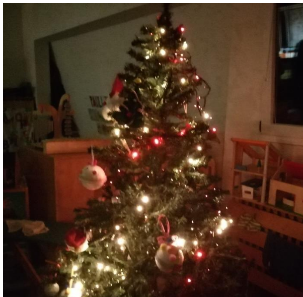
Slika 28. Okićena jelka