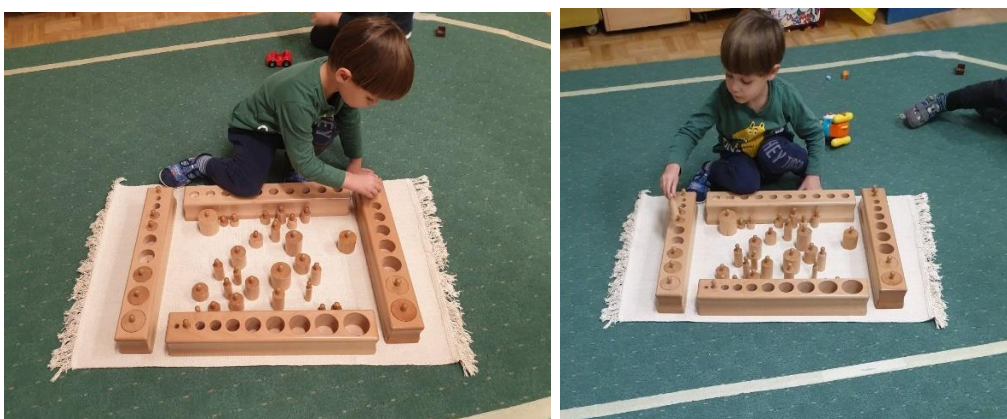
Slika 31. D1 Valjci za umetanje