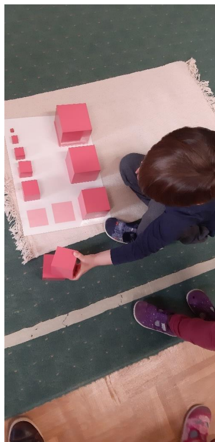
Slika 33. Ružičasti toranj