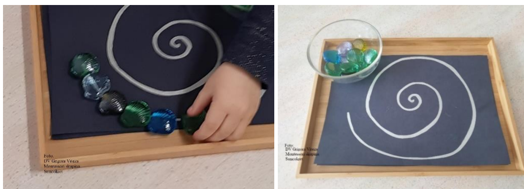
Slika 13. Vježbe praktičnog života