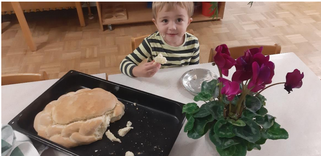
Slika 4. Dječak vidi kameru