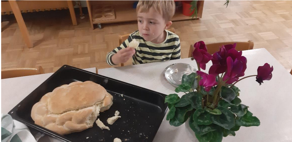
Slika 3. Dječak jede kruh