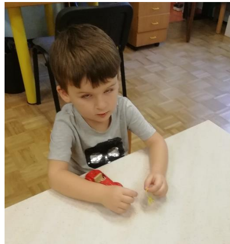
Slika 9. D2 nezainteresiran za aktivnosti