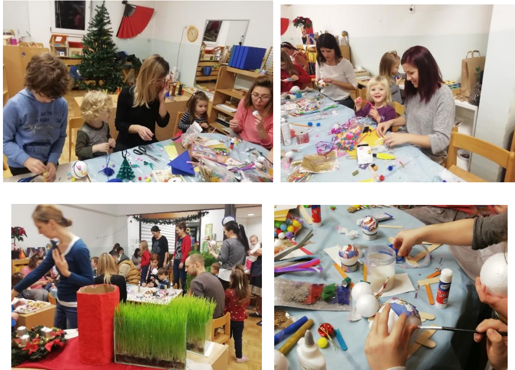
Slika 27. Kreativna radionica