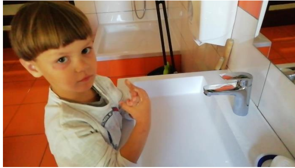
Slika 17. Vježba pranja ruku