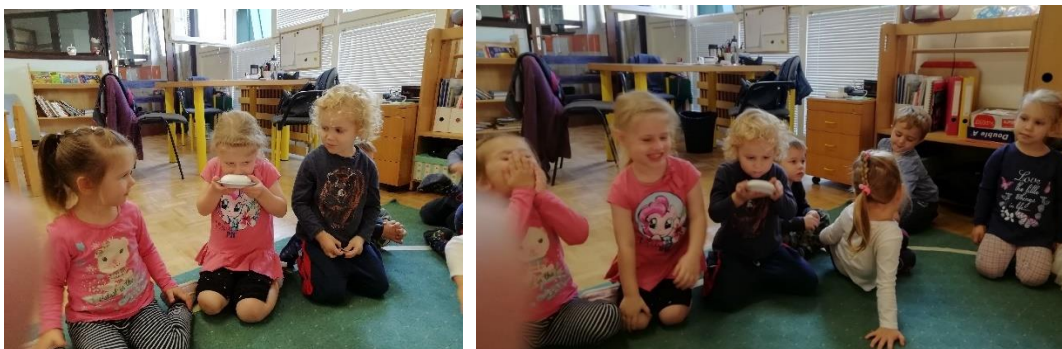
Slika 16. Mirisanje sapuna