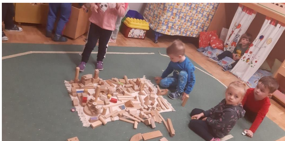
Slika 7. D1 Skriva se iza zavijese