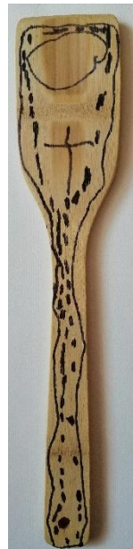
Slika 32. Preslica (L. N., 5 god.)

Dječak M. Š. također crta rozetu, no on ju prikazuje na ponešto drugačiji način. Osim rozete na sredini crta križ koji se teže razaznaje među mnoštvom velikih točaka. Dječak naglašava oblik kuhače ponavljajućom linijom kojom prati obris objekta po kojem crta.