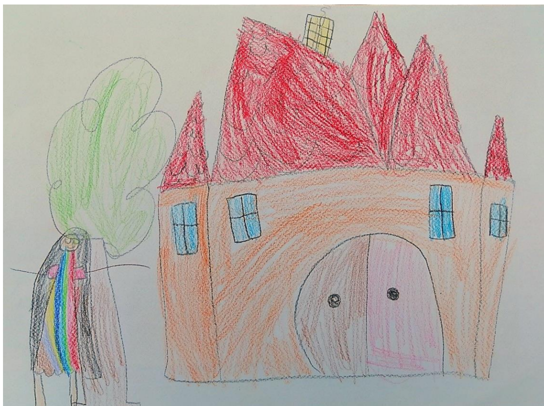
Slika 10. Dvorac Erdödy (L. K., 6 god.)

Druga ponuđena aktivnost je bila crtanje drvenim bojicama. U aktivnosti je sudjelovalo osam djevojčica u dobi od 5 i 6 godina.