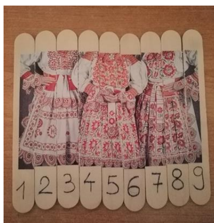
Slika 15. Slagarica