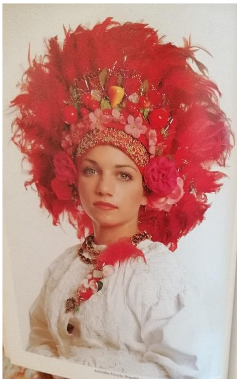
Slika 2. Naplit

Muška nošnja sastoji se od rubače i gaća. Rubača se nosi preko gaća i seže do bedara. Uz seljačko platneno ruho nose se različiti prsluci, haljeci i kaputi. Muški prsluk je od finog tamnog sukna, iskićen sitnim filigranskim vezom u svjetlijoj svili. U vezu je ponekad naznačena godina izrade, a često i monogram vlasnika (Draganić, 1976). Za razliku od ženske muška nošnja je dosta rano iščeznula iz uporabe.