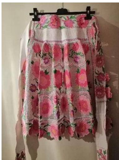
Slika 22. Zastor

Djevojčica L. H. crta sve dijelove izvezene na prezentiranom lajbeku, no ne i sve detalje veza. Kako se djevojčica bazira na prikazivanju svih komponenti na prednjoj strani crteža tako radi i na stražnjoj. Djevojčica pri izradi crteža koristi deblji i tanji srebrni flomaster.