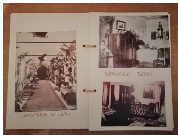
Slika 6. Fotoalbum grofa Stjepana Erdödy

Priča o Jastrebu – ilustrirana priča autorice Daniele Bobinski