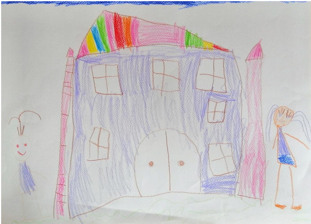
Slika 11. Dvorac, seka i ja (M. D., 5. god.)

crveni crijep. Također na krovu crta dimnjak koji se nalazi iznad glavnog portala kako je i na dvorcu Erdödy. Iz dimnjaka, koji je nacrtala djevojčica, izlazi dim te time prikazuje da netko živi unutra što je ona i prokomentirala. Djevojčica je zidove dvorca obojila u narančastu boju. Zidovi dvorca su bijeli, ali od starosti i neodržavanja su na dijelovima postali te boje, pa možemo zaključiti kako je željela prikazati da se dvorac ne održava. Pokraj dvorca je nacrtala sebe u posjetu dvorcu te jedno drvo. Oko dvorca se nalazi perivoj prepun drveća te je djevojčica željela prikazati i dio njegove okoline. Nakon analize crteža može se zaključiti kako je djevojčica promatrala fotografije dvorca koje su bile ponuđene kao poticaj za aktivnost. Također se može zaključiti kako je djevojčice u svoj crtež unijela i poneku svoju ideju kako bi dvorac trebao izgledati.