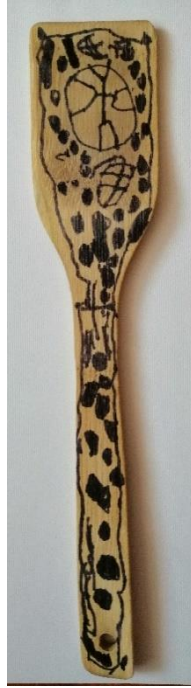
Slika 31. Preslica (M. Š., 5 god.)

Dječak M. Š. također crta rozetu, no on ju prikazuje na ponešto drugačiji način. Osim rozete na sredini crta križ koji se teže razaznaje među mnoštvom velikih točaka. Dječak naglašava oblik kuhače ponavljajućom linijom kojom prati obris objekta po kojem crta.