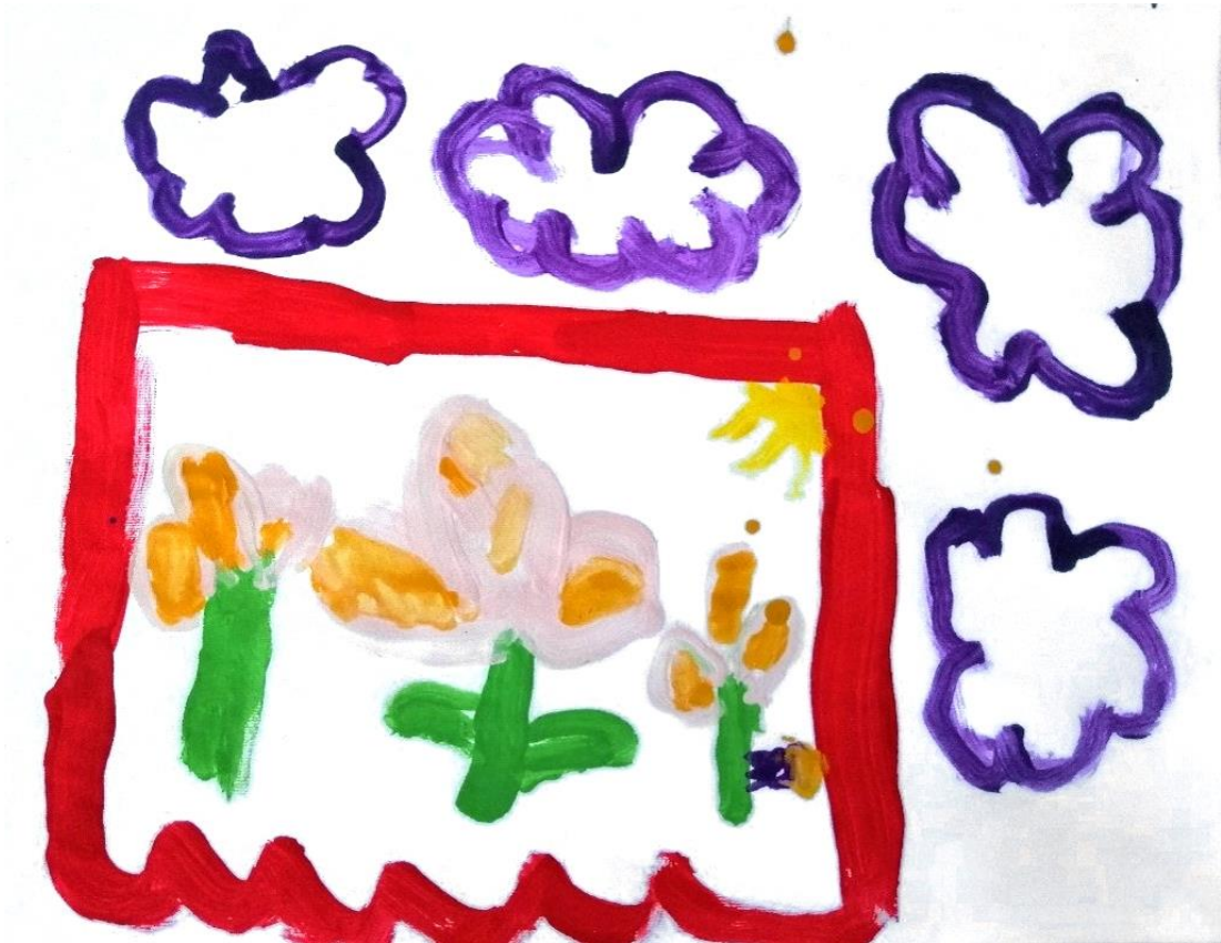
Slika 25. Zastor (L. Č., 5 god.)

Djevojčica L. Č. crvenom bojom slika vanjske linije zastora, kao i djevojčica A. S. No na ovoj slici možemo primijetiti kako je djevojčicu vez na prikazanom zastoru asociirao na rascvjetanu livadu, te to tako i prikazuje. Djevojčica slika tri cvijeta s po tri latice na zelenim stabljikama, a u lijevom kutu nazire se žuto sunce. Oko zastora na kojem je prikazana rascvjetana livada djevojčica je naslikala ljubičaste cvjetove, kako je ona to opisala, jer se tako nalaze i na zastoru koji joj je predstavljen kao poticaj.