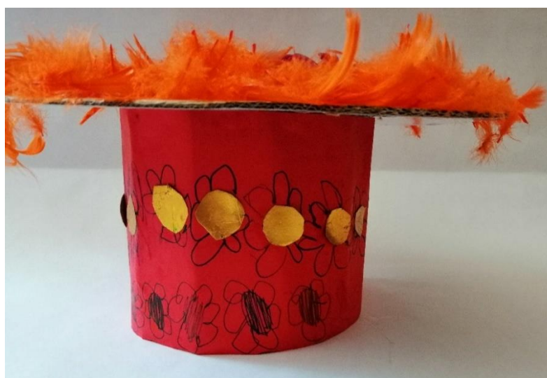
Slika 27. Naplit – donji dio

Poticaj za sljedeću likovnu aktivnost bio je naplit, odnosno svadbeni vijenac. Djeca su od različitih materijala oblikovala naplit prema prikazanim fotografijama. U aktivnosti je sudjelovalo petero djece. Za aktivnost izrade naplita bio im je ponuđen ovaj materijal: karton, škare, mješavina drvofigksa i vode, kolaž papir, škare, ljepilo, umjetno perje, umjetno cvijeće plave, crvene i žute boje.