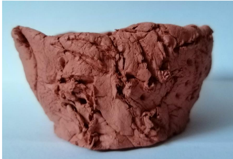
Slika 34. Mala čaša (E. M., 6 god.)

Djevojčica je svoj rad nazvala Mala čaša . Oblikovala je čašu s jednim otvorom te ju je reljefno ukasila. Od ukrasa možemo primijetiti okrugle udubine te razne linije. Djevojčica se nije trudila zagladiti površinu prilikom oblikovanja te onda ukrašavati, već je na grubo oblikovanu čašu krenula raditi reljefne ukrase.