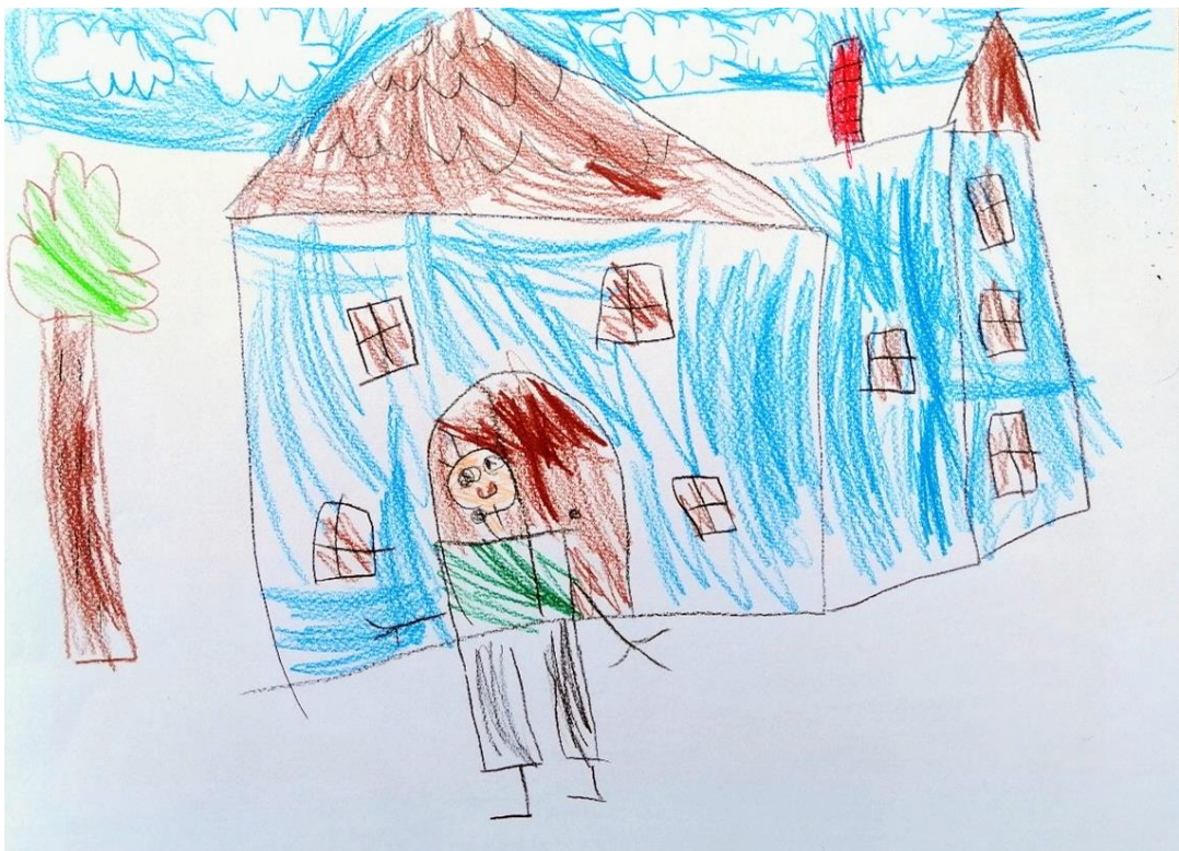
Slika 12. Grof i dvorac (A. M., 6 god.)

jednoga. Razlika ovog i prethodnog crteža je i u bojama kojima su obojeni zidovi i krov dvorca. Zidovi glavne zgrade ovog dvorca su obojeni ljubičastom bojom dok su tornjevi roza bojom obojeni, a krov je obojen u duginim bojama. Portal dvorca je prikazan jednako kao i na prethodnoj slici. Tornjevi su također prikazani slično kao i krov koji je kos. S desne strane dvorca djevojčica crta sebe, a s lijeve strane sestru. Okoliš dvorca prikazan je minimalistički. Djevojčica prikazuje tlo dvjema paralelnim, zelenim, valovitim linijama, a nebo zadebljanom plavom linijom. U ovom prikazu dvorca djevojčica se koristi slobodnijim izrazom. Nema namjeru doslovno prikazati boje zidova i krova, već unosi svoje viđenje boja kojima su obojeni zidovi dvorca. No u crtežu se može prepoznati i doza realističnosti koja se očituje u glavnom portalu i prozorima oko njega. Prilikom crtanja djevojčica se fokusirala na prikaz samog dvorca, ali ne i okoliša.