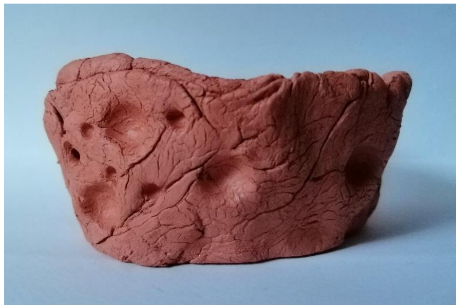
Slika 35. Čaša (J. M., 6 god.)

Djevojčica je svoj rad nazvala Mala čaša . Oblikovala je čašu s jednim otvorom te ju je reljefno ukasila. Od ukrasa možemo primijetiti okrugle udubine te razne linije. Djevojčica se nije trudila zagladiti površinu prilikom oblikovanja te onda ukrašavati, već je na grubo oblikovanu čašu krenula raditi reljefne ukrase.