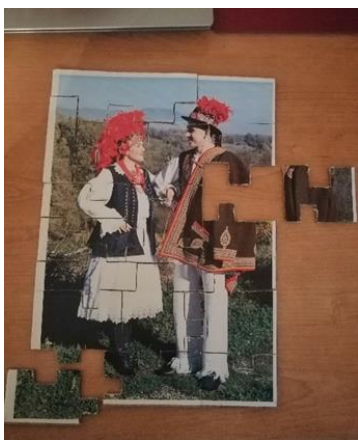
Slika 16. Puzzle