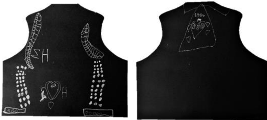
Slika 21. Lajbek (L. H., 6 god)

nekoliko simbola srca. Djevojčica pri izradi svoga crteža koristi deblji zlatni i srebrni flomaster. Možemo zaključiti kako je djevojčici prezentirani lajbek poslužio kao poticaj za crtanje svoga personaliziranog lajbeka.