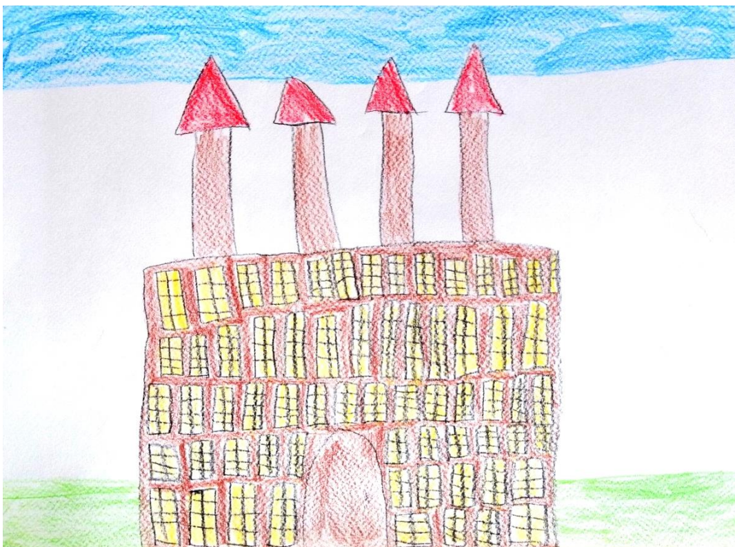
Slika 13. Dvorac (M. M., 6 god.)

strane može se uočiti samo jedan toranj. Prije tornja djevojčica je nacrtala jedan malo povišeni dio s ravnim krovom iz kojeg izlazi dimnjak. Usporedbom crteža i izgleda dvorca možemo uočiti kako je djevojčica realistično prikazala sve dijelove dvorca te položaj prozora na njemu, kao i krov. Djevojčica također realistično prikazuje i boju krova i glavnog portala, dok je zidove obojila plavom bojom, čime prikazuje svoje viđenje dvorca. Ispred dvorca djevojčica je nacrtala grofa Stjepana. Da je nacrtan grof prepoznamo po brkovima i zeleno-crnoj kombinaciji odjeće, što je grof nosio jer je bio lovac, kako je komentirala djevojčica. Pokraj dvorca djevojčica je nacrtala drvo kao i djevojčica L. K. na slici 10. Nakon analize ovoga crteža može se zaključiti kako je djevojčica dobro uočila kako dvorac izgleda te ga je realistično prikazala na svome crtežu. Nacrtanom dvorcu pridružila je i grofa, čime pokazuje kako razumije i povezuje dvorac s grofom koji je tamo živio.