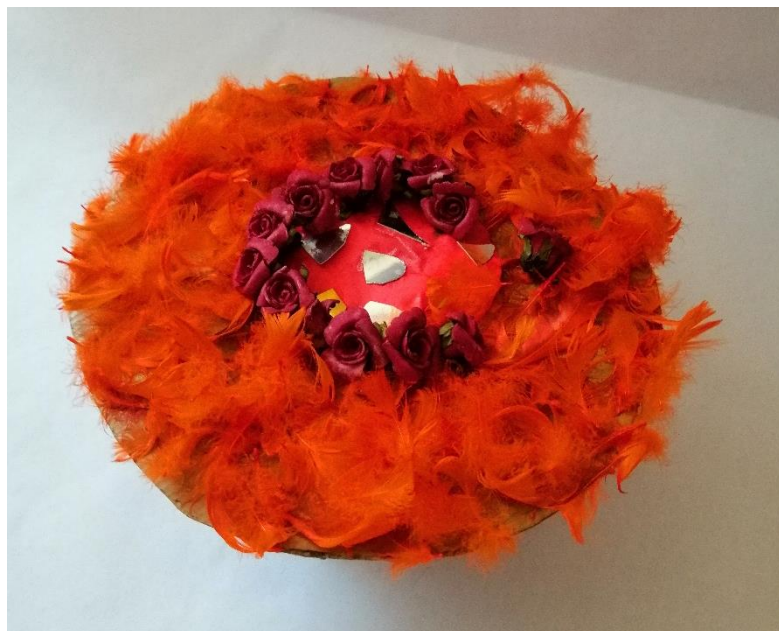
Slika 28. Naplit – gornji dio

Prilikom oblikovanja kostura naplita pomogla sam im ja jer je dijelove bilo potrebno izrezati od kartona te slijepiti vrućim ljeplom. Djeca su donijela odluku da će vijenac izgledati kao šešir te sam prema njihovim uputama izrezala i sljepila kostur