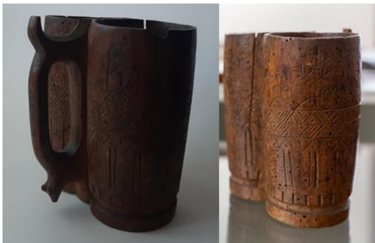
Slika 3. Pastirska čaša

Osim preslica u Gradskom muzeju Jastrebarsko čuva se primjerak pastirske čaše iz 1880. godine. Pastirska čaša je još jedan primjerak umjetničke obrade drva. Nepoznati pastir s kraja 19. stoljeća ukrasio je ovu putnu čašu od trešnjinog drveta. Na čaši se prepoznaju motivi mješovite vegetacije, odnosno drvca s tankim granama u gornjoj zoni, dok se u donjoj zoni prepoznaju geometrijski oblici. Izrezbareni su motivi strelica prema gore koje se čine kao da su podzemne, odnosno između motiva drveta i strelica nalazi se srednji dio koji je prikazan mnoštvom kosih linija koje formiraju trokute. Takav prikaz možemo tumačiti kao drvca koja rastu iz tla, a ispod sloja tla nalazi se unutarinja, podzemna sila koja ih tjera da rastu. Držak čaše je također ukrašen te je na donjem dijelu plastični oblikovana mala životinjska glava. Čaša je i svojom funkcijom interesantna i neobična. Naizgled je dvodijelna, ali je iznutra spojena otvorom, što je čini zaigranom u naravi jer nudi dvostruko ispijanje pića ( https://www.gmj.hr ).