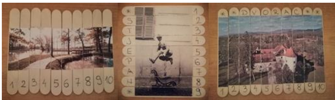
Slika 4. Slagarica