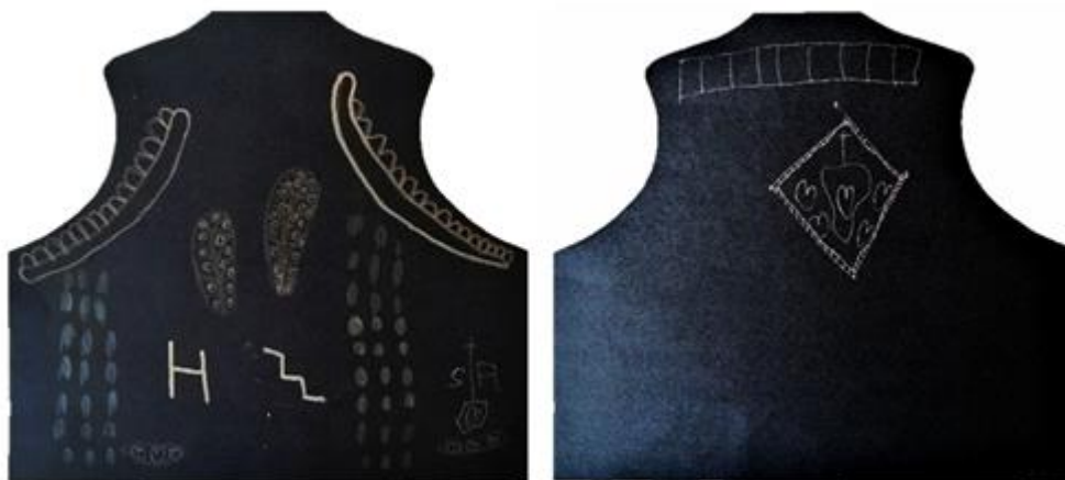
Slika 18. Lajbek (E.B., 4 god.)

Za ovu likovnu aktivnost pripremila sam crni hamer papir izrezan u obliku lajbeka te zlatne i srebrne flomastere.