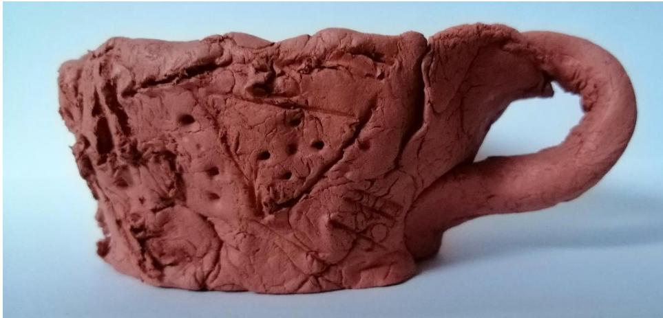
Slika 37. Čaša s ručkom (M. K., 6 god.)

Djevojčica M. K. modelira čašu po uzoru na pastirsku čašu, no izradila ju je s jednim, a ne s dvama otvorima, jer joj je to bilo teško, kako je ona komentirala. Djevojčica je jedina od svih koji su modelirali čašu stavila i ručkicu. Prilikom oblikovanja čaše djevojčica se nije vodila primjerom, već ju je ukasila prema vlastitom nahođenju. Tako je djevojčica površinu čaše oblikovala dubokim okruglim uleknućima, jednim trokutom, trima paralelnim ravnim crtama, krugom i ravnim linijama.