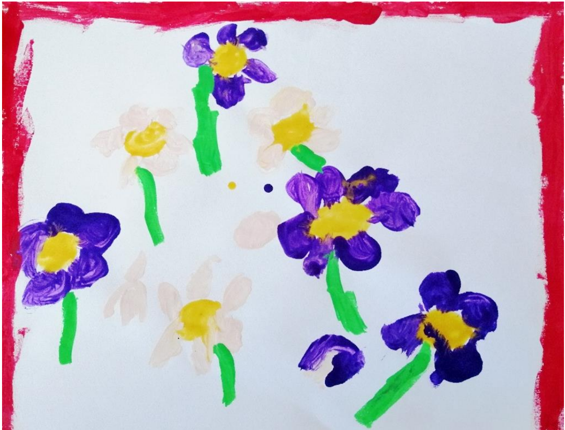
Slika 23. Zastor (E. V., 6 god.)

Djevojčica E. V. odlučila se na prikaz fragmenta sa zastora koji je poslužio kao poticaj za ovu likovnu aktivnost. Na slici koju je nacrtala djevojčica nalazi se sedam cvjetova razbacanih po papiru. Djevojčica cvjetove prikazuje šablonizirano sa žutom sredinom i okruglim laticama oko nje, te ispod cvijeta crta zelenu stabljiku prikazanu ravnom linijom. Djevojčica cvijeće s triju strane obrubljuje crvenim linijama. Na prikazanom zastoru cvjetovi su poslagani u tri linije, ispod pojasa, te je dio koji okružuje središnji dio također prepun cvijeća. No djevojčica doživljava položaj cvijeća na „zatoru“ drugačije te to tako i prikazuje.