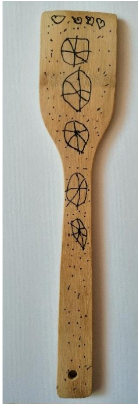
Slika 30. Preslica (F. D., 6 god.)

Rad dječaka F. D. je sličan radu dječaka N. J. U ovom radu se također nalazi pokušaj prikazivanja rozeta, no dječak F. D. nacrtao ih je nešto više. Na vrhu kuhače dječak je nacrtao četiri šablonizirana simbola srca koji se mogu pronaći i na preslicama koje su poslužile kao poticaj ovome radu. Preostali prazan prostor dječak je ukrasio sitnim točkicama te je time završio svoj rad.