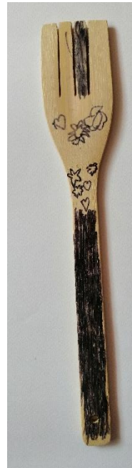
Slika 33. Preslica (E. Ž., 5 god.)

U ovom radu dječaka L. N. može se pronaći sličnosti s radom dječaka M. Š. Dječak na vrhu kuhače crta krug i ispod njega križ. Ta dva simbola okružuju točkice poslagane u jedan niz koje je iscrtao uz rubove kuhače. Rubove također ocrtava jednom obrisnom linijom.