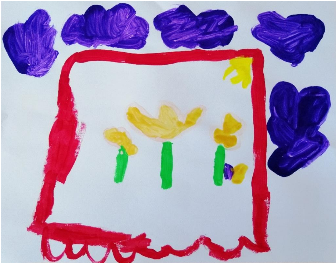
Slika 26. Zastor (M. B., 5 god.)

Slika djevojčice M. B. gotovo je jednaka slici djevojčice L. Č. Razlikuje se jedino u cvjetovima koji se nalaze oko zastora. Djevojčice su tijekom slikanja sjedile jedna pokraj druge te su svoje asocijacije međusobno podijelile.