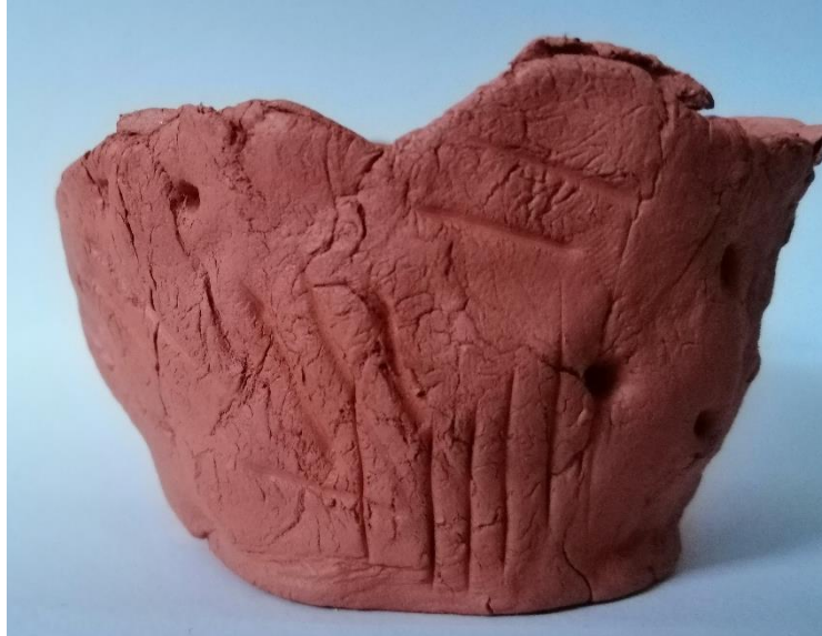
Slika 36. Čša (D. B., 6 god.)

krenula oblikovati površinu. Ukrasila ju je kružnim udubljenjima. Tijekom sušenja nastale su dublje i pliće pukotine na površini čaše stvarajući izražajnu teksturu. Kasnije je djevojčica komentirala kako joj se baš sviđaju te pukotine iako ih nije željela napraviti.