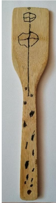
Slika 29. Preslica (N. J., 6 god.)

Dječak N. J. svoju je kuhaču iscrtao nešto oskudnije. Na gornjem dijelu se može primijetiti pokušaj prikazivanja dvije rozete. Dječak rozete prikazuje kao krug unutar kojeg je nacrtao dvije ravne linije koje se sijeku pod pravim kutem i čine simbol plusa. Na donjem dijelu je nacrtao mnoštvo točkica. Dječak je, promatrajući fotografije, primijetio kako se na većini njih nalaze rozete te ih je i on odlučio nacrtati u svome radu.