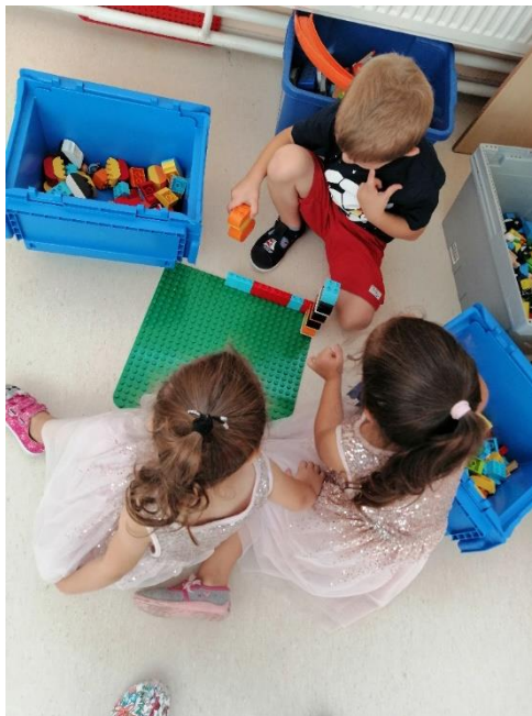
Slika 7. Oblikovanje Lego duplo kockama

Nakon promatranja fotografija djeca su prema izboru mogla graditi dvorac od Lego duplo kocaka ili nacrtati dvorac, ljude kako žive u dvorcu, perivoj ili nešto drugo što im se najviše svidjelo.