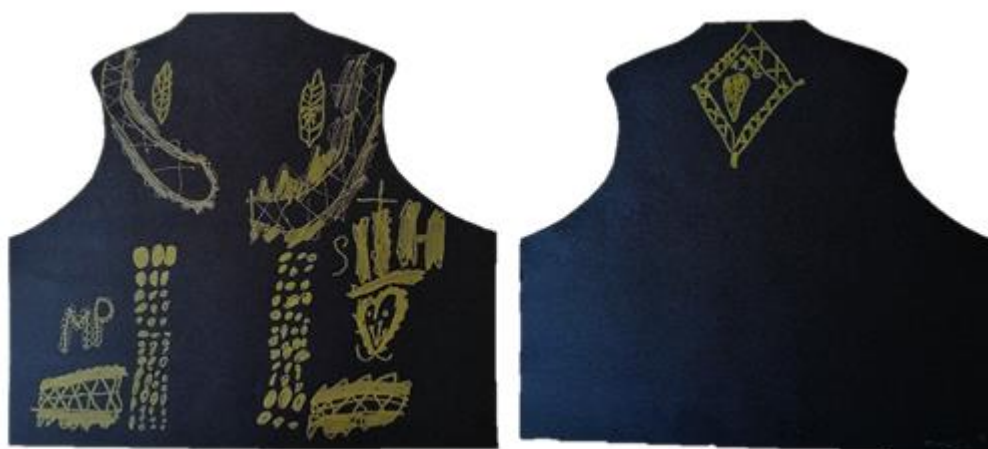
Slika 19. Lajbek (M. P., 7 god)

Djevojčica E. B. u svome radu prikazuje sve dijelove veza na približno jednakim položajima kao i na prezentiranom lajbeku. Dio veza s kragne prikazuje s manje detalja, kao i dio veza s leđne strane lajbeka. U likovnom izrazu djevojčice može se primijetiti kako više pozornosti pridodaje dijelovima veza koji sadrže šablonizirane prikaze srca. Također djevojčica crta i mnoštvo gumba svrstanih u po tri stupca sa svake strane.