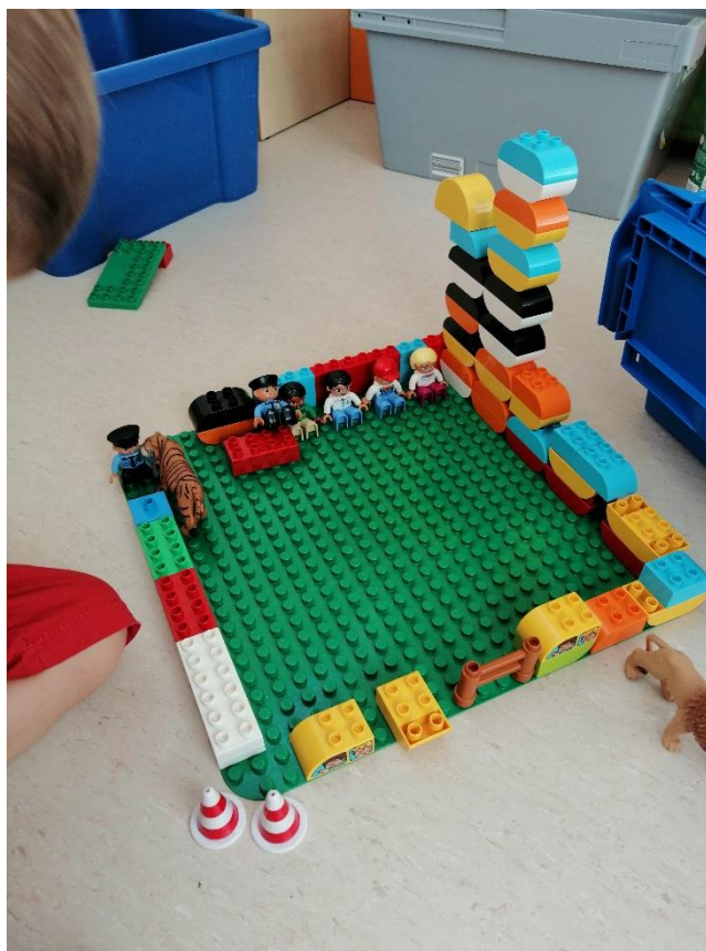
Slika 9. Dvorac Erdödy

U aktivnosti oblikovanja Lego duplo kockama sudjelovali su dječak (4 godine) i dvije djevojčice (3 i 4 godine), dakle nastao je grupni rad.