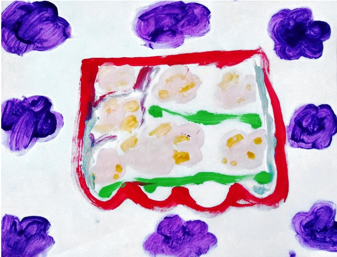
Slika 24. Zastor (A. S, 6 god)

Djevojčica A. S. crvenom bojom slika vanjske linije prikazanog zastora te unutar njih smješta cvjetove poredane u dva niza. Za razliku od prethodne slike na ovoj vidimo cvijeće koje nije šablonizirano. Djevojčica linije poredanog cvijeća odvaja zelenom linijom te koristi plave linije s bočnih strana. Oko središnjeg dijela zastora djevojčica crta ljubičaste cvjetove. Prikazani zastor uistinu jest obrubljen cvjetovima, no u odabiru boje djevojčica je iskoristila slobodu izražavanja te ih prikazala ljubičasto.