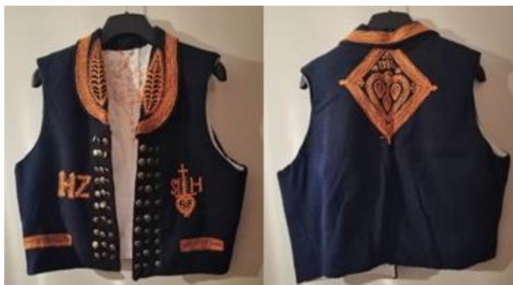
Slika 17. Lajbek

UVID U PRETHODNA ZNANJA VEZANA UZ TEMU, PITANJA: