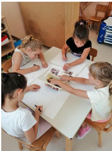
Slika 8. Crtanje