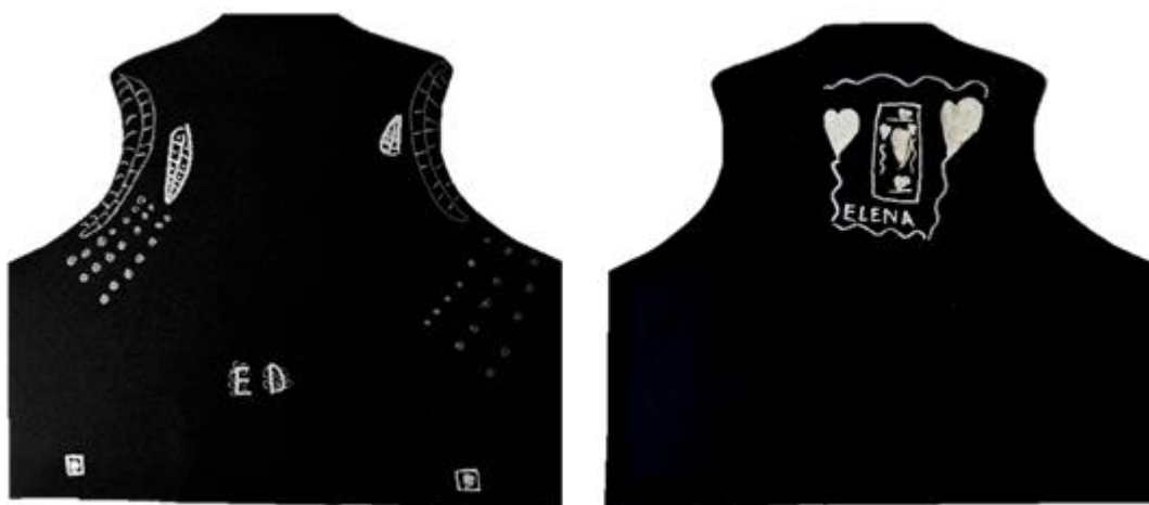
Slika 20. Lajbek (E. D., 5 god.)

Dječak M. P., za razliku od prijašnjeg crteža, u svome likovnom radu crta puno više detalja te ih smješta u prostoru jednako kako su izvezena i na prezentiranom lajbeku. U dijelu veza koji se nalazi na kragu dječak prekrži kose crte i cik-cak crte prikazuje mnogo većima nego što one ustvari jesu te se može zaključiti kako nema dovoljno strpljenja za mnoštvo malih detalja, a želi ih sve prikazati. Na lijevoj strani dječak je nacrtao svoje inicijale te ih ukrasio po uzoru na prikazani lajbek. Dječak je prilikom razgovora zapamtio kako je zapravo svaki vlasnik imao izvezene svoje inicijale te je tako i on želio ovaj crtež i lajbek personalizirati. Dječak također realistično prikazuje vez koji se nalazi ispod inicijala. Prikazuje ga ukrašena mnoštvom kosih i cik-cak linija, za razliku od djevojčice koja na prethodnom crtežu taj dio crta ukrašen šabloniziranim simbolom srca. Na leđnoj strani lajbek dječak se također trudi prikazati sve detalje, ali to čini malo neurednije jer je već polako gubio interes. Pri izradi svoga crteža dječak kombinira sve ponuđene boje flomastera i debljine kako bi prikazao raznolikost linija kojima je ukrašen lajbek.