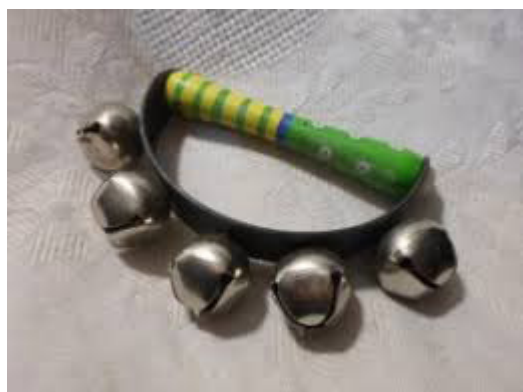
Slika 13. Praporci

Praporci se sastoje od metalne loptice u čijoj se unutrašnjosti nalazi metalna kuglica. Loptice su pričvršćene za drveni ili kožni polukrug. Praporci su nekada bili dio konjske opreme pa često njihov zvuk podsjeća na kas konja (Kusovac, 2010).