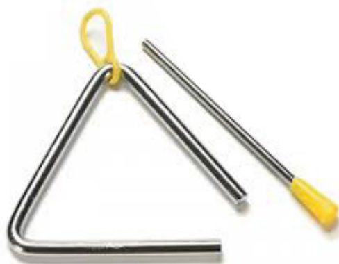
Slika 9. Triangl

Triangl je napravljen od čelične šipke savijene u obliku trokuta, sa jednim otvorenim uglom. Držimo ga obješenim o palac lijeve ruke, a zvuk dobijemo udarcem metalnog štapića koji se nalazi u desnoj ruci. Triangl je metalni trokut obješen o vrpцу na kojemu se zvuk dobiva udaranjem metalnim štapićem (Kusovac, 2010). Triangl je orkestralno glazbalo s najmanjom masom, ali najprodornijim zvukom (Dearling, 2005).