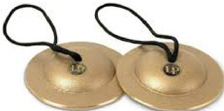
Slika 10. Činele

Činele su okrugle brončane pločice nalik tanjuru. Možemo ih koristiti u paru ili pojedinačno. Zvuk se dodiva udaranjem i dugo traje, a možemo ga prekinuti pritiskom prsta ili dlana o činelu. Činele mogu biti različitih veličina koje doprinose i različitoj visini zvuka. Zvuk se proizvodi udarom jedne činele u drugu, ali i pomoću batića ako koristimo samo jednu činelu (Kusovac 2010).