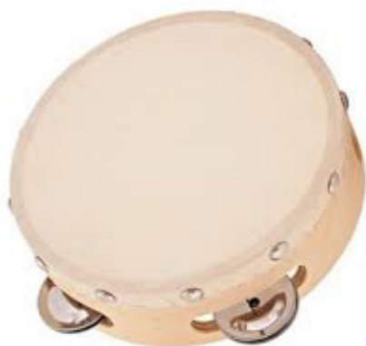
Slika 12. Tamburin

Tamburin ili def sličan je ručnom bubnju, a razlika je u metalnim tanjurićima koji su ugrađeni u drveni obruč. Pri udaranju desne ruke, prstima ili dlanom, oni zveckaju dajući karakterističan zvuk (Kusovac, 2010).