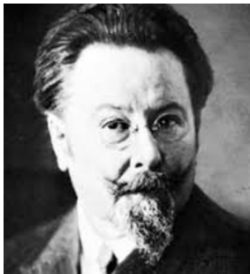
Slika 2. Emille Jaques-Dalcroze

Godine 1903. švicarski skladatelj i glazbeni pedagog održao je prvi eksperimentalni sat ritmike nakon kojeg je 1921. godine objavio zbirku „Ritam, glazba i obrazovanje“. Njegova metoda sastoji se od tri komponente: euritmija, solfeggio i improvizacija. Svalina (2015) smatra da je za kompletno glazbeno obrazovanje glazbenika potrebno da ono ravnopravno obuhvaća sva tri elementa. Vodeći se tim načelima „izumio je sustav učenja i ovladavanja ritmikom, tzv. ritmičku gimnastiku ili euritmiju“ (Hrvatska enciklopedija, 2018). Njegova ideja je bila da se osjećaj za ritam kod djece može razvijati određenim pokretima