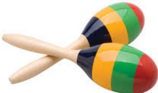
Slika 11. Zvečke (marakas)

Zvečke ili marakas su instrumenti kruškastog, valjkastog ili loptastog oblika preuzeti iz indijskog folklora. Ispunjeni su raznovrsnim zrnjem. Mogu se koristiti s drškom ili bez nje. Zvuk se dobije tako da se instrument trese naprijed-nazad (Kusovac 2010).