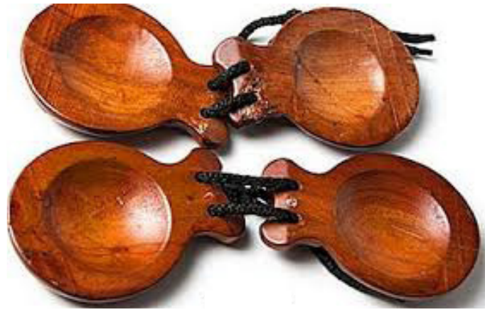
Slika 14. Kastanjete

Kastanjete su ritamske udaraljke porijeklom iz Španjolske. Školjkastog su oblika i napravljene su od komada drveta. Vežu se uzicom jedan uz drugi i za prste svirača koji ih pokretom šake ritmički udara jedan o drugi. Kusovac (2010) naglašava da se za dječju upotrebu primjenjuju kastanjete koje su pričvršćene za dršku.