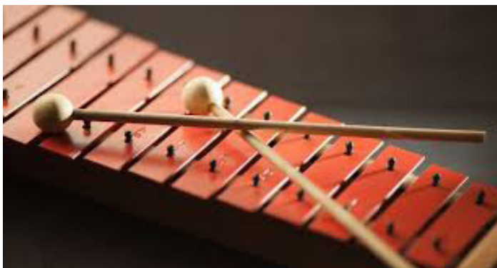
Slika 17. Ksilofon

Izgledom vrlo sličan metalofonu, ali sa drvenim pločicama raspoređenih po uzoru na klavijaturu. Koristimo ga za sviranje brzog ritma zbog njegova kratkog zvuka koji ne odzvanja. Zvuk ksilofona kratak je i oštar. Svira se batićem obloženim tvrdim filcom (Odak, 1997, str.197).