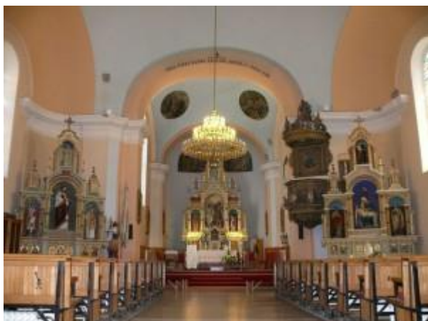
Slika 6. Crkva Svetog Ivana Krstitelja