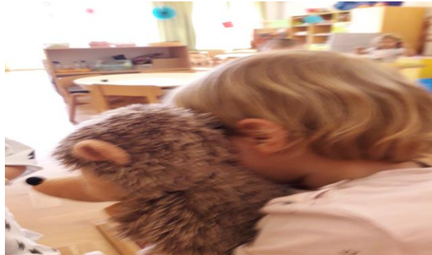
Slika 12. Zagrljaj

Ubrzo se stvara emotivna povezanost djece s lutkom. Emocije, osnovni pokretač svakog stvaralaštva, pokrenut će djetetov govor, komunikaciju, maštu, želju za stvaralaštvom i pokretom. Iako vide odgojitelja kako pokreće lutku u ruci, djeca ulaze u interakciju s Ježićem kao da je živo biće, obraćaju mu se, grle ga i žele se igrati s njime.