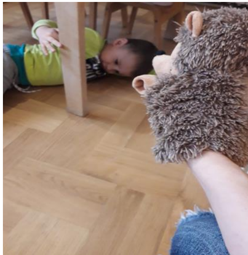
Slika 25b. Dječak J. pristaje izaći iz svog „skrovišta“