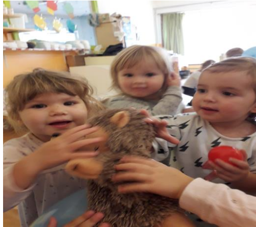
Slika 9. Pozdravljanje s Ježicem