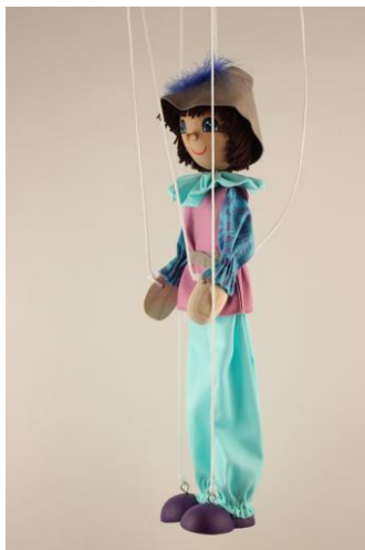
Slika 8. Marioneta.