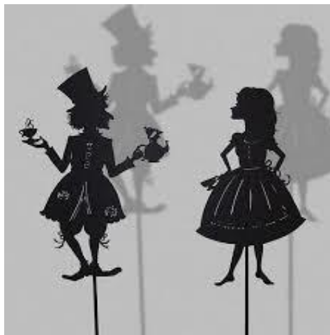
Slika 6. Lutke sjene.

Lutke sjene su dvodimenzionalne, plošne lutke, koje se lako izrađuju, dostupne su svima, a scena za njih se brzo postavlja. One ne oponašaju živo biće ni predmet, nego samo njegovu sjenu. Takva se lutka nalazi između svjetlosti i platna, a pokreće ju animator rukama. Položaj tijela prikazan je tako da su glava i noge prikazani iz profila, a tijelo s prednje strane. Platno na kojem se sjene projiciraju mora propuštati što više sjene, a istovremeno i skrivati animatora (Županić BeniĆ, 2009).