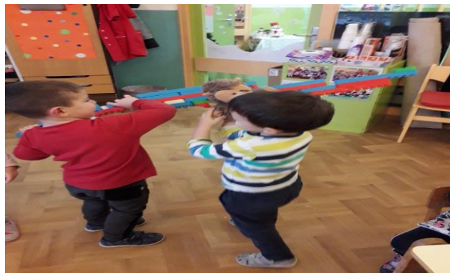
Slika 28. Dječak J. Animirajući lutku lijevo-desno pozdravlja Dječaka T.