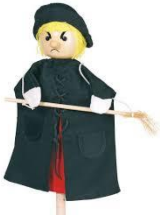
Slika 7. Javajka.