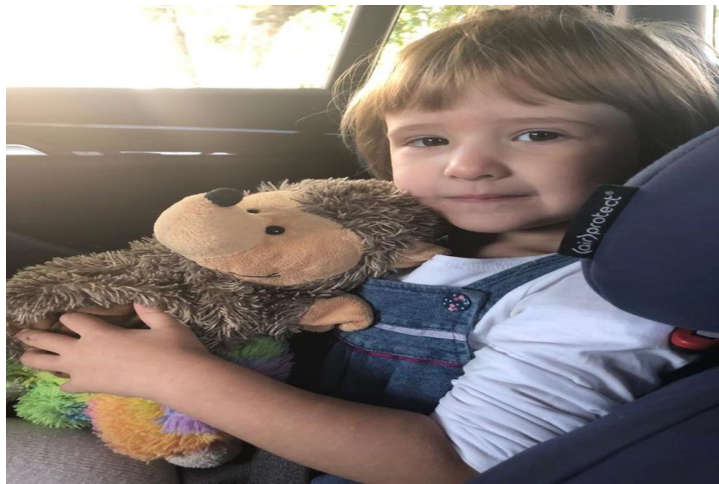
Slika 21. U automobilu