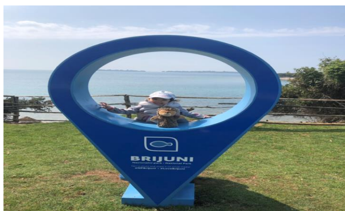
Slika 18. NP Brijuni