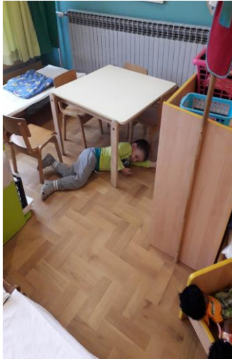
Slika 25a. Dječak J. se osamljuje i zavlači pod stol