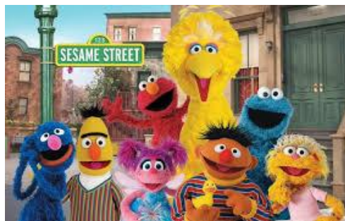
Slika 4. Sesame Street. Izvor: https://teachingkidsnews.com/2019/11/10/sesame-street-celebrates-50-years/ . (9.6.2020.)