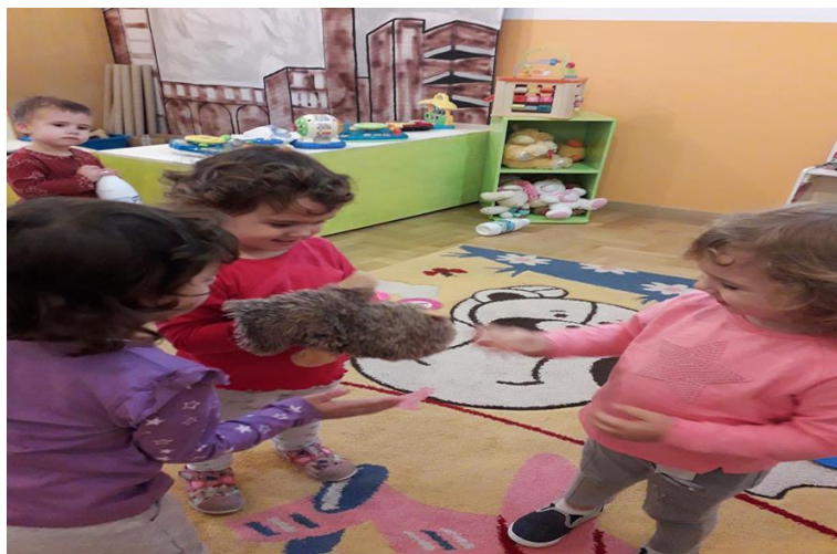
Slika 14. Prva dramska improvizacija