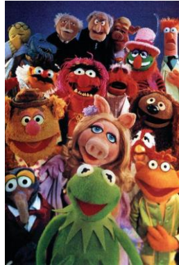
Slika 3. The Muppet Show.

izmišljena bića. One mogu biti vrlo jednostavne, takve su načinjene od čarapa, ali isto tako mogu biti i vrlo složene, takve su namijenjene televizijskoj i filmskoj produkciji. Tijelo zijevalice je najčešće trodimenzionalno, s rukama i nogama. Lutkar lutku obično drži iznad glave ili ispred tijela, a pozornicu čini samo paravan u visini animatora. Najpoznatije zijevalice su tzv. mapeti, koji su prepoznatljivi po jako širokim ustima i velikim očima, a pojavili su se i u televizijskim emisijama The Muppet Show i Sesame Street , 70-ih godina 20. st. (Županić Benić, 2009).