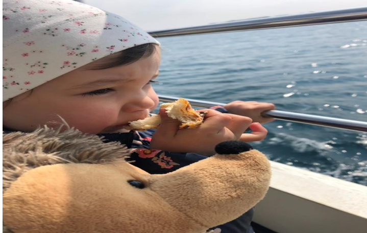
Slika 20. Na trajektu