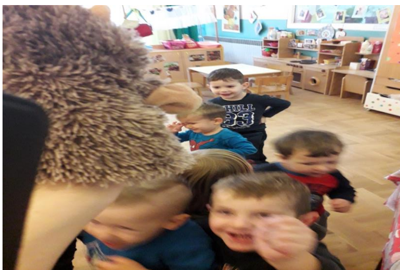
Slika 24. Ježić poziva djecu na tepih