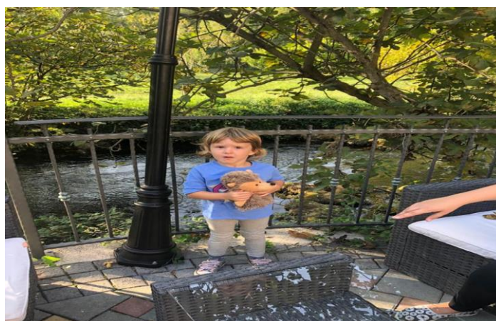
Slika 19. NP Krka