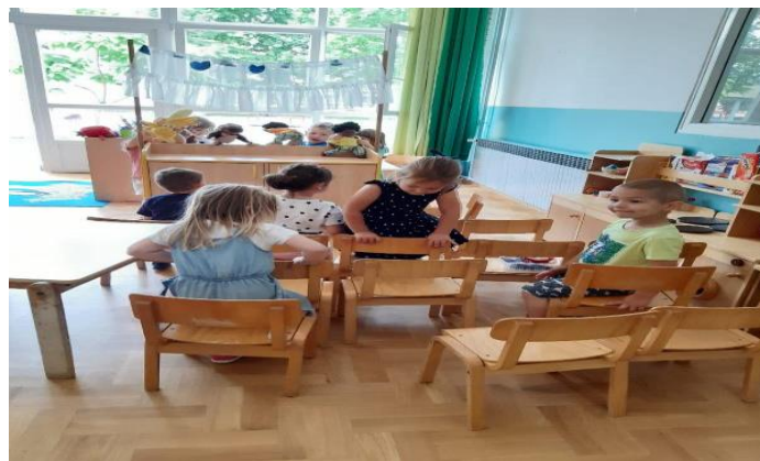
Slika 29. Priprema gledališta