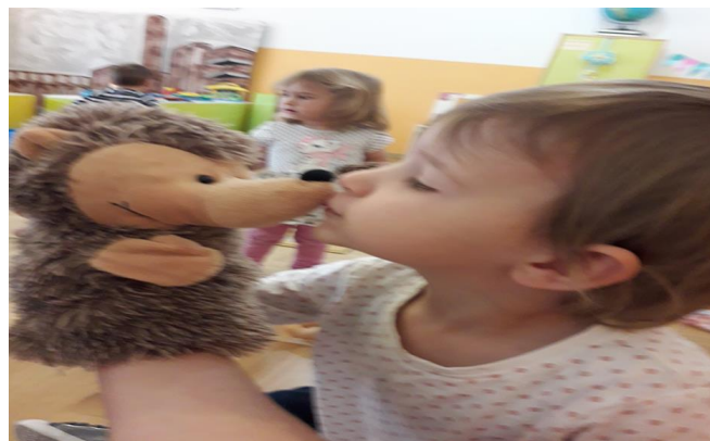
Slika 13. Poljubac prijateljstva

Djevojčica na Slici 14. prvi puta uzima Ježića u ruke i imitira odgojiteljev pristup djeci. Djevojčica S. pozdravlja djecu: „Bok, daj pet!“