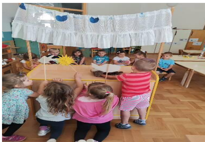
Slika 30. Lutkarska improvizacija sa štapnim i ručnim lutkama

S ljetnom organizacijom rada dolazi i do promjene u odgojnim skupinama. Djeca i odgojitelji odlaze na godišnji odmor, a skupine se spajaju. Odgojna skupina Točkice mijenja prostor dnevnog boravka. Djeca u novoj sobi odmah primjećuju paravan za kazališne predstave, kao i veliku ponudu ginjola lutki domaćih i šumskih životinja. Jedno jutro Djevojčice K. i M. pozivaju Dječaka D. da im se pridruži u igri s lutkama. Djeca uzimaju lutke domaćih i šumskih životinja te odlaze iza paravana. Lutkarskom improvizacijom djeca privlače pažnju Dječaka F. koji dolazi u gledalište.