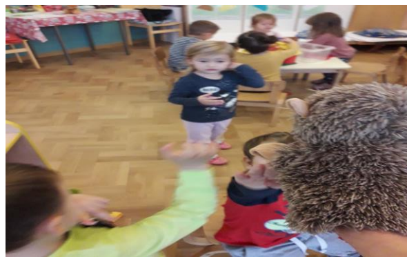
Slika 25d. Dječak J. i Ježić vraćaju se ostaloj djeci

Odgojiteljica je svjesna moći koju lutka posjeduje u interakciji s dječakom te lutka postaje didaktičko sredstvo za poticanje samopouzdanja, pozitivne slike o sebi te poticanje razvoja govora, što na kraju dovodi do socijalizacije s vršnjacima. Odgojiteljica je pronašla način kako umiriti dječaka kada je napet, kako ga razveseliti kada je žalostan i utješiti kada je tužan. S vremenom se dječak sve rjeđe zavlačio pod stol, a svoju ljutnju i frustraciju je pokušavao verbalizirati unatoč govornim poteškoćama.