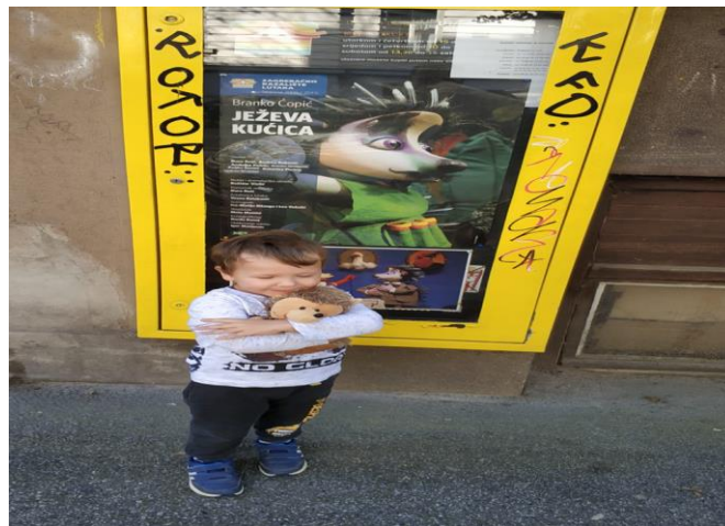
Slika 16. Zagrebačko kazalište lutaka, predstava „Ježeva kućica“