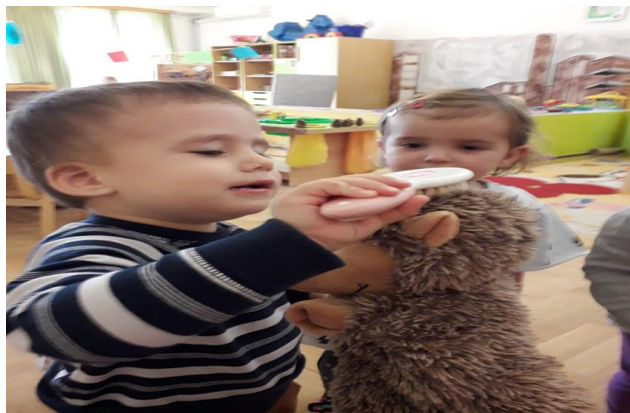
Slika 11. Česljanje Ježica