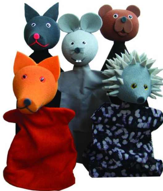
Slika 2. Ginjol lutka.