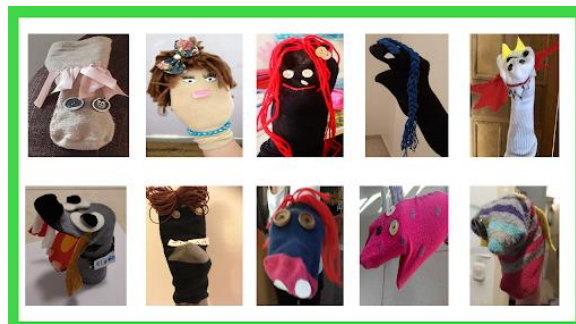
Slika 5. Zijevalica.