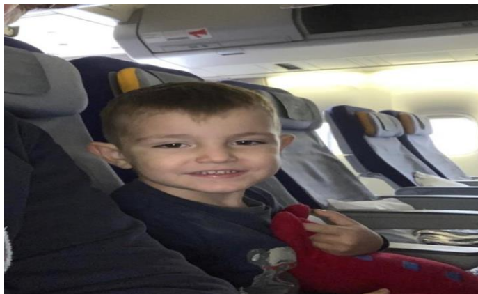
Slika 22. Let avionom