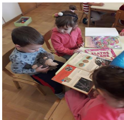
Slika 23d. Djevojčica M. poziva Dječaka J. da sjedne pored nje

Prilikom jednog razgovora lutke i djece, Dječak J. ponovno se ljuti jer i druga djeca okupljaju Ježićevu pažnju. Burno reagira i zavlaci se pod stol (Slika 25a). Odgojitelj mu prilazi s lutkom u ruci (Lutka govori: „Vidim da si ljut, ali ne moraš biti, ja sam i tvoj prijatelj, kao i sve druge djece. Dođi k nama da se zajedno igramo“). Dječak isprva negoduje, odmahuje rukom, ne želi izaći. Lutka svojim pokretima izražava emocije suosjećanja i tuge te govori: „I ja sam žalostan kad te vidim ispod stola uplakanog, ako izađeš, možemo se zajedno vratiti kod djece i zajedno se igrati (Slika 25b). Dječak se umiruje, izlazi iz svog skrovišta, pruža Ježiću ruku (Slika 25c.) te zajedno odlaze natrag na tepih gdje su ostala djeca (Slika 25d.).