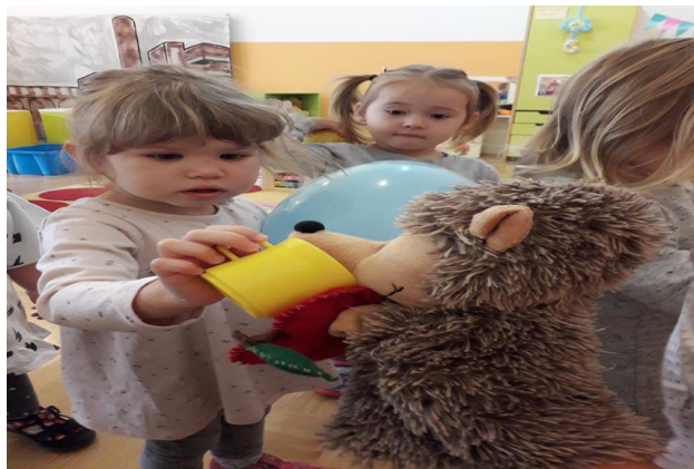
Slika 10. Topli čaj za Ježica