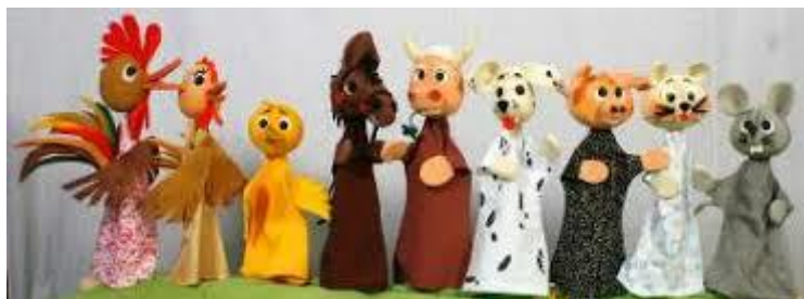
Slika 1. Scenske lutke.

Prilikom izrade lutaka mogu se koristiti različiti materijali ili kombinacije materijala, jedino je važno da odabrani materijal odgovara lutki i da se maksimalno iskoriste sve njegove mogućnosti. Lutkin karakter važno je likovno izraziti i naglasiti tako da on bude jasan i prepoznatljiv svima koji ga vide. Glava može biti izrađena od raznih materijala: drveta, papira, gume, spužve, stiropora, tkanine, vune, gipsa, plastike i sl. Njezin osnovni oblik može biti krug ili kugla, s volumenom ili plošan, a onda se na njega nadograđuju ostali detalji. Može biti i jajolik, izdužen horizontalno ili vertikalno, kockast, trokutast, iskrivljen ili grbav, i svaki od njih predstavlja neki karakter.