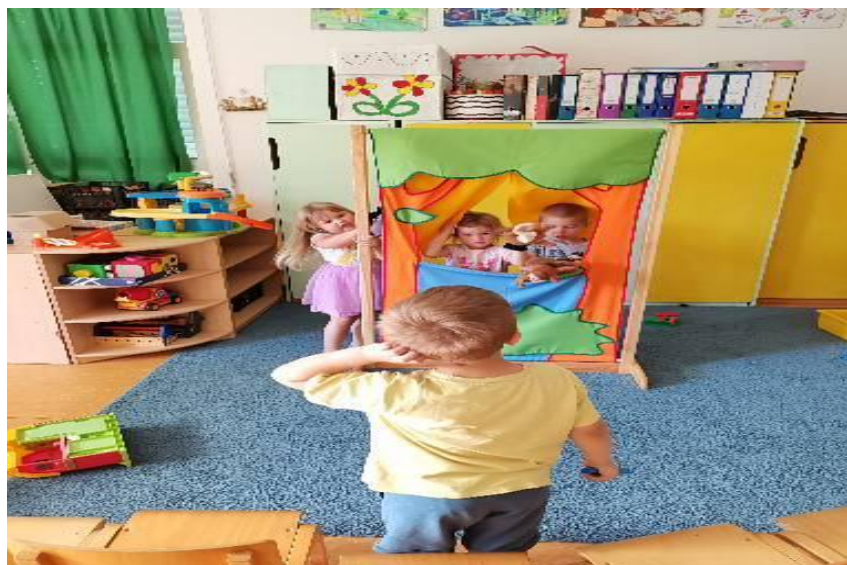
Slika 31. Lutkarska improvizacija u novom prostoru