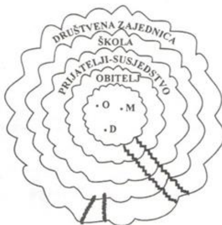
Slika 2. Područja identiteta (Pregrad, 1996; str. 178)

Kao što prikazuje slika 2, intenzitet gubitka ovisi o dubini zasječenosti u krugove sigurnosti i identiteta, širini preostalog prostora, stupnju nesigurnosti, odnosno stupnju nezadovoljenja egzistencijalnih potreba djeteta te stupnju kaotičnosti i nepredvidivosti života nakon gubitka. Stoga se može reći kako gubitak više ugrožava djecu nego odrasle zato što su ona bespomoćnija, a samim time i nesigurnija, egzistencijalno ovisnija o neposrednoj okolini, imaju manje krugova sigurnosti i identiteta, jer ih još nisu stigla izgraditi te su kognitivno nerazvijenija, pa ne razumiju pojam smrti niti njenu konačnost (Pregrad, 1996).