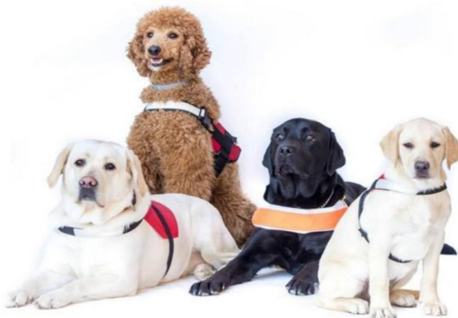
Slika 1. Terapijski i rehabilitacijski psi