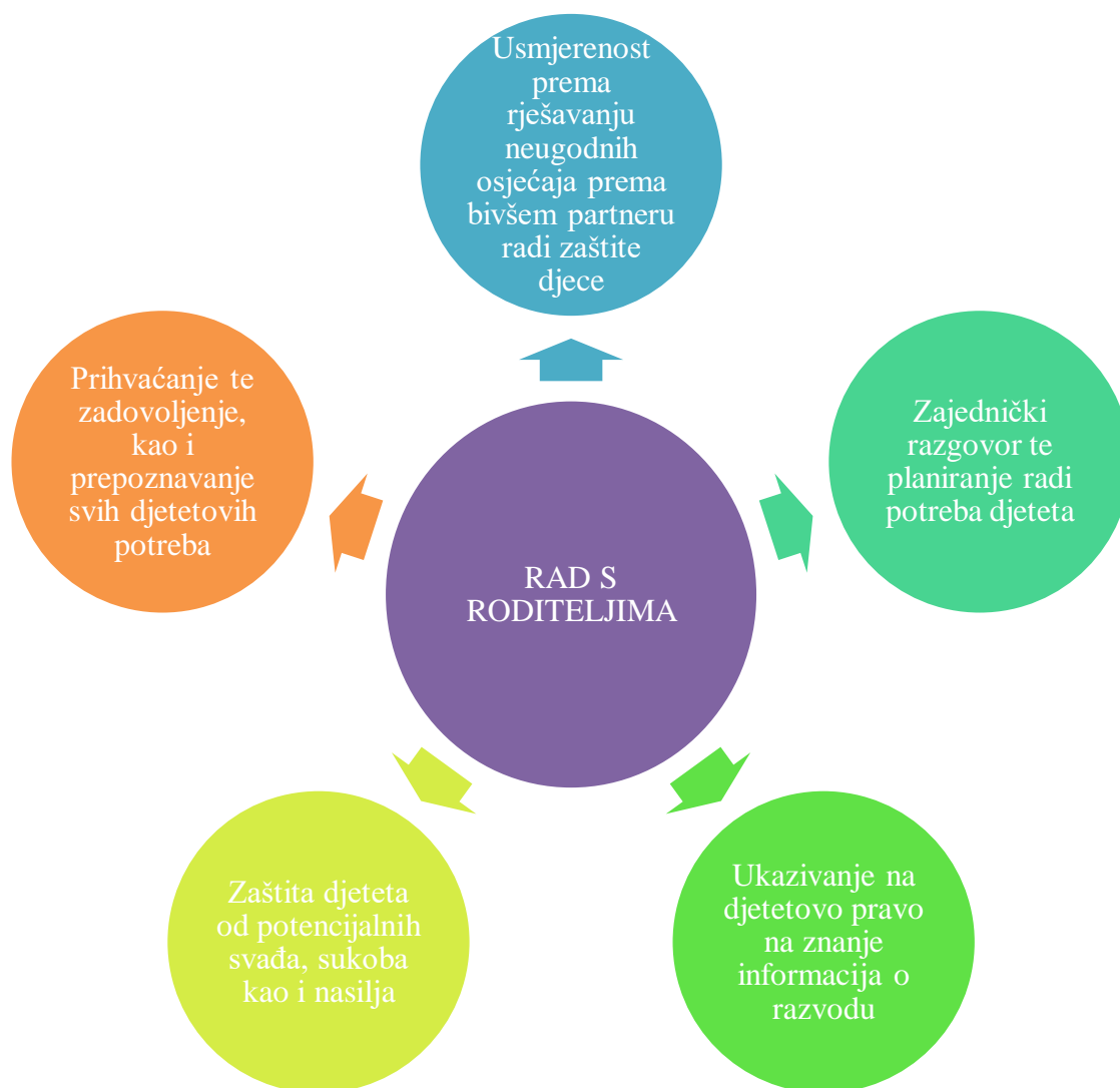
Slika 3. Rad s roditeljima