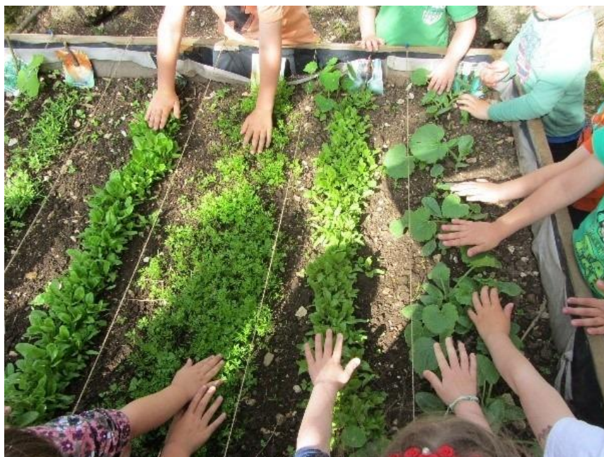
Slika 1. Djeca sade biljke u vrtićkom vrtu