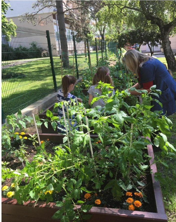
Slika 2. Djeca uz odgojiteljicu istražuju promjene na biljkama u Dječjem vrtiću Maksimir