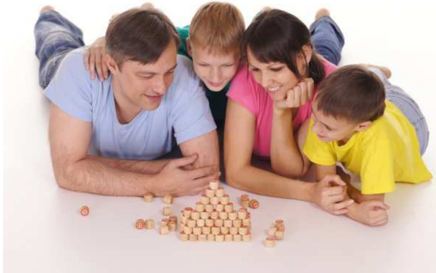
Slika 4. Zajednička igra roditelja i djece