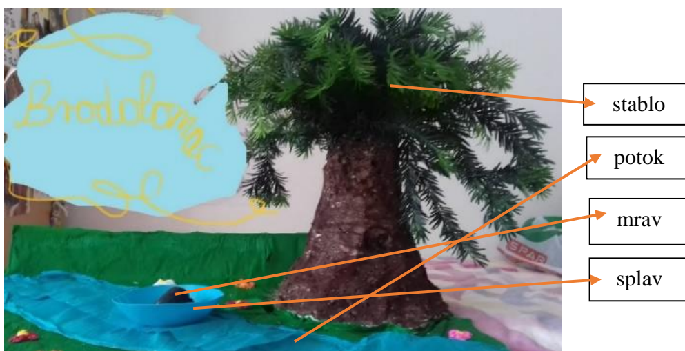
Slika br.1 Primjer metodičkoga artefakta

U odgojno-obrazovnoj praksi metodički je predložak potreban za izvođenje metodičkoga čina. U metodici hrvatskoga jezika, to je primjerice pjesma koju odgojitelj predstavlja djeci te s pomoću nje utječe na dječji razvoj (kognitivni, motorički, govorni, socioemocionalni razvoj). Za razumijevanje pojma metodičkoga čina prikazat ćemo primjer interpretacije pjesme Stanislava Feminića, Brodolomac . Poezija se interpretira u obliku igrokaza, uz pomoć izrađenoga metodičkog artefakta.