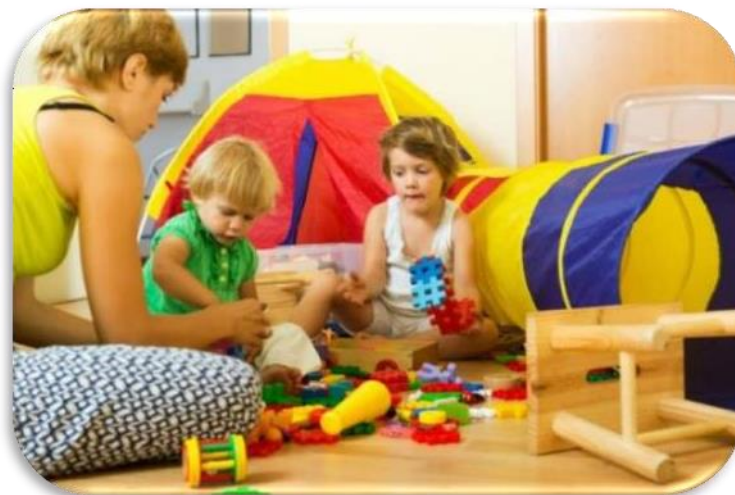
Slika 12 Djeca u igri

Postoje razne vrste dječje igre. Po Parten 1932. prema Vasta i sur. 2000. promatranje je dio dječje igre u kojem dijete promatra drugu djecu kako se igraju, ali se ne uključuje u igru. Samostalna igra se koncentrira na aktivnost, dijete ne primjećuje prisutnost drugih. U usporednoj igri, dijete se igra pored ostale djece, ali nema potrebe za suradnjom ili druženjem. Tijekom povezujuće igre, dijete se igra s drugom djecom, ali nema zajednički cilj kao oni. Najaktivnija i najproduktivnija igra je suradnička. Djeca surađuju tijekom cijele aktivnosti, postavljaju ciljeve, prilagođavaju pravila i aktivnosti te se ponašaju kao skupina. Sve vrste igre su vrlo bitne i korisne, razlika je u aktivnom ili pasivnom sudjelovanju.