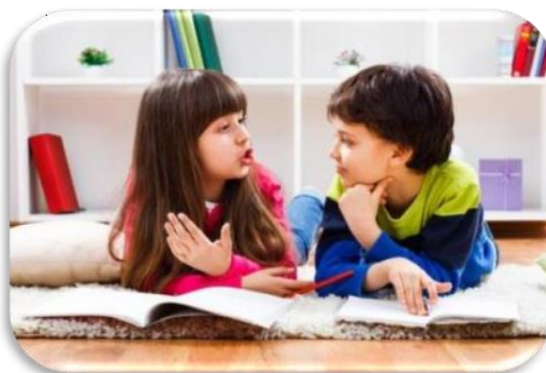
Slika 15 Razvoj komunikacije

Glavne razvojne zadaće učenja stranog jezika su komunikacijske zadaće. Djecu treba usmjeriti na pažljivo slušanje drugih i sudjelovanje. Upotrebljava se monolog i dijalog, potiče se razvoj grafomotorike. Za dobro poznavanje stranog jezika treba imati razvite jezične vještine i slušnu percepciju. (Vrtarić Jakoplić i dr., 2011a, 7-9).