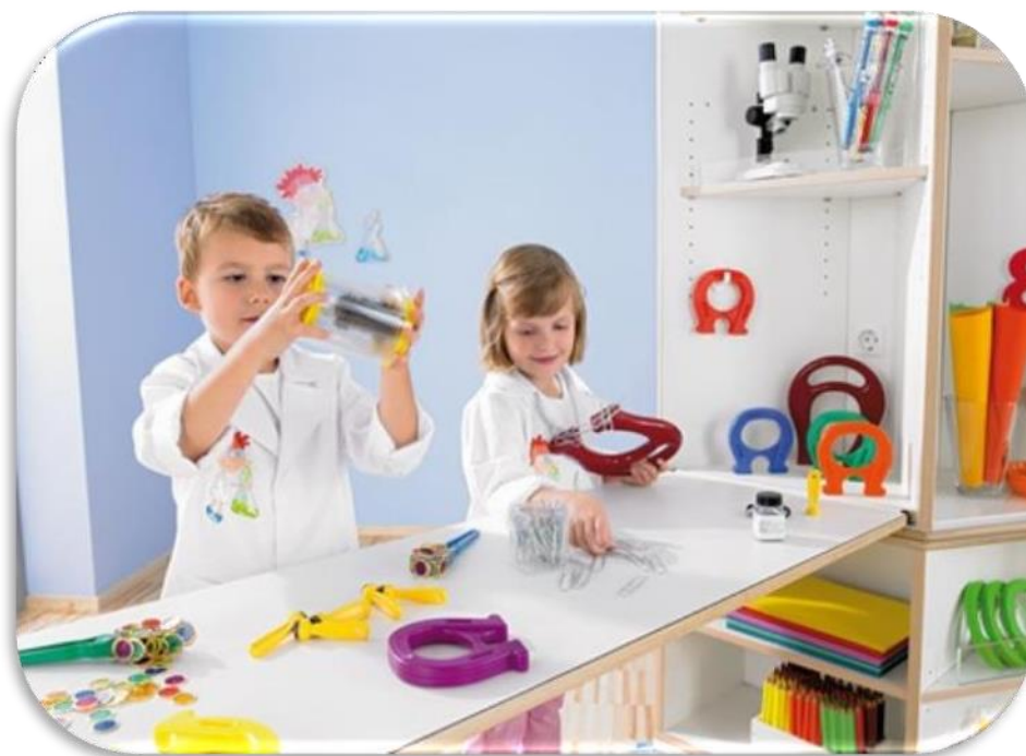
Slika 11 Istraživačka igra

Igra se karakterizira kao pristup akciji, a ne sama po sebi kao aktivnost (prema Bruner in Moyles, 1989). To je izvor zone razvoja u kojoj djeca djeluju sami (Vygotsky 1978, 74). Vygotsky također opisuje pravu igru kao iznimno dramatičnu i fantazijsku, dijeli ju na tri komponente: stvaranje imaginarne situacije, uzimanje i izvršavanje uloga, skup pravila određenih određenim ulogama. Igra je fenomen koji je teško definirati, ali je neupitno da djeca kroz nju najbolje uče. U praksi se spajaju dječji interesi i vođenje odraslih u igri. Djeca eksperimentiraju, rade greške, razmatraju izbor te sami odlučuju, a u svom tom istraživanju zadržavaju koncentraciju i uče.