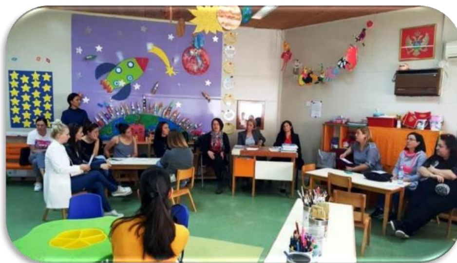
Slika 7 Suradnja s roditeljima

Od odgojitelja se očekuje otvoreni um i spremnost prihvaćanja kritika te prilagođavanje rada na temelju novih saznanja i informacija što pridonosi kvalitetnijem razvoju prakse. Potrebno je uspostaviti stručnu didaktičko-metodičku i pedagoško-psihološku suradnju s ostalim dječjim vrtićima s ciljem razmjene iskustava i proširivanja stručne kompetencije. Odgojitelj mora biti spreman na prihvaćanje suvremenih intencija i ideja, refleksijom otkriti jake i slabe strane odgojno-obrazovne prakse i vlastitog rada te donositi strategije za podizanje kvalitete rada. Važna je i suradnja s roditeljima koja se ostvaruje na sljedeće načine: inicijalni roditeljski sastanci s ciljem upoznavanja programa ranog učenja engleskog jezika; informativni i komunikacijski roditeljski sastanci, individualni razgovori, svakodnevna komunikacija, pisanim oblikom u centru za roditelje, boravak i sudjelovanje roditelja u skupini, zajednička druženja, radionice, zapisi fotografijom i videozapisi, ankete, prezentacije napredovanja tijekom svečanosti (Vrtarić Jakoplić i dr., 2011a, 19).