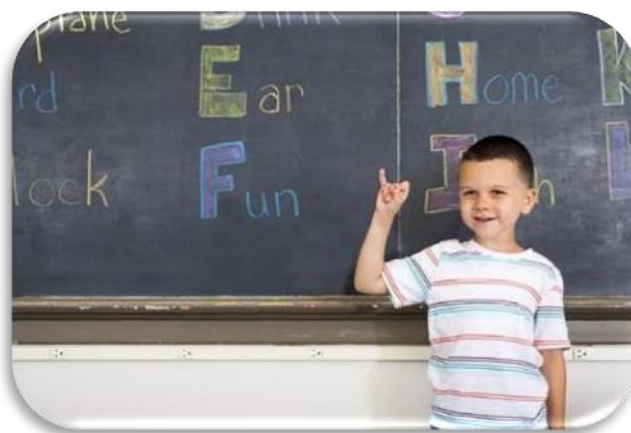
Slika 3 Učenje stranog jezika

Djeca uče te se socijaliziraju kroz igru. Dakle, osim učenja kroz interakciju o elementima iz svakodnevnog života kroz strani jezik, djeca uče kroz svakidašnje aktivnosti i poticaje u vrtiću. Najprije kroz osluškivanje, imitaciju izgovora te razumijevanje zasebnih riječi iz svakodnevnice. U ranim stadijima učenja stranog jezika, odličan način za učenje je povezivanjem sa pjesmom i pjevanjem, pokretom ili pričom. Takva aktivnost ostavlja utisak na dijete, ono reagira srećom, a poznato je da emocijama pamtimo. Ponavljanjem riječi pjesme, ne samo da djeca uče riječi već i pravilan izgovor.