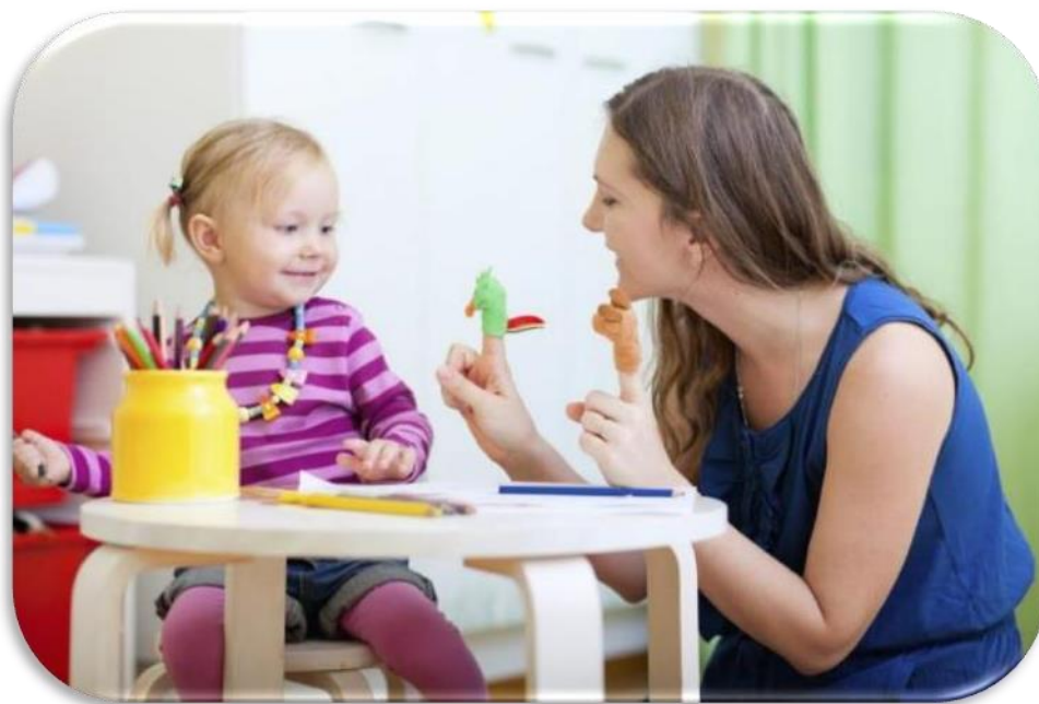
Slika 1 Učenje kroz igru; Interakcija s lutkama

Lurija (2000, prema Silić, 2007) definira jezik kao „...složen sustav znakova koji je nastajao tijekom povijesti društva. On omogućuje izgrađivanje svijesti, formiranje apstraktnog mišljenja i nadilaženje okvira neposredna osjetilnog odražavanja stvarnosti te na taj način prenošenje znanja novim generacijama.“ (Silić, 2007b, 17). Govor se razvija od samog rođenja, a neki tvrde još od prenatalne dobi, u interakciji s majkom, odnosno djeci bliskim osobama. Da bi se govor razvio, potrebno je svakodnevno posvećivanje određenog vremena i pozornosti, i to u svakodnevnim, djeci bliskim situacijama. Stoga niz autora (Ivić, 1996, Miljak, 1987, 1978, Pavličević, 2001, 2005, Suzuki, 1981, Widdowson, 1978, Wood, 1995) ističe na koji se način prirodno uči materinski jezik: komunicirajući u funkciji sporazumijevanja u svakodnevnim životnim situacijama. Slično tomu dijete može učiti i svaki drugi odnosno strani jezik/ jezike. J. Riley (2003) ističe kako djeca koja rano započnu s učenjem stranih jezika prolaze ubrzane stupnjeve slične onima učenju materinskoga jezika (Silić A., 2007b, 68). Dijete počinje učiti kad se rodi, a zatim se razvija i uči svakodnevno.