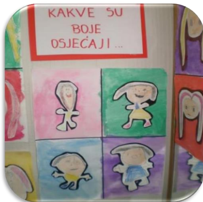
Slika 13 Poticaji i aktivnosti; Ekspresija emocija

Tijekom igre, kod djece se razvijaju različiti procesi u emocionalnom, kognitivnom i interpersonalnom smislu. U kognitivnom je to organizacija, divergentno mišljenje, simbolizam, fantazije. Kod emocionalnih procesa dolazi do ekspresije emocija, ekspresija emocionalnih sadržaja, uživanje u igri, regulacija emocija, interakcija emocija u kognitivni kontekst. Interpersonalni procesi su empatija, stvaranje reprezentacije odnosa „ja“ i komunikacija. Rješavanje problema i konfliktnih situacija potiče na istraživanje problema i konflikata. Jay Griffiths (2013, 173) tvrdi da „Djeca uče ono što im je potrebno kako bi preživjele u kulturi u kojoj su rođeni, I oni što uče - ili ne uspiju naučiti - vjerno je odraz širih kulturnih vrijednosti.“