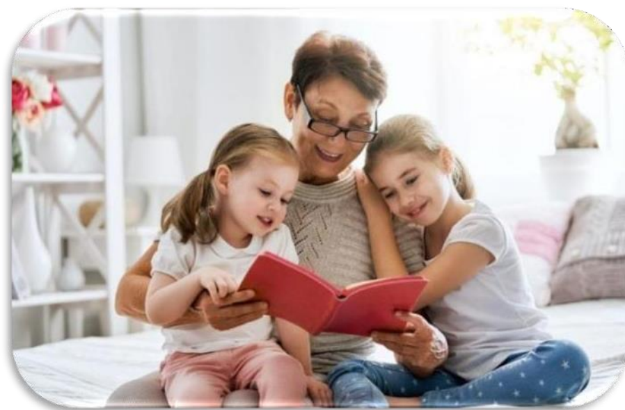
Slika 4 Pristup čitanja

Pristup čitanja (engl. The Reading Approach) funkcioniра na način da se podučava samo ona gramatika korisna za razumijevanje čitanja. Učenik ne mora biti odličan u gramatici, ali ju treba prepoznati (Nagy, 2019, 122).