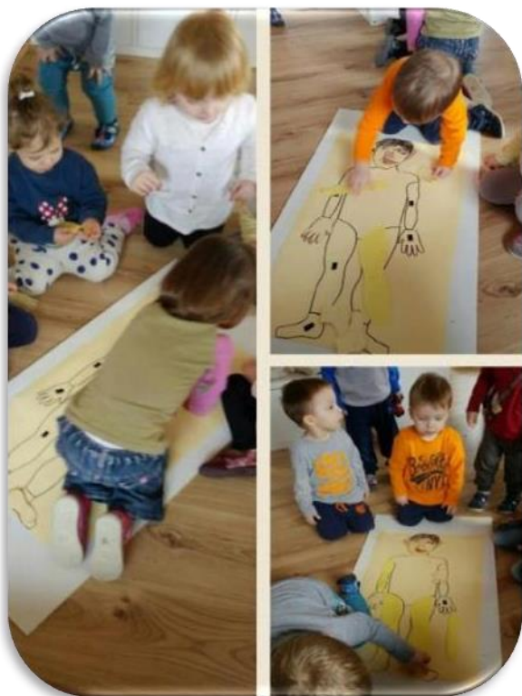
Slika 9 "To sam ja" - engl. My body

Da bi odgojitelji pratili razvoj djeteta i njegovo učenje potrebna je dokumentacija za planiranje aktivnosti i poticaja, te različiti osvrti, valorizacije prema kojima se onda planira daljnji rad s djecom. Tu je važna i suradnja odgojitelj-vrtić-roditelj. Tu je orijentacijski plan i program odgojno-obrazovnog rada, tjedni plan i program odgojno-obrazovnog rada, dnevnik rada, plan zajedničkih aktivnosti djece i odraslih, zapisnici roditeljskih sastanaka, zabilješke i napomene, zapažanja i valorizacija rada, imenik djece te individualni dosje djeteta (Vrtarić Jakoplić i dr., 2011a, 20).