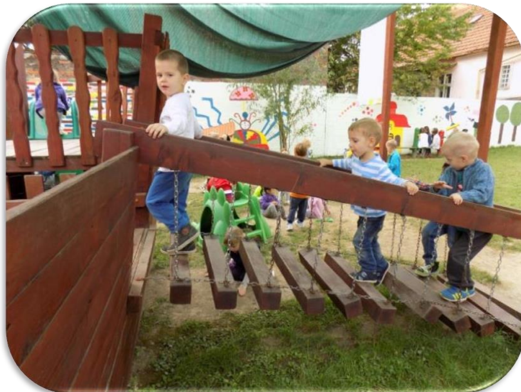
Slika 14 Razvoj koordinacije

Pod tjelesni i psihomotorni razvoj spada poticanje razvoja fine i grube motorike. Prije svega, ključno je zadovoljiti dječje potrebe, pa tako i potrebu za pokretom, prirodnim oblicima kretanja i boravka na zraku. Cilj je povisiti funkcije krvožilnog i dišnog sustava. Potiče se razvoj taktilne i zglobne osjetljivosti koja je također bitna za pisanje i agilnost. Stjecanje dobrih higijenskih i zdravih navika kao preventivna mjera, pa tako i stjecanje navike zdrave prehrane. (Vrtarić Jakoplić i dr., 2011a, 6).