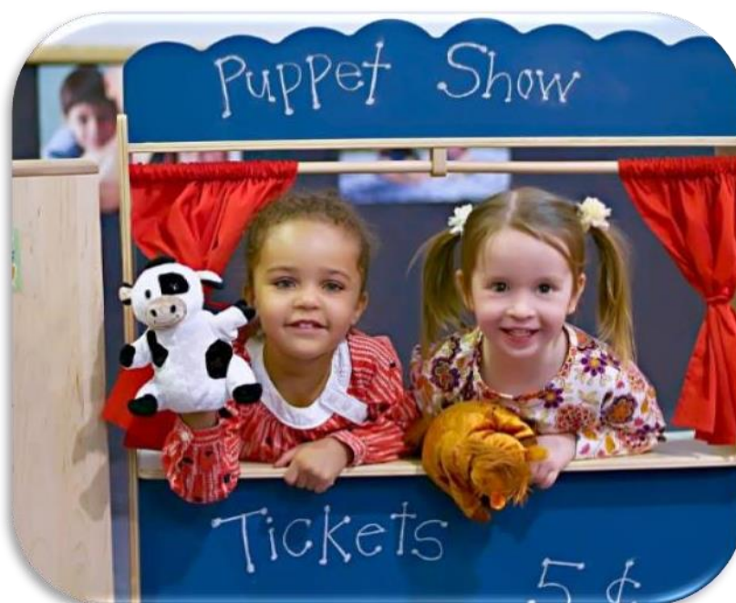
Slika 10 Poticaji i aktivnosti; Lutkarska predstava

Dijete najbolje uči kroz igru „čineći“ u različitim situacijama, kroz različite poticaje, koristeći pritom zaključivanje. Mnogi stručnjaci pokušavaju definirati igru, što je još uvijek vrlo teško. Michel Eyquem de Montaigne (Psihologija dječje igre, 2017, 52) tvrdi da „Dječje igre nisu samo igre, nego ih treba smatrati dječjom djelatnošću“, dok Stuart Brown (Psihologija dječje igre, 2017, 5) napominje: „Igra je osnovni biološki nagon, sastavni je dio našeg zdravlja jednako kao i spavanje i prehrana“. Prema Encyclopedia on Early Childhood Development: „Igra se često definira kao aktivnost koja je učinjena radi sebe, karakterizirana namjerama prije nego ciljevima (proces je važniji od bilo koje krajnje točke ili cilja), fleksibilnost (predmeti se stavljaju u nove kombinacije ili se uloge dijele na nove načine) i pozitivan utjecaj (djeca se često smiješe i kažu da uživaju).“ Lindon (2001) kaže „Igra se može definirati kao svaku aktivnost koju dijete bira samo, a posljedica je uživanja i satisfakcije“. To nisu samo dječja posla, „Igra je dječja praksa, slobodno djelovanje koje je izvan običnoga realnog života“ tvrde Rajić i Petrović-Sočo (2015). George Bernard Shaw (Psihologija dječje igre, 2017, 8) poručuje: „Ne prestaješ se igrati zato što stariš, stariš zato što se prestaješ igrati“.