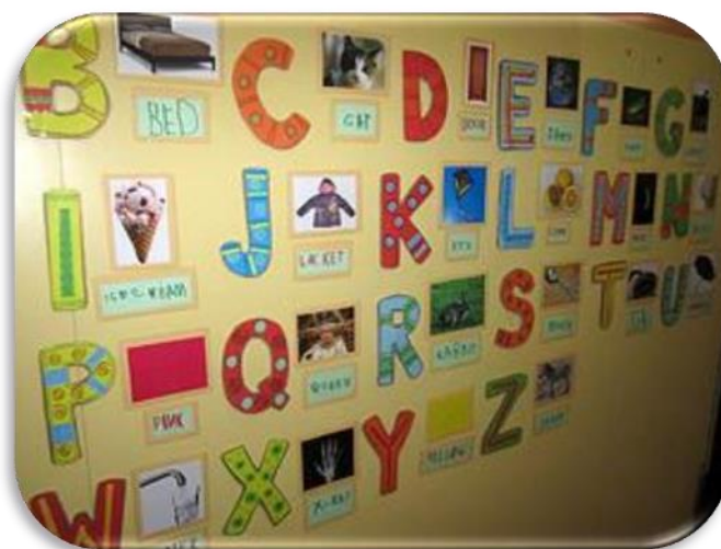
Slika 6 Poticaji i aktivnosti; Abeceda

Osnovni vokabular usvaja se iz dobro poznatih i bliskih tema i sadržaja te elemenata iz svakodnevnice. Strani jezik će se postupno približavati djeci u početnim stadijima, no s vremenom je cilj komunikaciju skoro u potpunosti svesti na engleski jezik. Također, kao i u kraćem programu, upotrebljavaju se lakši gramatički izrazi, sličniji materinjem jeziku. Materijali i metode usvajanja jezika kroz igru su slični kraćem programu: brojalice, pjesme, slikovnice, priče, dramatizacija, plakati, didaktičke igre...(Vrtarić Jakoplić i dr., 2011a, 10).