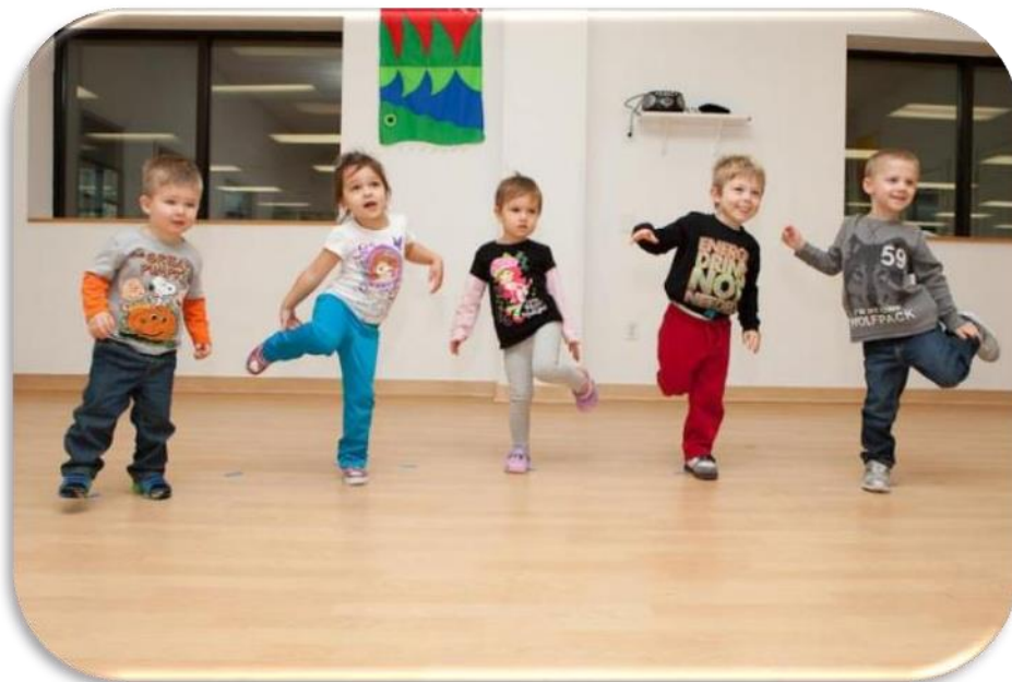
Slika 5 Metoda učenja pokretom