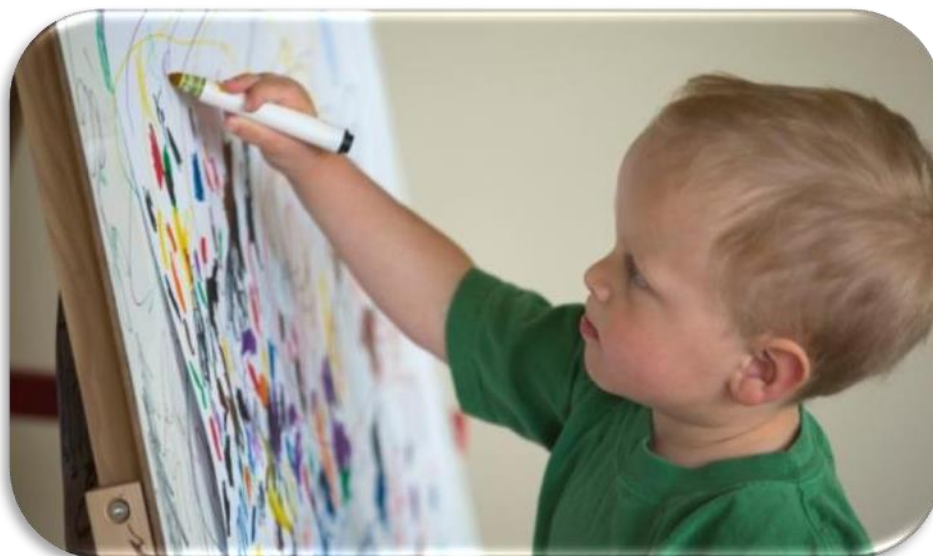
Slika 2 Učenje kroz igru; Kreativnost

Budući da su u ranoj fazi društvenog razvoja, oni su manje samosvjesni nego stariji učenici tako da je veća vjerojatnost da će jezik češće i više koristiti samopouzdanom, prvo oponašanjem i ponavljanjem, a kasnije nadogradnjom na postojeće znanja i preuređivanje, kreativno koristeći jezik. Djeca u predškolskoj dobi imaju prirodnu "žed za znanjem", oni su željni, spontani, znatiželjni, radoznali, oni uče postavljajući pitanja, a uporni su - sve je to velika predispozicija za učenje jezika (prema European Centre for Modern Languages of the Council of Europe, 2019). Aktivnosti učenja jezika trebaju se prilagoditi dobi učenika i postaviti u kontekst. Djeca bi trebala biti izložena smislenom jeziku i ako je moguće u autentičnom okruženju, na način da se jezik spontano stekne, a ne svjesno nauči (Mourão, 2015a, 56).