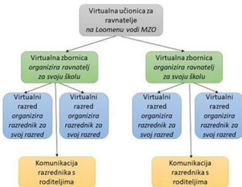
Slika 8 Prikaz strukture virtualnih učionica (Škola za život, 2020).

Sljedeća ilustracija prikazuje strukturu i način funkcioniranja virtualnih učionica, odnosno virtualnih komunikacijskih kanala i razreda: