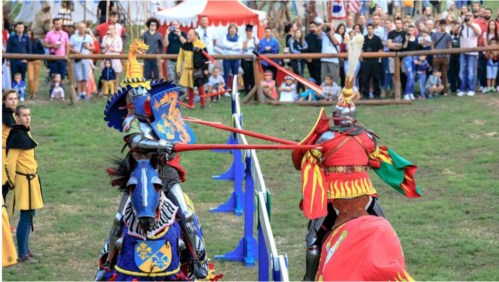
Slika 3. Renesansni festival