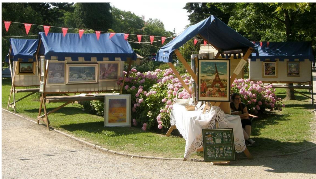
Slika 2. Podravski motivi

U Koprivnici godišnje ima mnogo kulturnih manifestacija, no neke od većih i važnijih su Renesansni festival, Podravski motivi i Galovićeve jeseni. Na početku ljeta svake se godine održavaju Podravski motivi, a tijekom te manifestacije centar grada pretvara se u sajam naivne umjetnosti, folklor, antikviteta te starih i zaboravljenih obrta. Tijekom te manifestacije umjetnici i obrtnici prezentiraju svoje vještine u gradskom parku, tako da prolaznici imaju priliku iz prve ruke doživjeti stare obrte i nastajanje naivne umjetnosti jedinstvene za podravski kraj. Početkom jeseni u gradu se održava najveća književna manifestacija sjeverne Hrvatske, Galovićeve jeseni. Glavna namjera te manifestacije je očuvanje djela Frana Galovića te dodjela nagrade za najbolje književno djelo zavičajne tematike. Postoje dvije vrste Nagrade Fran Galović; jedna je namijenjena umjetnicima i piscima odrasle dobi, dok je druga nazvana Mali Galović te je namijenjena učenicima osnovnih i srednjih škola. U sklopu manifestacije održavaju se mnogi književno orijentirani događaji poput stručnih kolokvija, izložbi, javnih čitanja i predstavljanja knjiga. Na samom kraju preostao je još Renesansni festival koji na starim bedemima koprivničke utvrde prikazuje srednjovjekovni život. Na festivalu ima mnoštvo scenskih prikaza opsade, glazbe, vitezova, plesa i lakrdijaštva. Polaznici također imaju priliku isprobati neka jela koja su bila karakteristična za vrijeme srednjeg vijeka (Ernečić i sur., 2019).