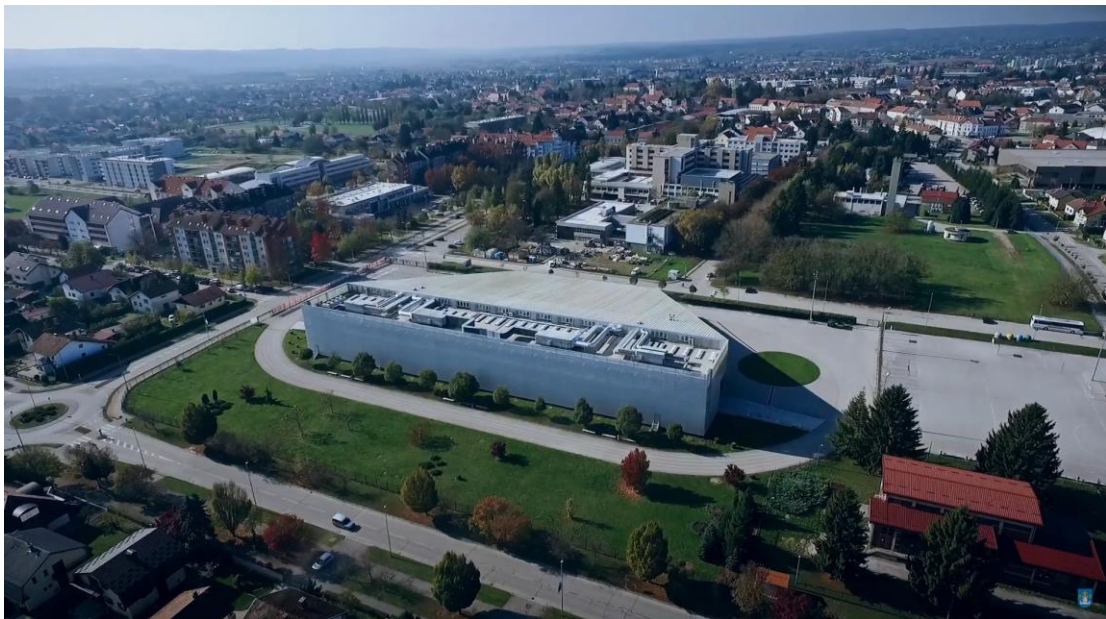
Slika 1. Koprivnica iz zraka

Grad Koprivnica geografski je smješten u sjeverozapadnom dijelu Hrvatske i to u samo srce Podravine. Koprivnica se nalazi u Koprivničko-križevačkoj županiji te spada u veće hrvatske gradove, a prema popisu stanovništva iz 2011. godine ( https://www.dzs.hr/ ) (23. 12. 2020.) broji 30.854 stanovnika na prostoru od 90,42 km 2 . U sam grad spada i osam prigradskih naselja, a to su Bakovčice, Draganovec, Starigrad, Jagnjedovec, Kunovec Breg, Štaglinec, Reka i Herešin. Ako se uspoređuje stanovništvo samog grada u popisima 2001. i 2011. godine, vidljivo je da je grad izgubio oko 1000 stanovnika, što i nije tako velik broj ako se uzmu u obzir ekonomska kriza i neprilike koje su pogodile Hrvatsku.