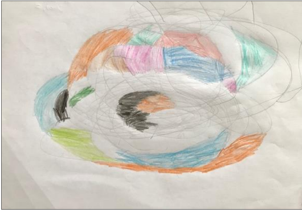
Slika 6: Jakov –fraktalni crtež

Komentari djeteta: "Tu ima sto krugova, ali su svi mali. Kao da se vrte."