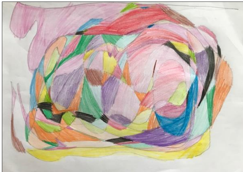
Slika 5: Manuela – fraktalni crtež

Komentari djeteta: "Jedan dan na moru su bili jako veliki valovi, kao ove zavijene crte skakali su prema meni."