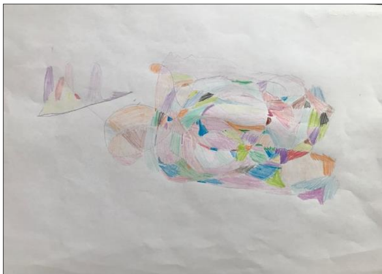
Slika 4: Marta – fraktalni crtež