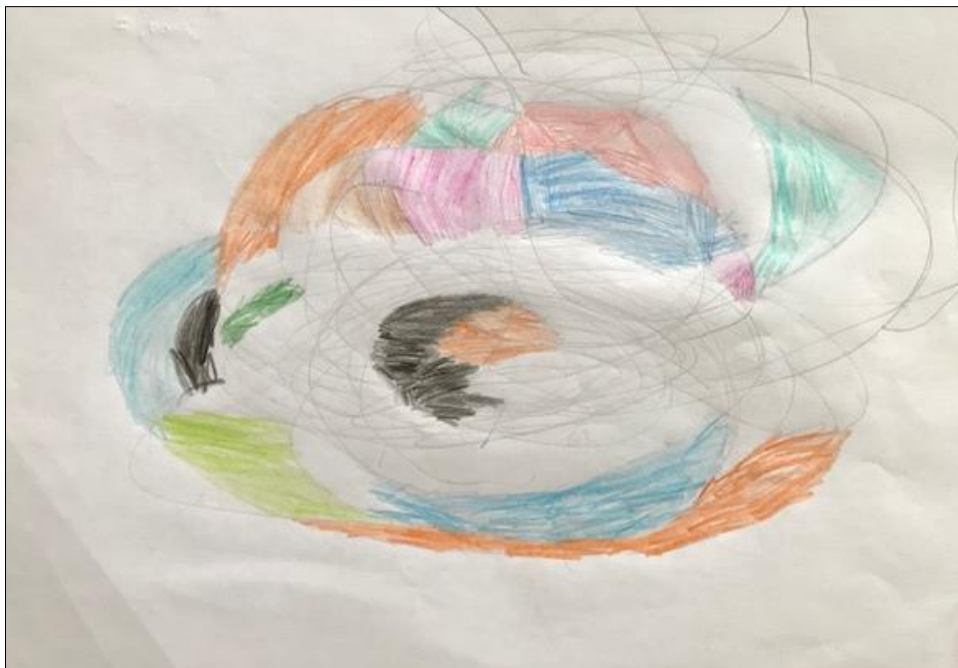
Slika 6: Jakov –fraktalni crtež

Komentari djeteta: "Tu ima sto krugova, ali su svi mali. Kao da se vrte."