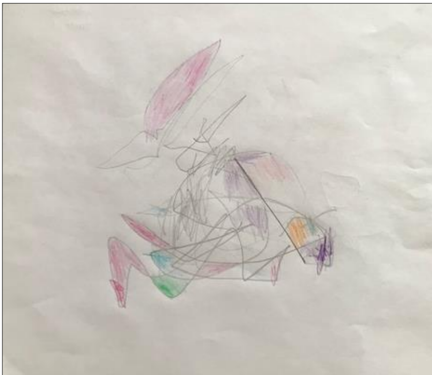
Slika 7: Toma – fraktalni crtež

Dječji opis crteža: "Ovo je robot. Ima šareni kaput."