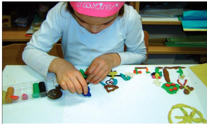
Slika 1: Dijete se koncentrira

(Balić Šimrak, (2010/2011), Predškolsko dijete i likovna umjetnost: Dijete, vrtić, obitelj , str.7.)