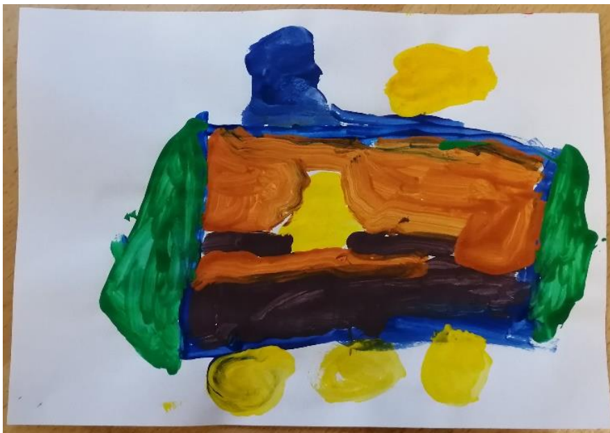
Slika br.5: L.S.