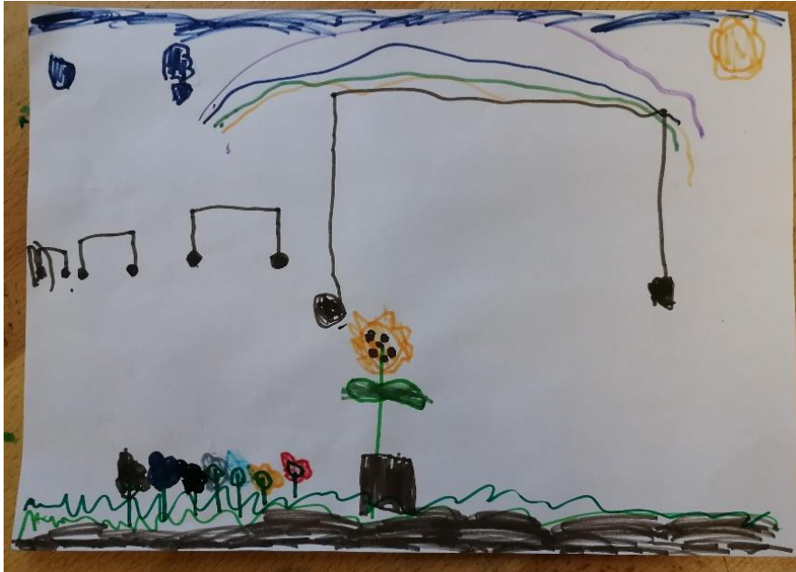
Slika br.4: B.R.

Analiza: priloženi rad naslikao je dječak B.R. Na pitanje što si naslikao odgovorio je: „naslikao sam raznu vrsta cvijeća koja je pod dugom“. Pri slikanju koristio je 3 hladne boje, crnu boju i 2 tople boje stoga hipoteza H-1 nije potvrđena. Dječak je prepoznao glavni motiv skladbe stoga hipoteza H-2 nije potvrđena.