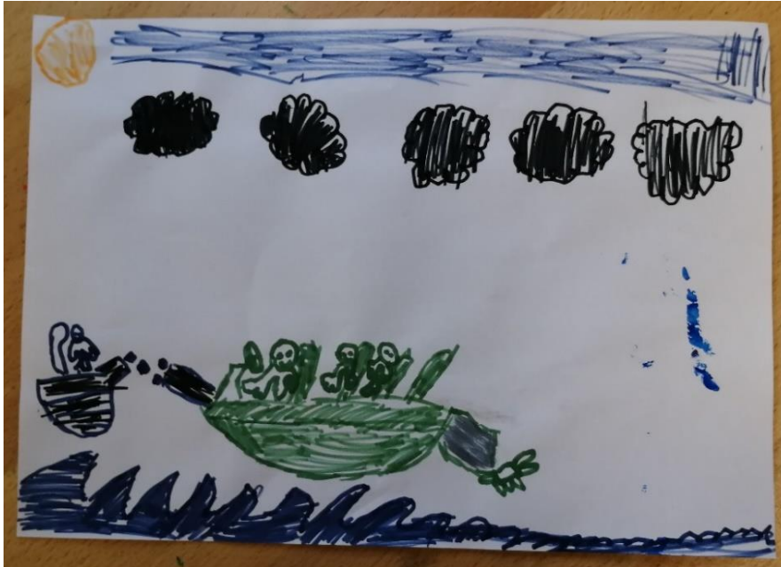
Slika br.10: M.B.

Analiza: priloženi rad naslikao je dječak M.B. Na pitanje što si to naslikao dječak je odgovorio: „to je rat na vodi“. Pri slikanju koristio je 2 hladne boje, crnu boju i 1 toplu boju stoga je hipoteza H-1 potvrđena. Dječak nije prepoznao glavni motiv skladbe stoga je hipoteza H-2 potvrđena.