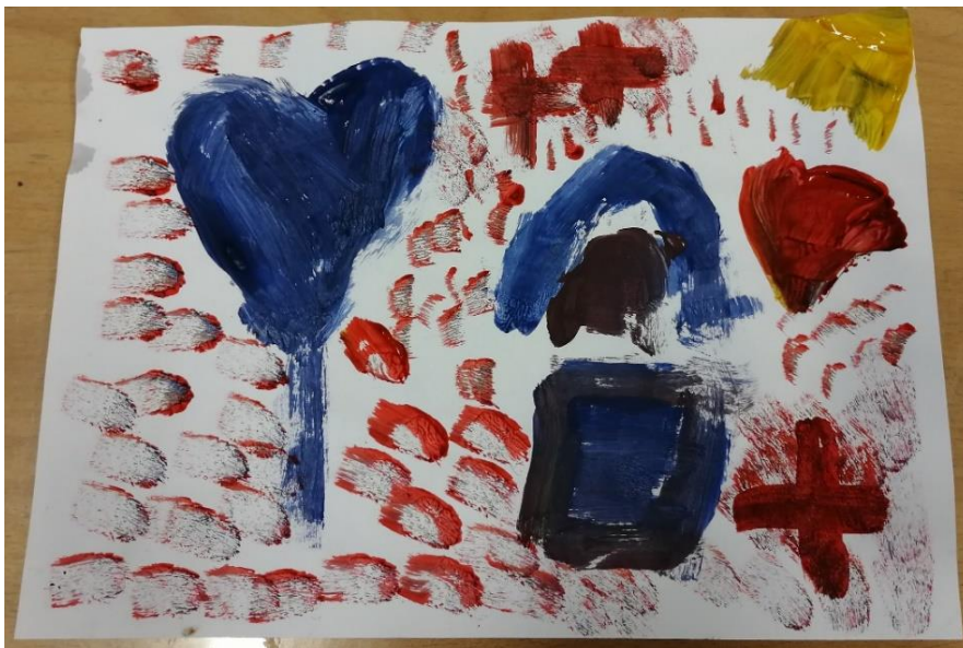
Slika br.20: L.G.

Analiza: priloženi rad naslikala je djevojčica L.G. Na pitanje što si naslikala odgovorila je: „to je srčeko kao balon koji leti u nebo“. Pri slikanju je koristila 2 tople boje i 1 hladnu boju stoga