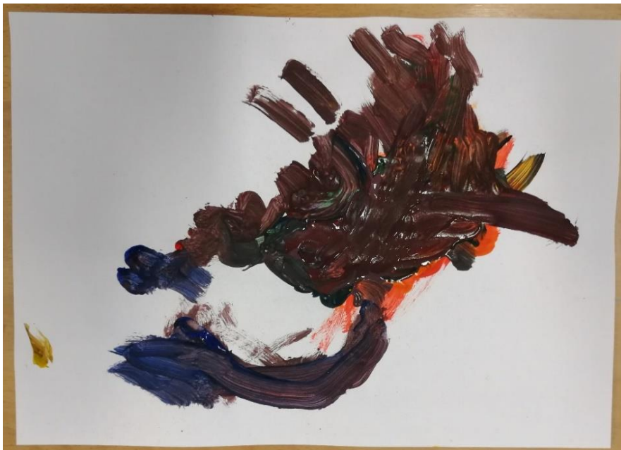
Slika br.23: N.H.