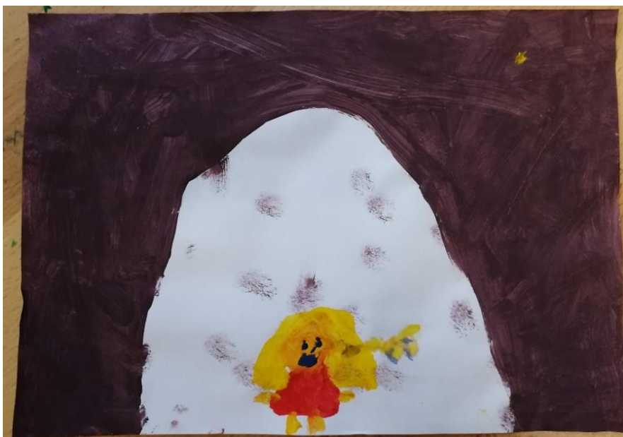
Slika br.7: Z.Č.

Analiza: priloženi rad naslikala je djevojčica Z.Č. Na pitanje što si naslikala odgovorila je: „to je curica u špilji i skladba me podsjeća na djevojčicu koja proizvodi jeku“. Pri slikanju koristila je 1 hladnu boju i 2 tople boje no prevladava hladna boja stoga je hipoteza H-1 potvrđena. Djevojčica nije prepoznala glavni motiv skladbe stoga je hipoteza H-2 također potvrđena.