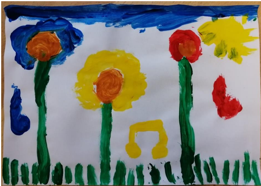
Slika br.2: S.Š