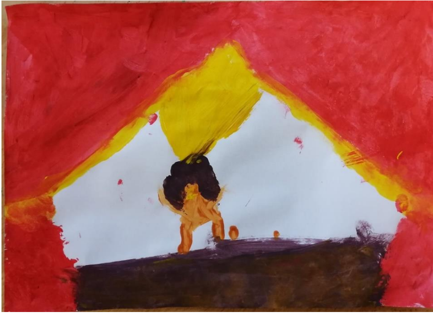
Slika br.1: Z.Č.

Analiza: priloženi rad naslikala je djevojčica Z.Č. Na pitanje što si to naslikala odgovorila je : „to sam ja u kazalištu“. Koristila je 3 tople boje i 1 hladnu boju. Na slici prevladava crvena, topla boja stoga je hipoteza H-1 potvrđena. Djevojčica nije prepoznala glavni motiv skladbe stoga je hipoteza H-2 također potvrđena.