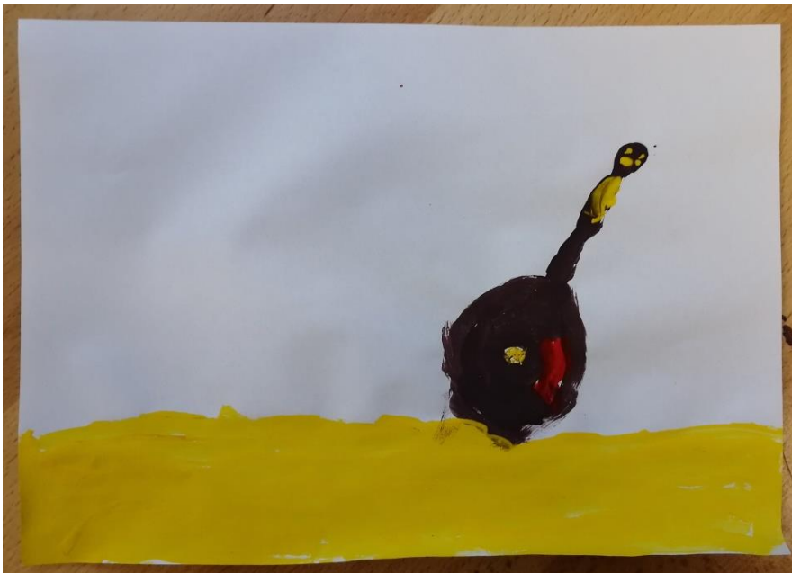
Slika br.6: J.M.

Analiza: priloženi rad naslikao je dječak J.M. Na pitanje što si naslikao odgovorio je: „tamburicu“. Pri slikanju koristio je 2 tople boje i 1 hladnu boju stoga je hipoteza H-1 potvrđena. Dječak nije prepoznao glavni motiv skladbe stoga je hipoteza H-2 također potvrđena.