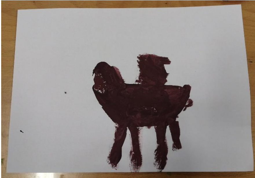
Slika br.19: E.L.

Analiza: priloženi rad naslikala je djevojčica E.L. Na pitanje što si naslikala odgovorila je: „konja koji nosi kuću“. Pri slikanju koristila je 1 hladnu boju stoga je hipoteza H-1 potvrđena. Djevojčica nije prepoznala glavni motiv skladbe stoga je hipoteza H-2 također potvrđena.