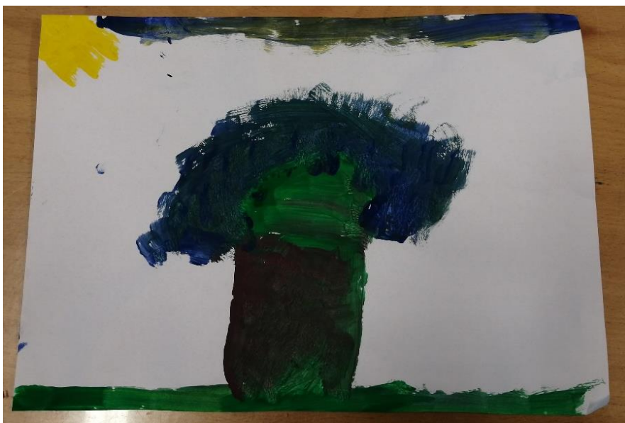
Slika br.16: L.G.

Analiza: priloženi rad naslikala je djevojčica L.G. Na pitanje što si naslikala odgovorila je: „to je drveće iz kojeg rastu jako veliki cvjetovi“. Pri slikanju koristila je 2 hladne boje i 1 toplu boju stoga hipoteza H-1 nije potvrđena. Djevojčica je prepoznala glavni motiv skladbe stoga hipoteza H-2 također nije potvrđena.