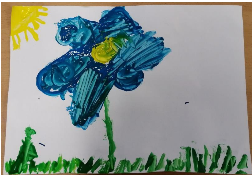
Slika br.13: E.P

Analiza: priloženi rad naslikao je dječak E.P. Na pitanje što si naslikao odgovorio je: „potočnicu“. Pri slikanju koristio je 2 hladne boje i 1 toplu boju stoga hipoteza H-1 nije potvrđena. Dječak je prepoznao glavni motiv skladbe stoga hipoteza H-2 nije potvrđena.