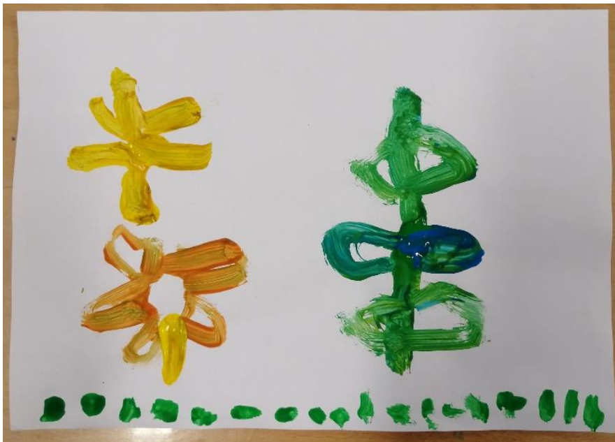
Slika br.15: I.P.

Analiza: priloženi rad naslikao je I.P. Na pitanje što si naslikao odgovorio je: „travu, sunce, cvijet i drvo“. Pri slikanju koristio je 2 tople boje i 2 hladne boje no prevladava hladna boja stoga hipoteza H-1 nije potvrđena. Dječak je prepoznao glavni motiv skladbe stoga hipoteza H-2 nije potvrđena.