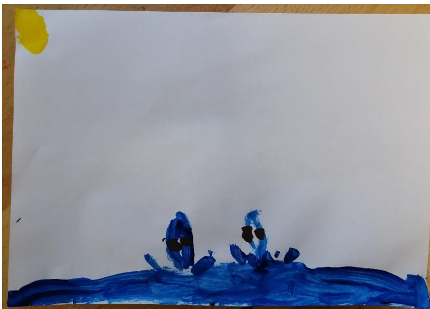
Slika br.11: M.G.

Analiza: priloženi rad naslikao je dječak M.G. Na pitanje što si naslikao odgovorio je: „naslikao sam ribe koje skaču iz mora“. Pri slikanju koristio je 2 hladne boje i 1 toplu boju stoga je