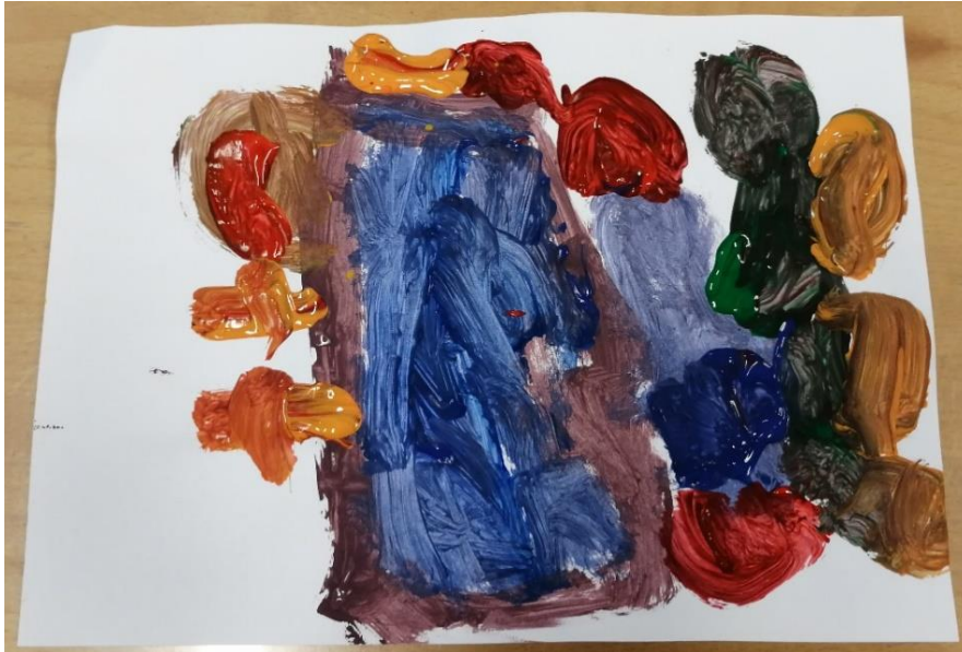
Slika br.21: F.Č

Analiza: priloženi rad naslikao je dječak F.Č. Na pitanje što si naslikao odgovorio je: „bubanj i štapići“. Pri slikanju koristio je 3 hladne boje i 2 tople boje stoga je hipoteza H-1 potvrđena. Dječak nije prepoznao glavni motiv skladbe stoga je hipoteza H-2 također potvrđena.