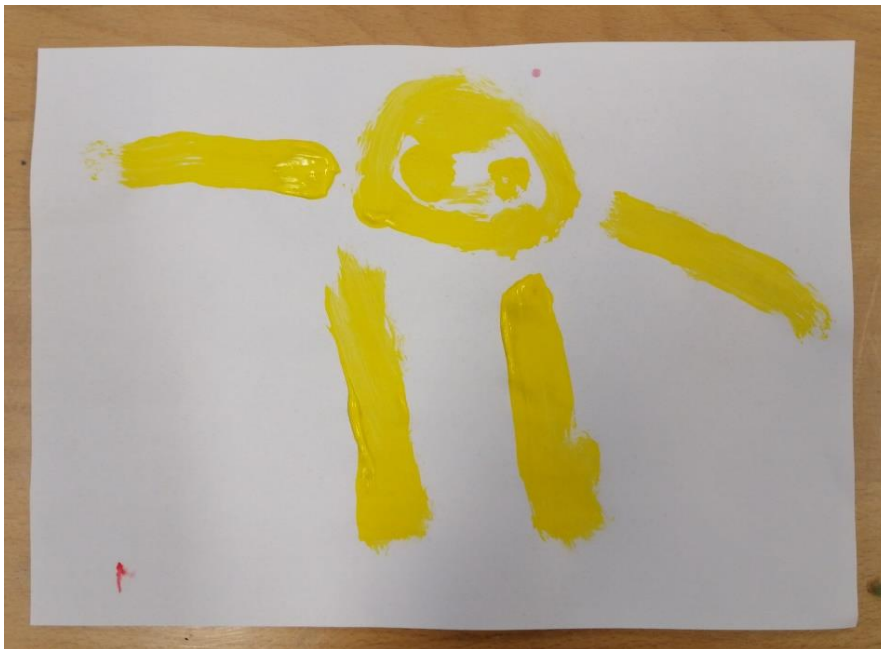
Slika br.18: A.P.

Analiza: priloženi rad naslikao je dječak A.P. Na pitanje što si naslikao odgovorio je: „naslikao sam tatu“. Pri slikanju koristio je 1 toplu boju stoga je hipoteza H-1 potvrđena. Dječak nije prepoznao glavni motiv skladbe stoga je hipoteza H-2 također potvrđena.