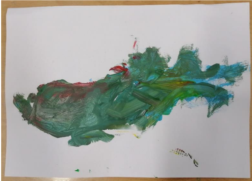
Slika br.22: A.K.

Analiza: priloženi rad naslikao je dječak A.K. Na pitanje što si naslikao odgovorio je: „naslikao sam morskog psa“. Pri slikanju koristio je 2 hladne boje i 1 toplu boju stoga je hipoteza H-1 potvrđena. Dječak nije prepoznao glavni motiv skladbe stoga je hipoteza H-2 također potvrđena.