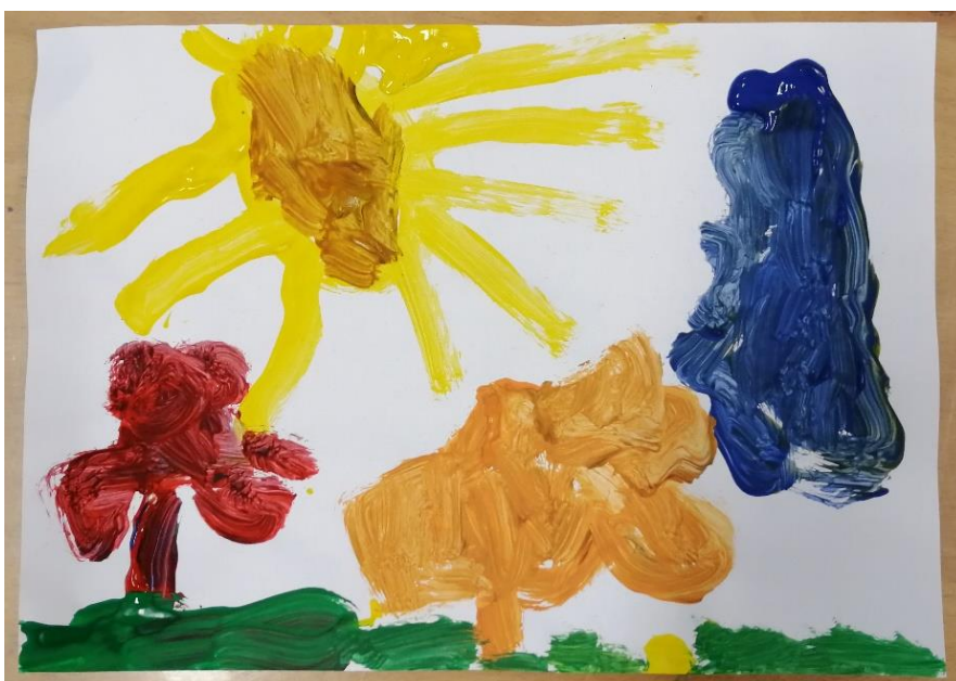
Slika br.17: L.R.