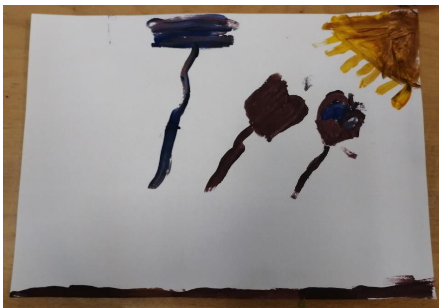
Slika br.24: N.B.

Analiza: priloženi rad naslikala je djevojčica N.B. Na pitanje što si naslikala odgovorila je: „to su baloni koji su nekom ispali iz ruke“. Pri slikanju koristila je 1 hladnu boju i 1 toplu boju no prevladava hladna boja stoga je hipoteza H-1 potvrđena. Djevojčica nije prepoznala glavni motiv skladbe stoga je hipoteza H-2 također potvrđena.