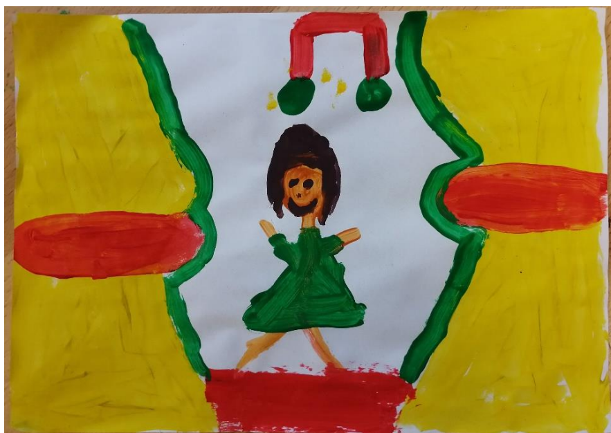
Slika br.3: B.M.

Analiza: priloženi rad naslikala je djevojčica B.M. Na pitanje što si naslikala odgovorila je: „to je cura koja pleše na pozornici“. Pri slikanju koristila je 3 tople boje i dvije hladne boje. Prevladavaju tople boje stoga je hipoteza H-1 potvrđena. Djevojčica nije prepoznala glavni motiv skladbe stoga je hipoteza H-2 također potvrđena.