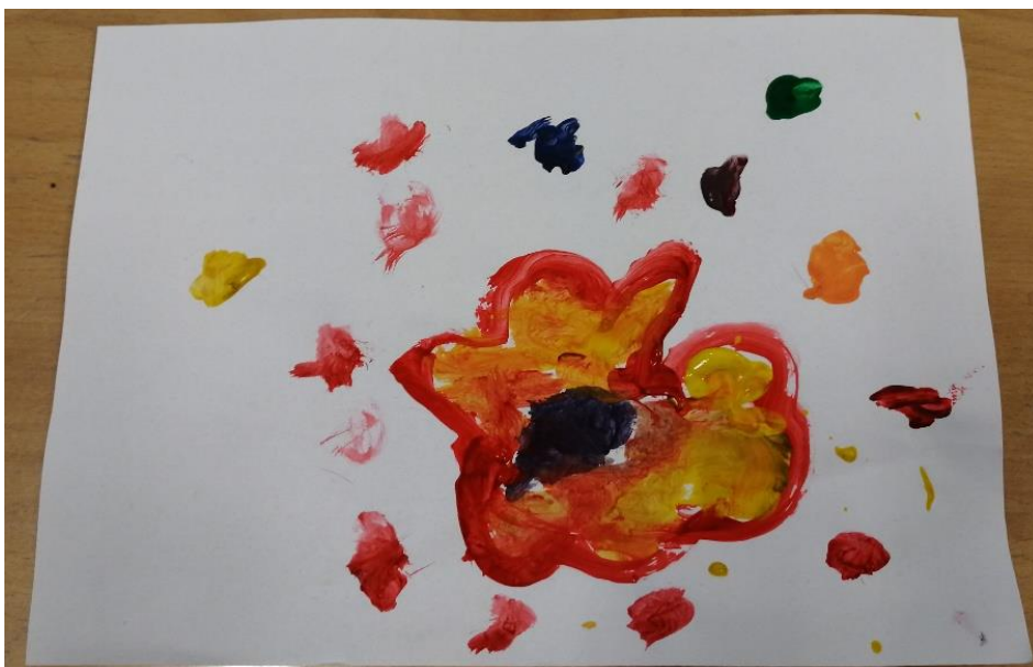
Slika br.14: L.Š.