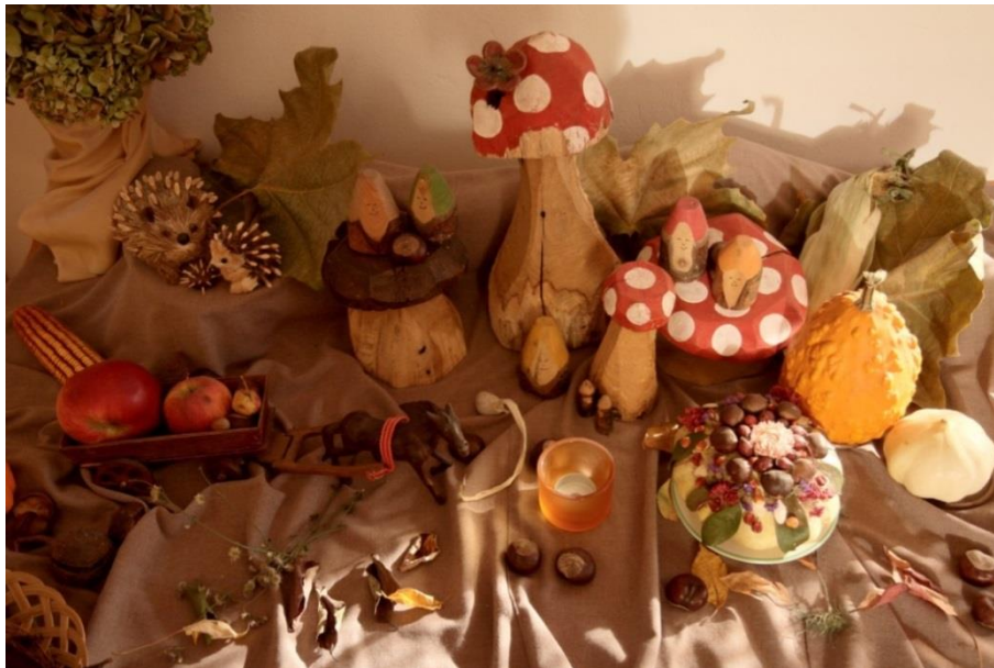
Slika 1. Stol godišnjih doba u jesen

Ujedno, naglasak se stavlja na obilježavanje različitih svetkovina koje su povezane s određenim razdobljem u godini. Na svetkovinu svetog Mihovila, 29. rujna, sve je u duhu teme borbe zmajeva i nadvladavanja mračnih sila svjetlosnim mačem duha. Naime, Sveti Mihovil je svojim zlatnim mačem kojeg su iskovale zvjezdice pobijedio zlog zmaja. Taj čin simbolizira hrabrost i pobjedu nad zlom. Ovakvi sadržaji i aktivnosti su i prilika za razvoj percepcije i učenja kod djece. Kroz aktivnost kovanja željeza u kolu te jahanja na vatrenim konjima djeci se približava sam pojam hrabrosti i njegovo značenje. Sama svetkovina sv. Mihovila obilježava i početak jeseni, odnosno jesenskog ciklusa.