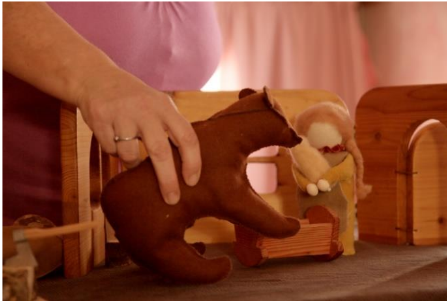
Slika 7. Ručno izrađene igračke bez izraženih detalja na licu

Također, bitno je u vrtiću ne gomilati nepotrebne i monofunkcionalne igračke. Razvoj mašte potiče se i ponudom manjeg broja jednostavnijih igračaka. Primjerice drvena kocka, koja bi u dječjoj mašti mogla postati i telefon, vlak, mobitel i slično. Komad drveta, prirodan je materijal koji djeci daje slobodan prostor da ga vlastitim rukama i maštom oblikuje po svojim željama. Igračke s već određenom funkcijom sprječavaju dječji razvoj jer ne potiču dijete na istraživanje i konstruiranje vlastitih znanja vlastitim rukama i intervencijama. Kada dijete prohoda, životinje postaju glavne igračke koje djeca prihvaćaju kao svoje ljubimce. Već nakon treće godine života u djetetovom okruženju nalaze se pravi alati , poput čekića ili noža, bez opasnosti da će se dijete ozlijediti. Gradnja kuće u toj dobi simbolizira vlastiti dom za tijelo i obitavanje; grade ju pomoću stolova, stolaca, marama i stalaka za igračke (Seitz, Hallwachs, 1996).