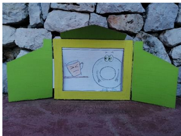
Slika 11. Ilustracija 6.