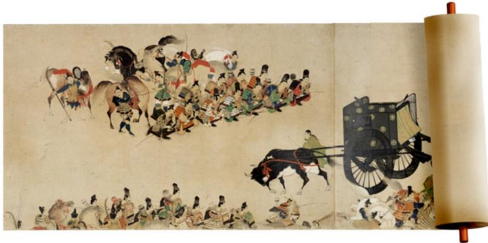
Slika 1. Emaki (ilustrirani svitak)