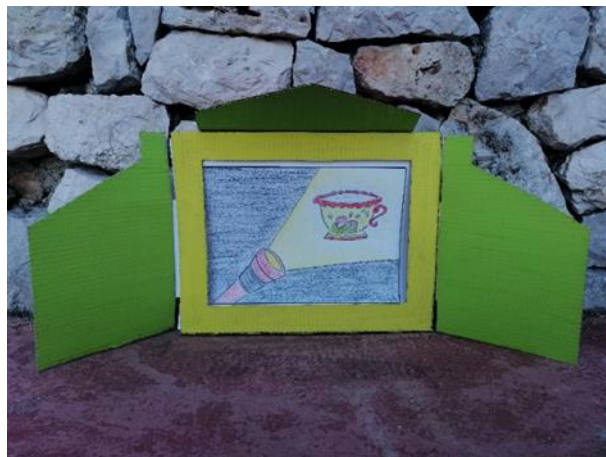
Slika 9. Ilustracija 4.