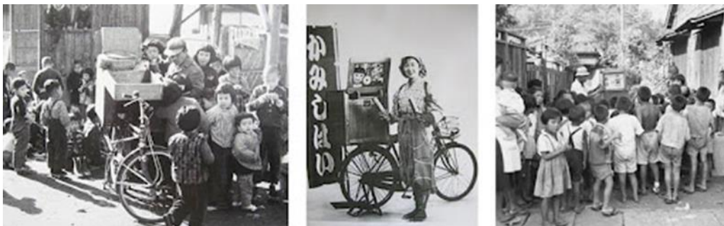
Slika 3. Kamišibaj izvedbe u povijesti

Kamišibaj izvedbe odvijale bi se na ulicama. Pripovjedač bi, na svom biciklu, prevezio drvenu kutiju, odnosno pozornicu. U okviru drvene kutije bila bi umetnuta priča, dok bi odozdo kutija bila napunjena slatkišima koje je pripovjedač, nakon izvedbe, prodavao i tako zarađivao za život. Dolaskom na mjesto izvedbe, pripovjedač bi sišao s bicikla te lupao drvenim štapićima, originalno zvanim hiošigi, i na taj način pozivao djecu da se okupe i saslušaju novu priču. S obzirom na to da ih je u kratkom vremenu bilo sve više, kamišibaj izvođači trebali su se neprestano truditi biti što zanimljiviji kako im konkurencija ne bi oduzela publiku.