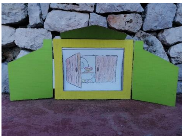
Slika 10. Ilustracija 5.