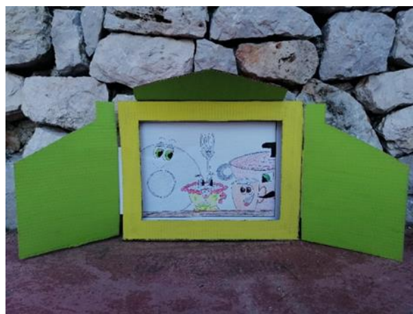
Slika 17. Ilustracija 12.