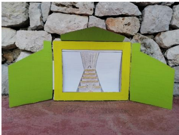
Slika 8. Ilustracija 3.