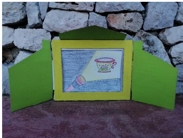
Slika 9. Ilustracija 4.