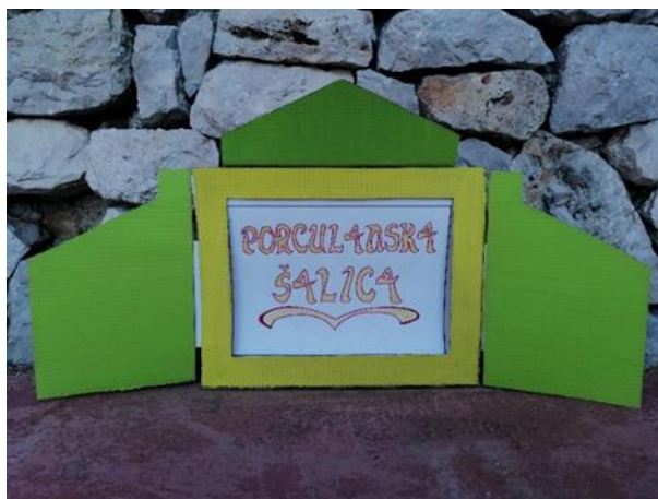
Slika 5. Naslovnica