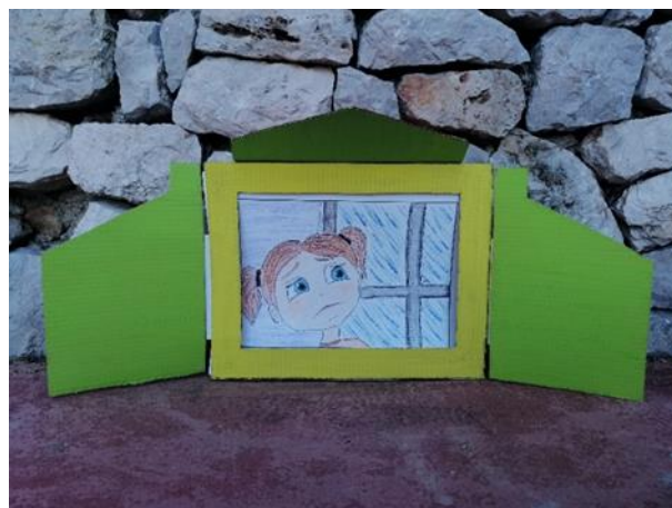
Slika 7. Ilustracija 2. 2