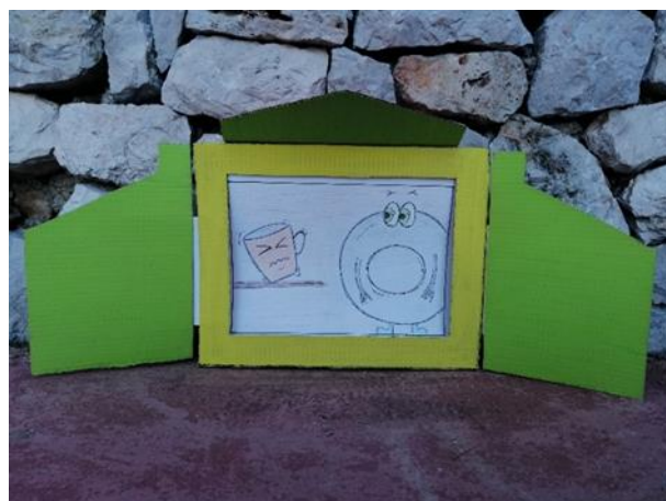
Slika 11. Ilustracija 6.