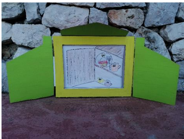
Slika 14. Ilustracija 9.