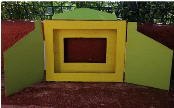
Slika 20. Izrada butaja