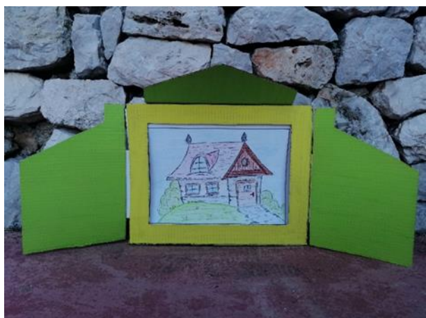
Slika 6. Ilustracija 1.