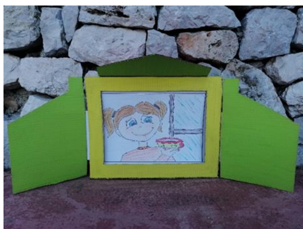
Slika 13. Ilustracija 8.