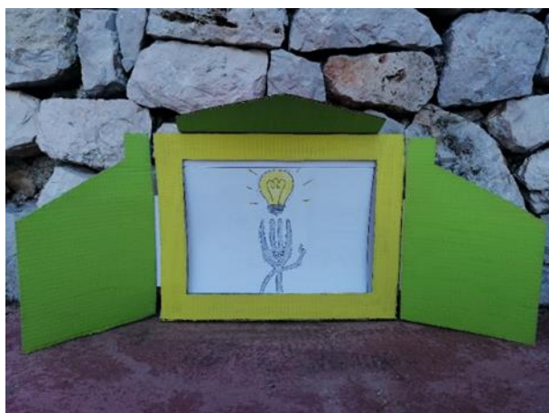
Slika 12. Ilustracija 7.