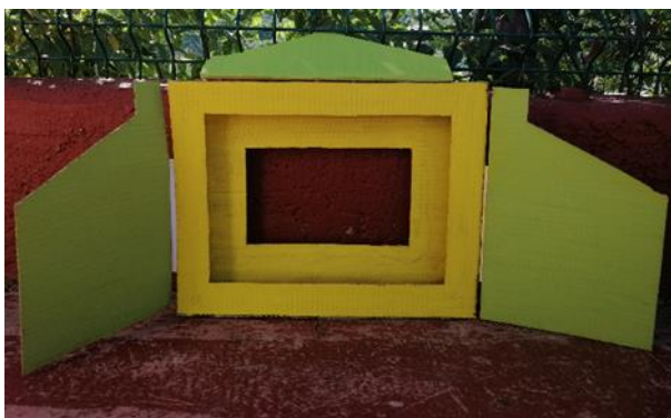
Slika 20. Izrada butaja