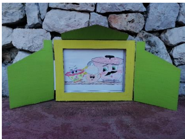
Slika 16. Ilustracija 11.