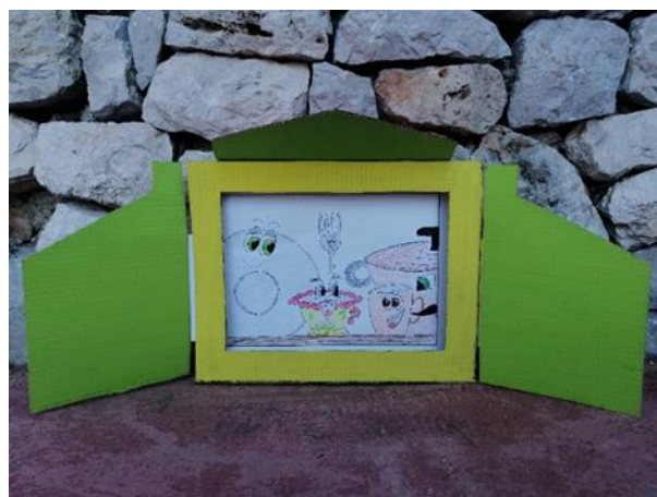
Slika 17. Ilustracija 12.