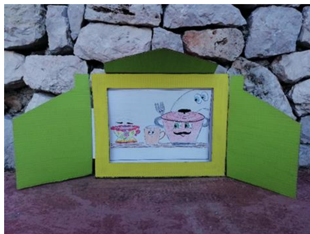
Slika 15. Ilustracija 10.