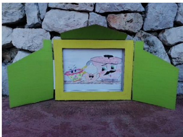
Slika 16. Ilustracija 11.