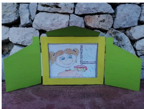
Slika 13. Ilustracija 8.