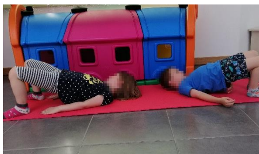
Slika 18. Most