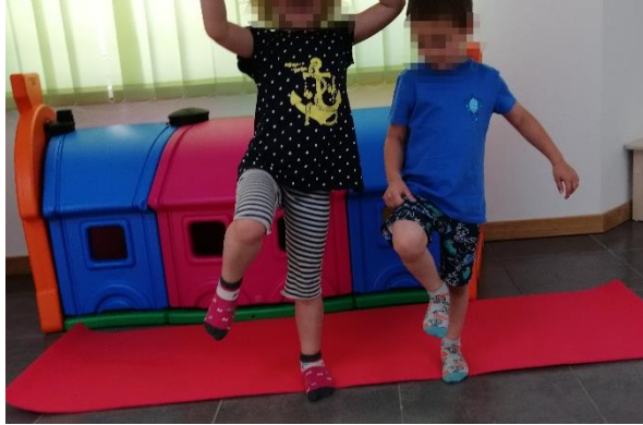
Slika 25. Visoki skip, izvor: vlastiti

Trčanje na mjestu može se provoditi izmjenom načina trčanja, a to može biti niski skip ili visoki skip.