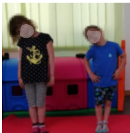
Slika 4. Pomicanje glave u desno