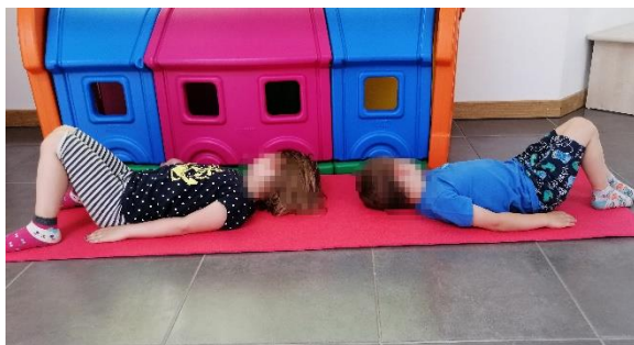
Slika 17. Početni položaj

Početni položaj je ležeći na leđima, noge su savijene u koljenima, a ruke ispružene uz tijelo. Izvodi se podizanje kukova prema gore pri čemu se i donji dio leđa odvajaju od podloge.