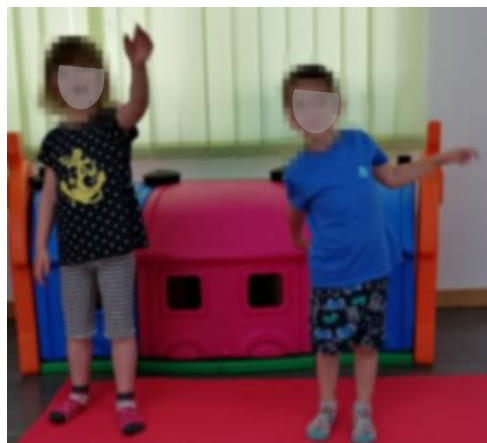
Slika 8. Kružni pokreti lijevom rukom