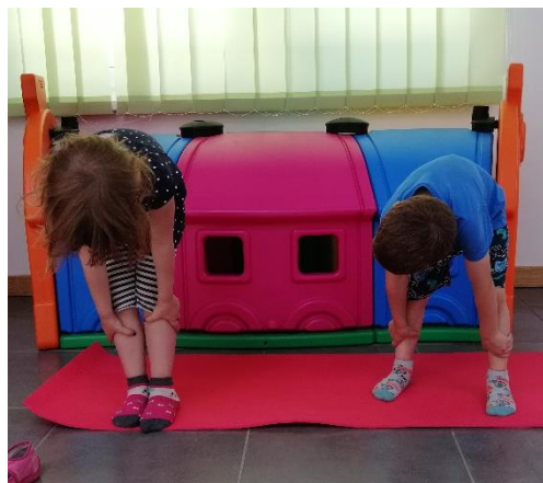
Slika 9. Istezanje trupa i nogu

Početni položaj je stojeći, noge su u raskoraku, a ruke uz tijelo. Izvodi se istezanje trupa prema naprijed, ruke se spuštaju prema stopalima pri čemu se istežu trup i noge.