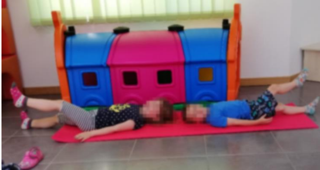
Slika 19. Odizanje noge od podloge

Početni položaj je ležeći na leđima, noge i ruke su ispružene uz tijelo. Izvodi se odizanje jedne noge od podloge, zadržavanje i vraćanje u početni položaj. Isto se ponavlja i s drugom nogom.