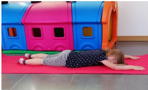
Slika 20. Početni položaj

Početni položaj je ležeći na trbuhu, noge su ispružene, a ruke su ispružene iznad glave. Izvodi se odizanje jedne noge i suprotne ruke od podloge.