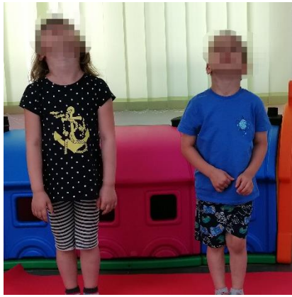
Slika 5. Pomicanje glave prema natrag