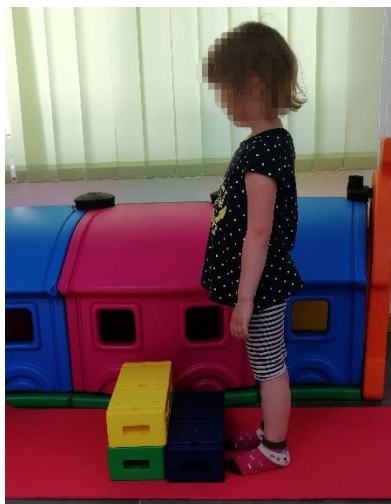
Slika 15. Početni položaj, izvor: vlastiti

Stepenice za dječju dob možemo napraviti od manjih kvadra. Cilj je da se djeca penju uz stepenice i spuštaju natrag na podlogu.