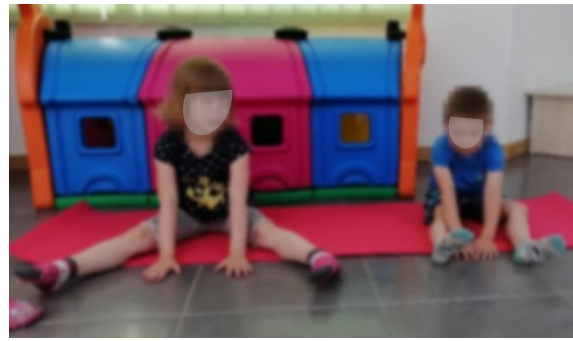
Slika 11. Istezanje trupa i nogu