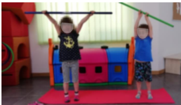
Slika 24. Dizanje utega

Početni položaj je stojeći, dijete u ruci drži „uteg“ koji podiže iznad glave. Uteg može predstavljati običan štap.