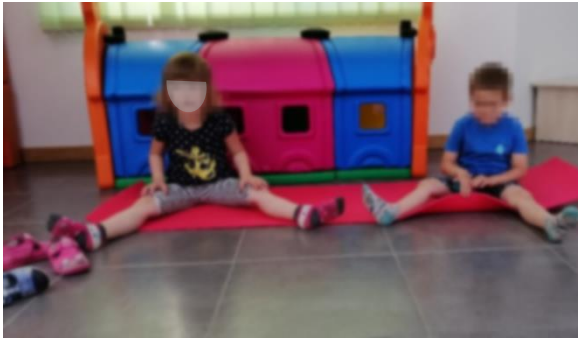
Slika 10. Početni položaj, izvor: vlastiti