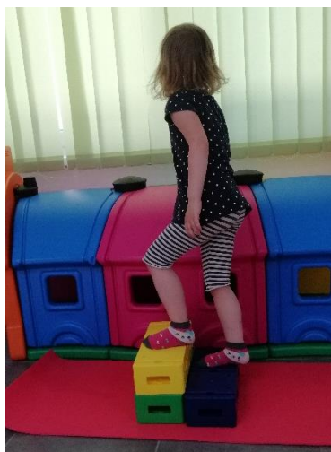
Slika 16. Hod uz stepenice, izvor: vlastiti