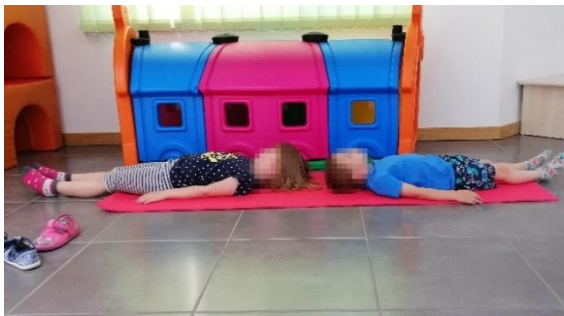
Slika 12. Početni položaj, izvor: vlastiti

Početni položaj je ležeći na leđima, ruke su uz tijelo, a noge ispružene. Izvodi se podizanje nogu prema gore, noge bi trebale ostati ispružene i spojene, odize se i zdjelica od podloge.