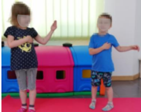
Slika 7. Istezanje lijeve ruke u lijevu stranu

Početni položaj je stojeći, noge su spojene, lakat jedne ruke savinut je tako da je ruka na prsima, a druga ruka je uz tijelo. Izvodi se istezanje jedne ruke (desne ruke u desnu stranu, lijeve ruke u lijevu stranu), vraćanje u početni položaj. Isto se ponavlja za drugu ruku.