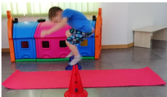
Slika 23. Preskakanje prepreke

Potrebno je postaviti prepreku koja odgovara fizičkom razvoju djeteta. Dijete zatim upućujemo kako da preskoči prepreku.