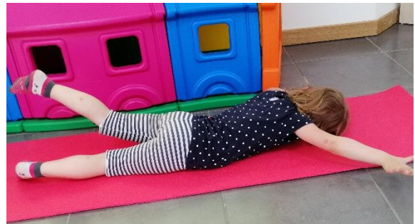
Slika 21. Odizanje noge i suprotne ruke, izvor: vlastiti