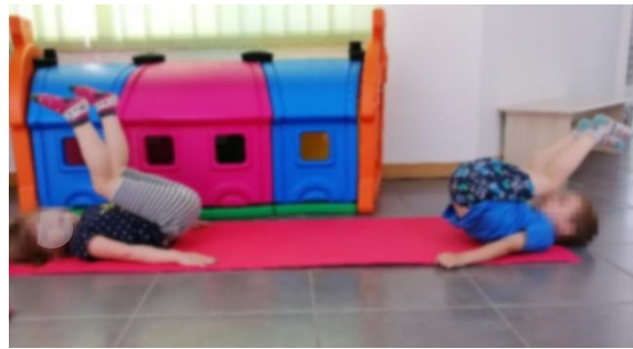
Slika 13. Svijeća