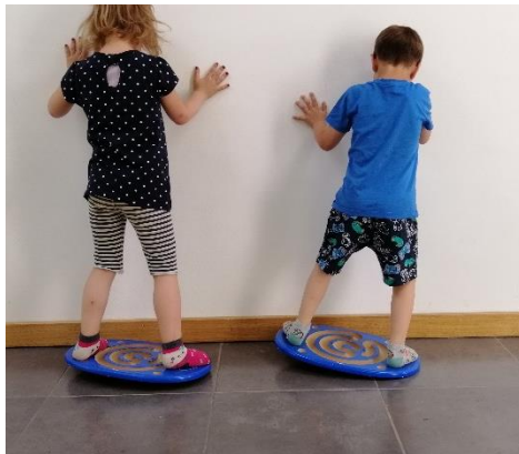
Slika 14. Balansiranje

Djeca stoje na balansnoj podlozi i prebacuju težinu s lijeva na desno i obrnuto, mogu prebacivati težinu unaprijed i unazad.