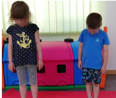
Slika 6. Pomicanje glave prema dolje