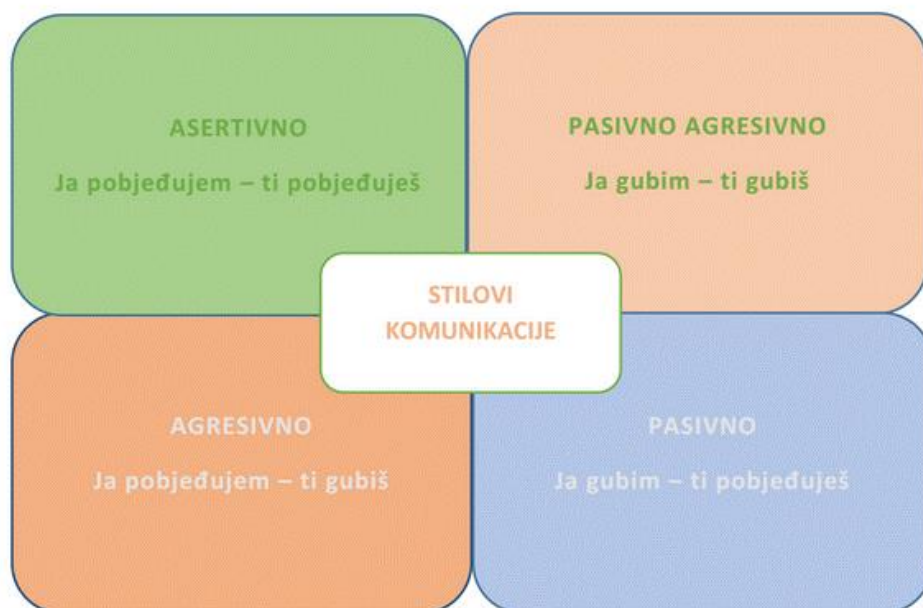
Slika 3. Stilovi komunikacije