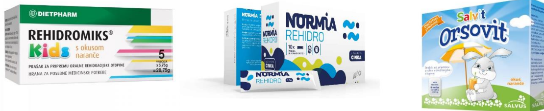
Slika 2. Neki od proizvoda za ORT dostupnih na tržištu

Kao preferirani tretman gubitka tekućine i elektrolita uzrokovan proljevom kod djece s blagom do umjerenom dehidracijom je oralna rehidracijska terapija (ORT). Oralna rehidracijska terapija (ORT) podrazumijeva korištenje vodene otopine soli i glukoze. Jednako je učinkovita i kao intravenozna terapija. Oralna rehidracijska terapija se može davati kod kuće, time smanjujući potrebu za posjetama ambulantnim i hitnim službama. Bistra gazirana pića i sokovi se ne smiju koristiti za vrijeme primjene oralne rehidracijske terapije jer se može pojaviti hiponatrijemija (Canavan i Arant, 2009). Hiponatremija se definira kao smanjenje koncentracije natrija u serumu na razinu ispod 136 mmol po litri (Adrogué i Madias, 2000). Čim se djeca dehidriraju, treba započeti redovitu prehranu primjerenu dobi (Canavan i Arant, 2009).