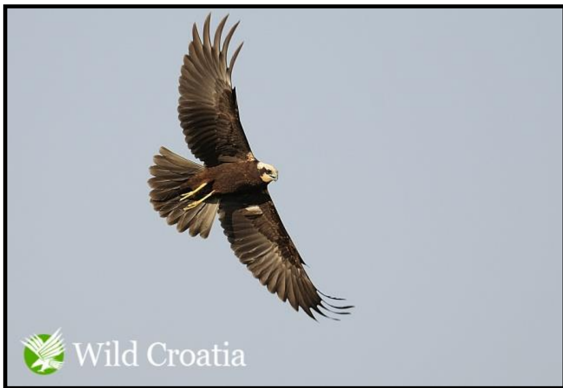
Slika 15. Eja močvarica

Eja močvarica ( Circus aeruginosus Linnaeus, 1758) je jedna od većih ptica grabljivica, zbog čega se i hrani čitavim nizom ranih organizama: manjim pticama, ribama, patkama, miševima, krticama, štakorima pa čak i manjim lisicama. Tijekom sezone razmnožavanja područje lova ove vrste je smanjeno te je njena prehrana usmjerena na močvarne ptice i male sisavce koje je lako uhvatiti. Eja močvarica lovi iz zasjede i ne oslanja se na brzinu.