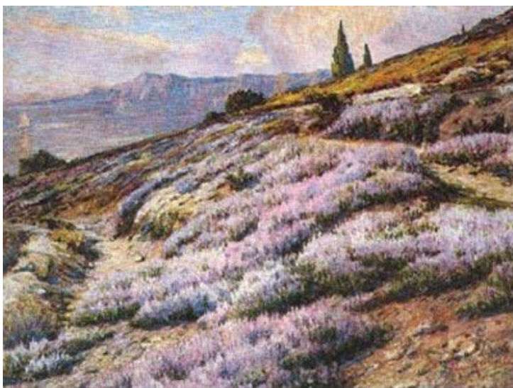
Slika 15. Mato Celestin Medović. Vrijes , 1911.

Boja vrijesa postaje simbolom Medovićeve pejzaža, a ta njegova karakteristična boja izrazito je bogata i raznolika; koji put je izražena u pastelnim nijansama, koji put je zasićena i tamna, a ponekad vršci vrijeska su pahuljasto meki i bijeli, ovisno o raspoloženju umjetnika. (Kružić-Uchytel, 1978)