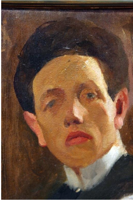
Slika 19. Josip Račić. Autoportret , 1907.

Iz Münchena odlazi u Pariz. U Parizu radi i stvara od veljače do srpnja 1908. godine kada se ustrijelio iz nerazjašnjenih razloga. Račić u Parizu neprestano radi, na način kasnog impresionizma i postimpresionizma slika pretežito akvarele po bulevarima i parkovima te psihološki i subjektivno interpretira likove u prostoru i kopira djela starih majstora u Louvreu. ( http://www.enciklopedija.hr/Natuknica.aspx?ID=51383 )