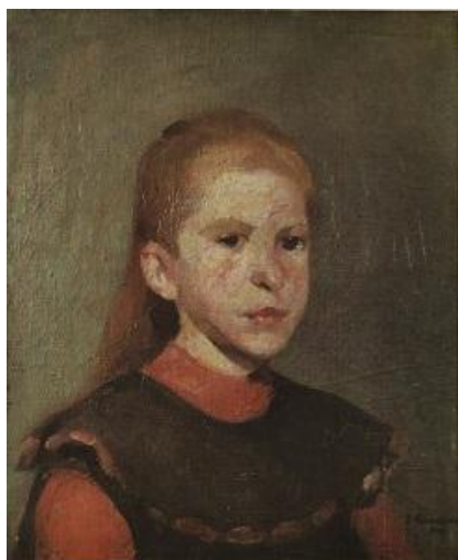
Slika 22. Oskar Herman. Djevojčica , 1907.

U Münchenu sreće Račića u privatnoj školi Antona Ažbèa, a u isto vrijeme upisali su i Akademiju, ali Hermanu poučavanje profesora Habermanna nije odgovaralo pa privremeno napušta Akademiju, a kada se vratio izabrao je klasu profesora Karla Rauppa radi veće slobode rada. U njegovim kao i u Račićevim radovima s početka školovanja vidi se Ažbèov utjecaj. Za vrijeme školovanja u Münchenu, nastaje djelo »Djevojčica« kod kojeg je boja u djelu smanjena na crnu, tamno-crvenu i žućkastu, ali je topla i gusta, a impast 38 je slobodan. (Gamulin, 1995)