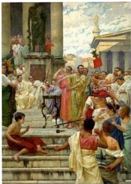
Slika 13. Mato Celestin Medović. Srijemski mučenici , 1895.-1896.