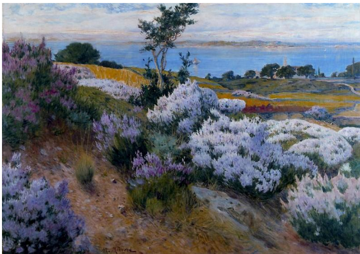
Slika 14. Mato Celestin Medović. Pelješko-korčulanski kanal, 1908.-1912.