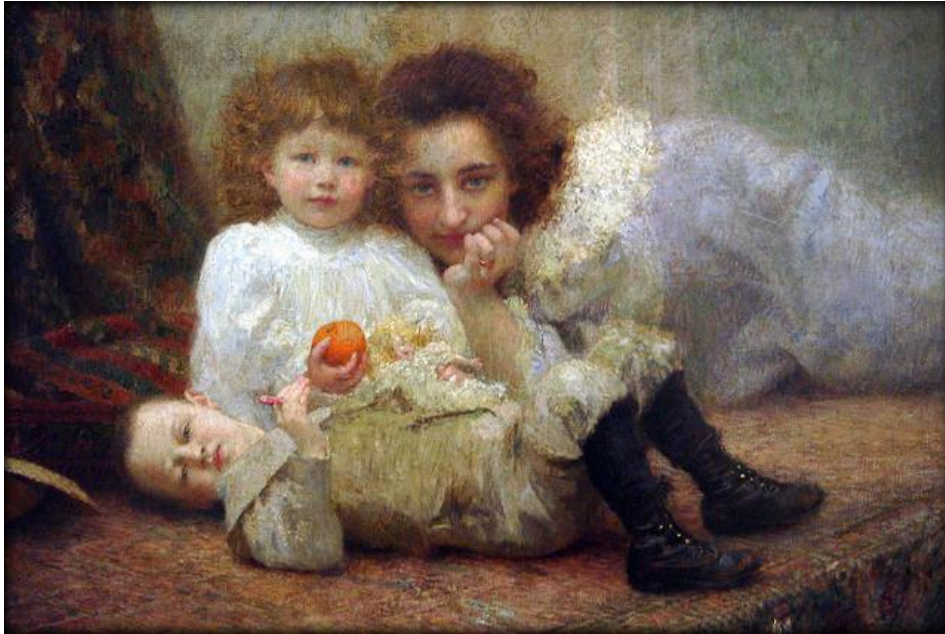
Slika 11. Vlaho Bukovac. Moje gnijezdo , 1897.

Godinu dana kasnije, slika djelo »Japanka«, Bukovac je sav u boji, bez konture i manetovske strogosti. Djelo je na neki način na križanju impresionizma i secesije. (Gamulin, 1995)