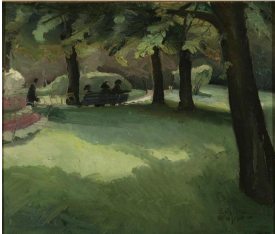
Slika 25. Miroslav Kraljević. Parc du Luxembourg II , 1912.

Nakon nešto više od godine dana boravka u Parizu, Kraljevićev broj radova bio je zaista pozamašan. Umjetnik je neiscrpno radio, a uljenim slikama treba pribrojiti crteže i grafike. Tako Kraljević u svojoj zadnoj godini boravka u Parizu postaje ilustrator ondašnjeg suvremenog pariškog mondenog i bohemskog života. Na više od dvjesto i pedeset crteža, nešto bakropisa i pastela, prostiru se žene i muškarci pariškog polusvijeta, plesači i plesačice koje Kraljević prikazuje s ironijom, ali i divljenjem. (Zidić, 2010)