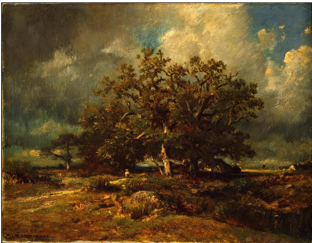
Slika 8. Jules Dupre. Stari hrast , oko 1870. Ulje na platnu. Nacionalna galerija umjetnosti, SAD.