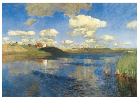
Slika 7. Izak Levitan. Jezero Rus' , oko 1899.

Hudson River škola je američki umjetnički pravac 19. stoljeća kojeg je činila skupina pejzažnih slikara čija je estetska vizija bila oblikovana romantizmom. Pokret je dobio ime po nizu slika pejzaža rijeke Hudson i okolnog područja. Umjetnička djela Škole Hudson River prikazuju američku tematiku 19. stoljeća kao što su otkriće i istraživanje. Teme slika su američki pejzaži u pastoralnom ugođaju, gdje ljudska bića i priroda mirno koegzistiraju. Pejzaži Škole Hudson River okarakterizirani su realističnim, detaljnim prikazom prirode, prikazujući ponekad idealizirane scene poljoprivrede uz preostale dijelove divljine, koja ubrzano nestaje iz doline rijeke Hudson. Thomas Cole se općenito smatra osnivačem Hudson River škole. Druga generacija umjetnika Škole došla je do izražaja nakon Coleove smrti 1848. Skupini nadalje pripadaju Coleov učenik Frederic Edwin Church te John Frederick Kensett i Sanford Robinson Gifford. Djela ovih umjetnika druge generacije često se opisuju kao primjeri luminizma koji s impresionizmom dijeli naglasak na efektu atmosferskog svjetla. 8 Međutim dva stila su međusobno različita. Luminizam karakterizira posvećenost detaljima i skrivanje poteza kistom, dok impresionizam karakterizira nedostatak detalja s naglaskom na potezima kista. Luminizam kao pravac prethodi impresionizmu, ali svoj vrhunac doseže u impresionizmu. ( https://en.wikipedia.org/wiki/Hudson_River_School )