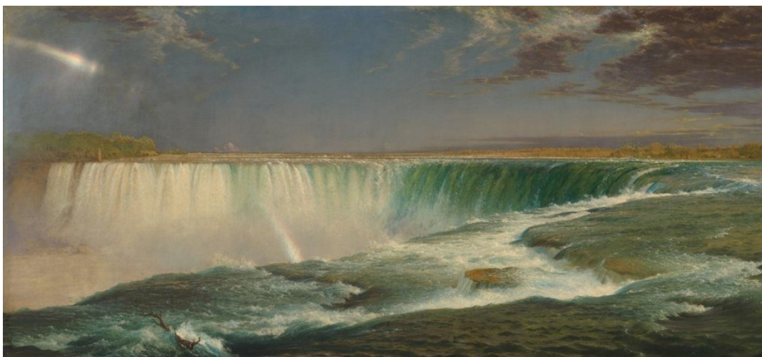
Slika 9. Frederic Edwin Church. Niagarini slapovi , 1857. Corcoran Gallery of Art, Washington, DC.