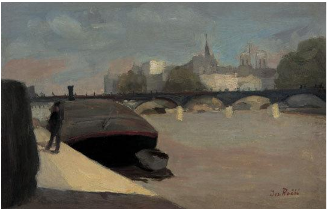
Slika 20. Josip Račić. Pont des Artes , 1908.

Iz Münchena odlazi u Pariz. U Parizu radi i stvara od veljače do srpnja 1908. godine kada se ustrijelio iz nerazjašnjenih razloga. Račić u Parizu neprestano radi, na način kasnog impresionizma i postimpresionizma slika pretežito akvarele po bulevarima i parkovima te psihološki i subjektivno interpretira likove u prostoru i kopira djela starih majstora u Louvreu. ( http://www.enciklopedija.hr/Natuknica.aspx?ID=51383 )