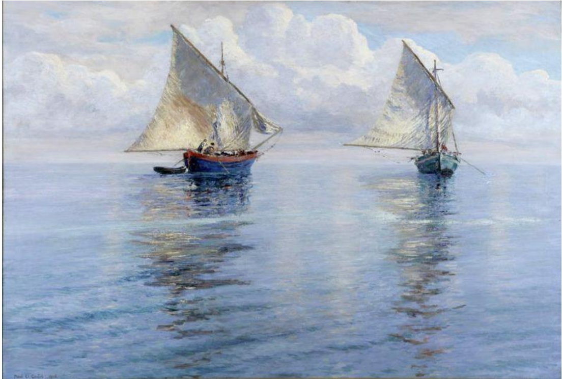
Slika 16. Menci Clement Crnčić. Bonaca , 1906.

1906. godine slika i motive iz Zagreba, djelo »Bakačeva kula« upotpunjena je šarenilom narodnih nošnji. Temi Zagreba vraćao se nekoliko puta na manjim slikama koje je su bile u duhu impresionizma. 1911. mijenja način rada, a dolazi i do novih tema budući da ga put na Velebit suočava s novim pejzažima, bojama i problemom titranja bezbojnog zraka nad cijelim pejzažom. U nadolazećim godinama putuje po unutrašnjosti zemlje, što nam je zabilježio slikama »Motiv s Korane« i »Slunje«, gdje od naglašenog kolorizma prelazi na zagasitije boje u tonovima i nijansama. Problemom svjetla, tamnijim bojama, slikanjem u tonovima ponovno je zaokupljen u zadnjem desetljeću svoga života, a vraća se i ljudskim likovima. Zaokružujući sveukupan rad M. Cl. Crnčića možemo reći da je on velik, raznolik i da je svojim djelima predstavio duh vremena kojem je pripadao. Ne smijemo zaboraviti da je uz interpretacije marina, Crnčić važan kao prvi školovani grafičar s kojim započinje razvoj moderne hrvatske grafike, kao i njegovu iznimnu pedagošku vrijednost. (Gamulin, 1995)