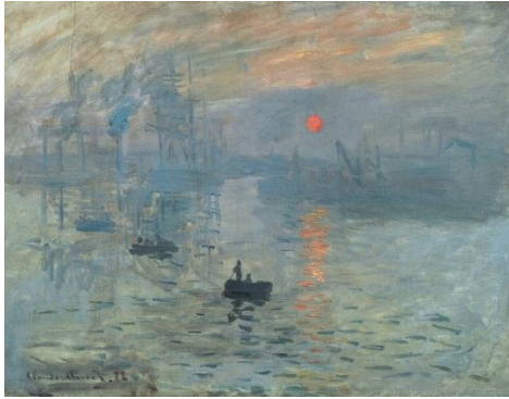
Slika 1. Claude Monet. Impresija, izlazak sunca , 1874.

Impresionisti se odlučuju za izravno promatranje prirode, istražuju optičke fenomene boje, mijene i preobrazbe svjetlosti i ozračja, slikaju učinak svjetlosti u trenutku kada slika nastaje, udaljuju se od narativnoga tumačenja sadržaja i reprezentativnih motiva, a privlače ih trenutačni pokret i suvremene gradske teme izrazite čulnosti. Kako bi to postigli, napuštaju atelijere i slikaju u prirodi ( plein air 7 ), prilagođavajući izvedbu brzim promjenama dojmova i ozračja. Poticaje za nov način slikanja preuzimali su od slikara koji su slobodno tretirali boju i svjetlost, a to su bili Diego Velázquez, Frans Hals, Francisco Goya, William Turner i John Constable te pripadnici barbizonske škole. ( http://www.enciklopedija.hr/natuknica.aspx?id=27222 )