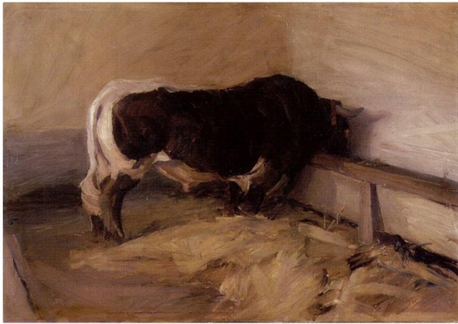
Slika 23. Miroslav Kraljević. Bik , 1910.

München je u to vrijeme veliko središte u kojem su se križala različita strujanja i različiti umjetnički utjecaji koje prepoznajemo u Kraljevićevim djelima. Jedan od takvih utjecaja, kako smatra naša kritika povijesti umjetnosti, dolazi od umjetnikova prijatelja, animalista Rudolfa Schramm-Zitaua, a utjecaj se očituje u Kraljevićevim djelima seoske ikonografije. Animalistički motivi kojima je umjetnik bio izložen tijekom praznika donose nam djela »Bik«, »Krave na paši«, »Bijeli konj«. Djela u kojima koristi širok i gust potez kista, koji ga odvaja od tonskog stupnjevanja, a približava tonskom kontrastiranju. Spomenuto djelo »Bik« iz 1910. godine, Kraljević slika alla prima 39 načinom izdvajajući pojedinosti životinjske anatomije, ekspresivno nanesenim gustim potezima. Umjetnik se koncentrirao na impresionističko rješenje likovnog problema u oblikovanju prostora što ga izdvaja od dotadašnjih hrvatskih plenearista. (Gamulin, 1995)