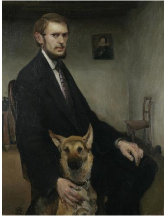
Slika 24. Miroslav Kraljević. Autoportret s psom , 1910.

U djelu je vidljiv utjecaj kako Maneta, tako i impresionizma, a oslanja se i na domaće prethodnike, prvenstveno Bukovčeve portrete. Djela koja nastaju u Požegi, ostvarena širokim potezima i oštrim kolorističkim kontrastima, govore o Kraljevićevom slikarskom rukopisu te o mladoj osobi koja izražava svoju skolonost prema podneblju iz kojeg potječe. Tada stvara i antologijska djela hrvatske umjetnosti, kao što su »Portret tete Lujke« (1911.), »Djevojčica s lutkom« (1911.), portreti oca i majke te požeški krajolik slikan u plenearističkom ugođaju pod impresionističkim utjecajem. (Gamulin, 1995)