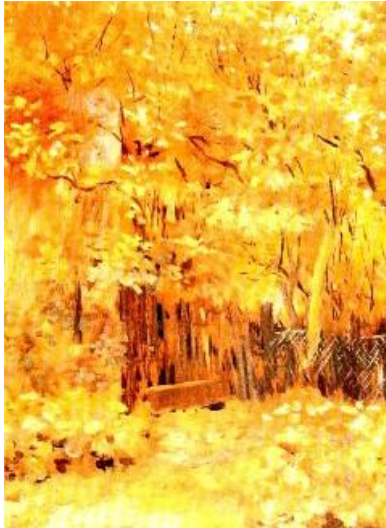
Slika 10 . Vlaho Bukovac. Jesenji pejzaž , 1883.

Nakon boravka u Dalmaciji, 1884.-1885. godine dolazi do prihvaćanja plenearizma i nagoviještanja buduće svijetle skale boja.