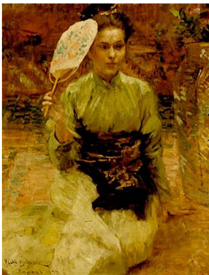
Slika 12. Vlaho Bukovac. Japanka , 1898.

Godinu dana kasnije, slika djelo »Japanka«, Bukovac je sav u boji, bez konture i manetovske strogosti. Djelo je na neki način na križanju impresionizma i secesije. (Gamulin, 1995)