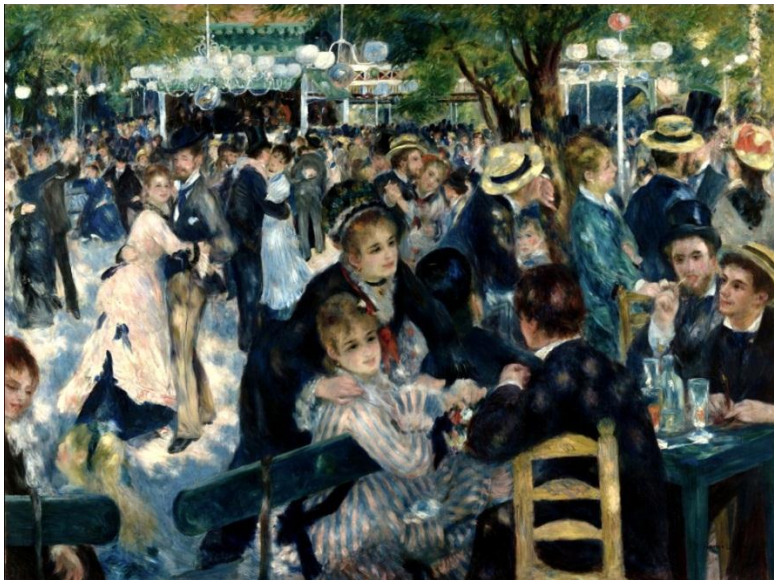
Slika 2. Auguste Renoir. Le Moulin de la Galette , 1876.

Impresionisti se odlučuju za izravno promatranje prirode, istražuju optičke fenomene boje, mijene i preobrazbe svjetlosti i ozračja, slikaju učinak svjetlosti u trenutku kada slika nastaje, udaljuju se od narativnoga tumačenja sadržaja i reprezentativnih motiva, a privlače ih trenutačni pokret i suvremene gradske teme izrazite čulnosti. Kako bi to postigli, napuštaju atelijere i slikaju u prirodi ( plein air 7 ), prilagođavajući izvedbu brzim promjenama dojmova i ozračja. Poticaje za nov način slikanja preuzimali su od slikara koji su slobodno tretirali boju i svjetlost, a to su bili Diego Velázquez, Frans Hals, Francisco Goya, William Turner i John Constable te pripadnici barbizonske škole. ( http://www.enciklopedija.hr/natuknica.aspx?id=27222 )