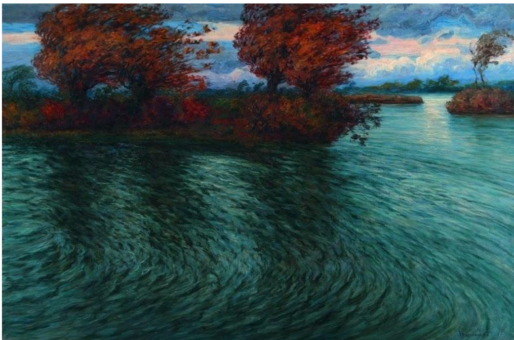
Slika 17. Ferdo Kovačević. Bura , 1910.

Bukovčev pointilizam, a od 1905. pa na dalje njegova djela odlikuju se raznolikošću fakture i usredotočenošću na riječni krajolik. I slike i studije radio je u prirodi i nije ih doradivao u ateljeu, a njegovim pejzažima prethodili su veliki pripremni radovi. Stoga se u njegovoj ostavštini nalazi dosta crteža, pastela, studija u ulju i skica koje dokazuju faze njegova rada. 1905. naslikao je »Zimski suton«, jedan od prvih zimskih pejzaža, a uz njega, između ostalih slika i »Vrbik na Savi«, za koju Kružić-Uchytíl piše kako je vrhunski domet slikareve rane faze i primjer našeg zakašnjelog impresionizma. U razdoblju od 1906. do 1915. godine kolorit mu je raznolik, kao i faktura koju prilagođava slikanim elementima i osvjetljenju. Tako slika »U predvečerje« iz 1908. obiluje tamnoljubičastim nijansama, »Zadnji sunčani traci« iz 1909. skalom toplih boja, »Na savskom rukavu« iz 1909. svjetlosnim refleksima, a djelo »Bura« iz 1910. i »Pred olujom« iz 1913. predstavljaju ga kao jedinstvenog slikara atmosfere. (Kružić-Uchytíl, 1986)