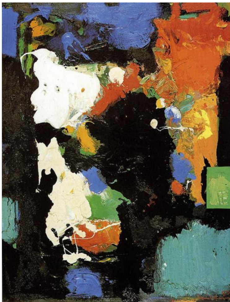
Slika 8. Hans Hoffman – The Conjuror (1959), ulje na platnu 39