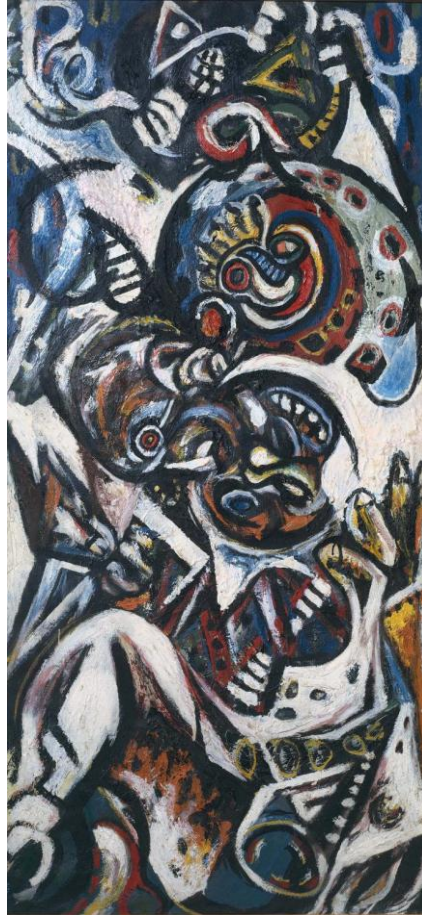
Slika 12. Jackson Pollock – Birth (1941.), ulje na platnu 48