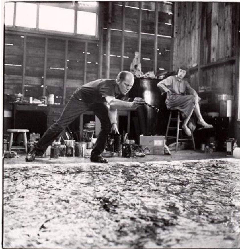
Slika 18. Hans Namuth snima Pollocka za dokumentarac 62

su stvorili sliku.. „kada sam u svojoj slici, nisam svjestan onoga što radim. Tek poslije postoji period upoznavanja kad vidim o čemu se radi... Slika ima svoj život. Ja ju pokušavam oživjeti. Tek kada izgubim kontakt sa slikom nastaje nered. Inače to je čista harmonija,, jednostavno slika izlazi na vidjelo.“ 61 (O`Hara Frank, Jackson Pollock, 1959)