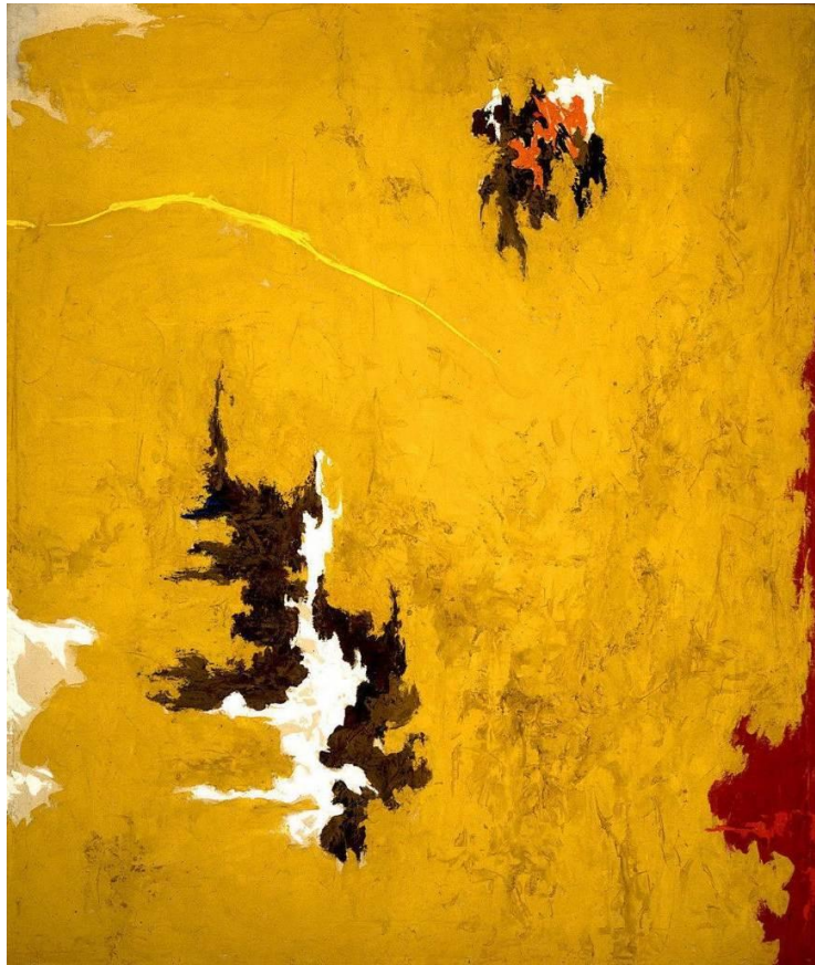
Slika 6. Clyfford Still – 1948-C (1948), ulje na platnu 34