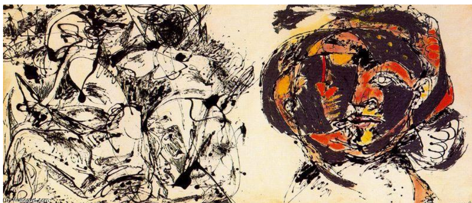
Slika 21. Jackson Pollock - Portrait and the Dream (1953), ulje, emajl na platnu 68

Do 1953. slikao je sve manje i manje i prvi put u desetljeću odlučio je da nema samostalnu izložbu. Nije bilo sigurno u kojem smjeru idu njegove slike. Portrait and the Dream (Slika 21.) razdvaja široko platno na dva dijela u dva različita stila – figurativni i apstraktni.