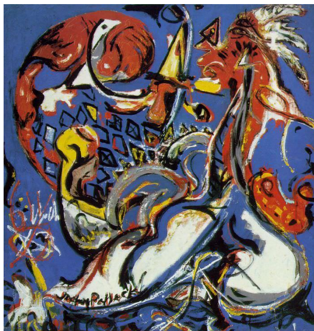
Slika 14. Jackson Pollock – Moon Women Cuts A Circle (1942.), ulje na platnu 54

Roberto Matta upoznao je Pollocka s Peggy Guggenheim 1943. godine te ga je ona tražila da pošalje komad za njezinu galeriju ( Art of The Century gallery). Pollock je poslao Stenografski lik (prvotno nazvan Painting – Slika). Na izboru slika za proljetnu izložbu jedan od sudaca bio je Piet Mondrian, poznati nizozemski apstraktni umjetnik te je pritom rekao: „Imam osjećaj da je ovo najzбудljivija slika koju sam vidio nakon dugo, dugo vremena, ovdje ili u Europi“ 53 . Stenografski lik ima žute, crne i bijele črčkarije nalik na grafite. Mondrian nije bio jedini umjetnik impresioniran Stenografskim likom, Francuz Marcel Duchamp bio je još jedan. Njih dvojica uvjerila su Peggy Guggenheim da Pollocku da prvu samostalnu izložbu. Howard Putzel, njezin asistent, nagovorio ju je da da Pollocku fiksnu mjesečnu plaću, te se on potpuno posvetio slikanju. Uzbuđen zbog prve samostalne izložbe, slikao je s ogromnom energijom, inspiriran motivima primitivne umjetnosti, naročito Indijanaca, koju je susreo u djetinjstvu (Slika 14.). (Oliver Claire,Artists in Their Time: Jackson Pollock, 2003)