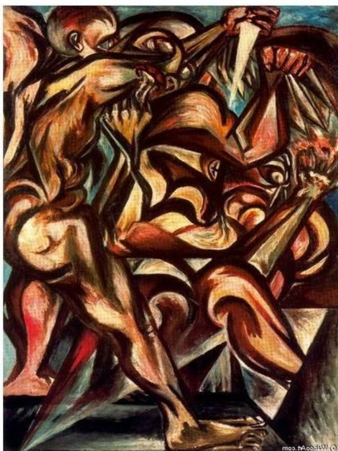
Slika 11. Jackson Pollock –Naked Man with Knife (1938. – 1940.), ulje na platnu 46

iznova zaposlio u FAP-u. Nova djela, kao što je Naked Man With Knife (Slika 11.) inspirirana su muralima Josea Orozcoa, kojima se divio. Od 1935. do 1942. godine radio je za FAP. Federal Art Project na svom vrhuncu zapošljavao je oko 5000 umjetnika, među kojima Arshile Gorky, Willem de Kooning, Philip Guston i Mark Rothko. Pollock je bio plaćen 23.50 $ tjedno za stvaranje jedne slike mjesečno – iako to nije uvijek postigao. Djela su bila za škole, poštanske urede, i druge javne zgrade, no mnoge su završile u skladištima i kasnije bile uništene.(O'Hara Frank, Jackson Pollock, 1959)