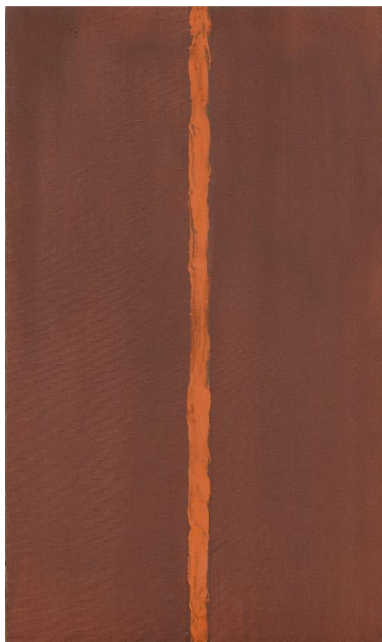
Slika 5. Barnett Newman – Onement I (1948), ulje na platnu 31

stvaranju slike Onement I: „... (stvarajući svoje djelo Onement, 1948.)... od tada sam morao odustati od bilo kakve povezanosti s prirodom, kao što se vidi... To ne znači da mislim da su moje stvari matematičke ili uklonjene iz života. Pod „priroda“ mislim nešto vrlo specifično. Mislim da su neke apstrakcije- npr. Kandinskog- stvarno slike prirode. Trokuti i sfere ili krugovi mogu biti boce. Mogu biti stabla, ili zgrade. Mislim da sam se u slici OnementI uklonio iz prirode. Ali nisam sebe uklonio iz života.“ 29 Ime slike je arhaična dervacija riječi „atonement“ 30 , značeći stanje spajanja u jedno. Za Newmana ova nejednako obojena vertikalna linija na radnim poljima boje ne dijeli platno, već spaja dvije strane, želeći pobuditi u promatraču intenzivno fizičko i emocionalno iskustvo. (Newmann Barnett and O'Neill John Philip, Barnett Newmann: Selected Writings and Interviews, 1992)