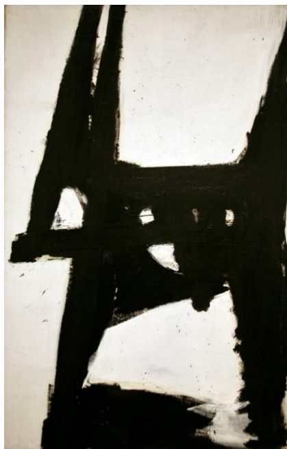
Slika 2. Franz Kline – FourSquare (1956.), ulje na platnu 16

U knjizi, K. Kuh „The Artist's Voice: Talks with Seventeen Artists“, Kline opisuje stvaranje svojih slika: „Radim oboje: Stvaram preliminarne skice, drugi put slikam direktno, onda krenem slikati te ju zatim prebojam da postane druga slika. Ako slika ne valja, bacim ju. Kada radim preliminarne skice, ne povećavam samo te crteže već planiram područja na velikoj slici koristeći male crteže za odvojene dijelove. Kombiniram ih u završnoj slici, često dodajući ili oduzimajući nešto s originalnih skica.“ 15