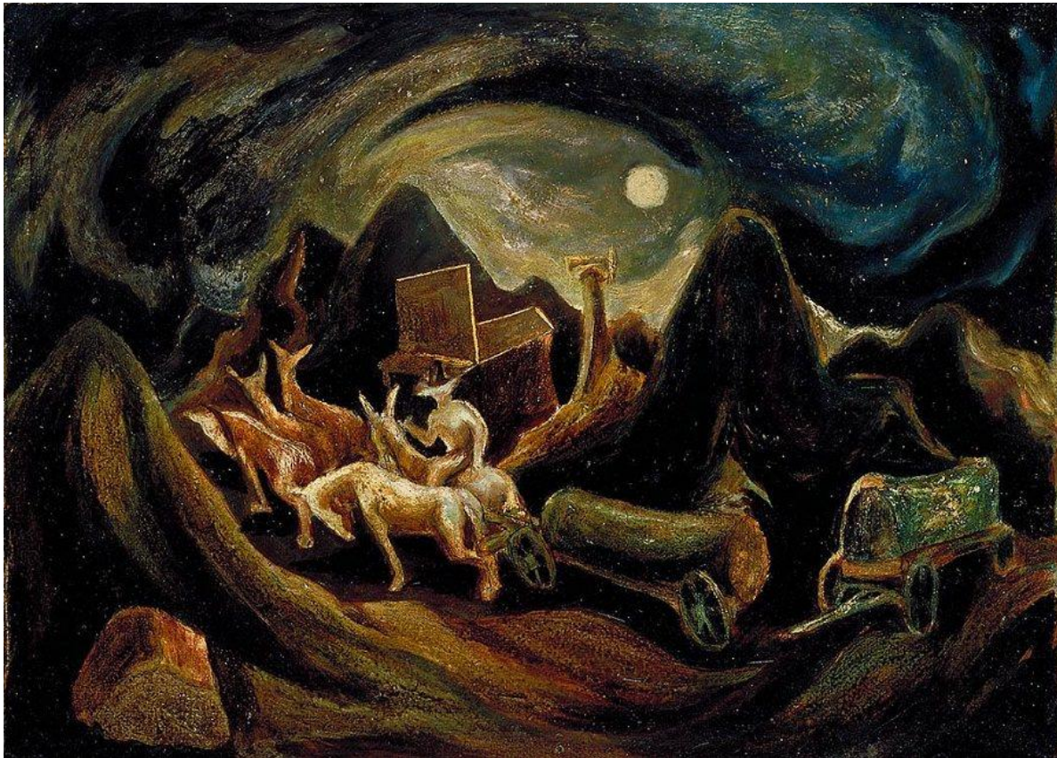
Slika 10. Jackson Pollock - Going West (1934. – 1938.), ulje na šperploči 44