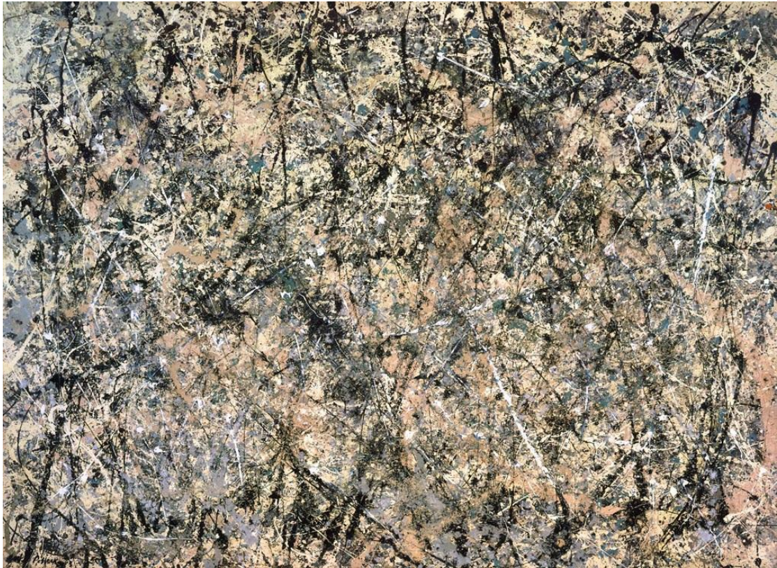
Slika 19. Jackson Pollock – Number 1 (1950), Lavander Mist, „drip“ slika 63

poznatija kao Lavander Mist (Slika 19.). (Oliver Claire, Artists in Their Time: Jackson Pollock, 2003)