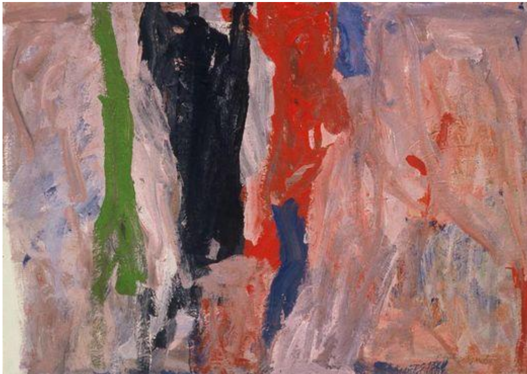
Slika 7. Philip Guston – Last Piece (1958), gvaš 36

Njegova poznatija slika, dok je još eksperimentirao s akcijskim slikarstvom, je Last Piece (1958.). Iako joj je samo ime Zadnji dio, ne predstavlja zadnju sliku apstraktnog slikarstva. Predstavlja prijelaz od blistavih oblika ranih 1950-ih prema prepoznatljivim motivima njegovim kasnijim, više figurativnim djelima. Za njega su slike poput rata između trenutka i određenog isječka iz sjećanja. (Anfam David, Abstract Expressionism, 1990)