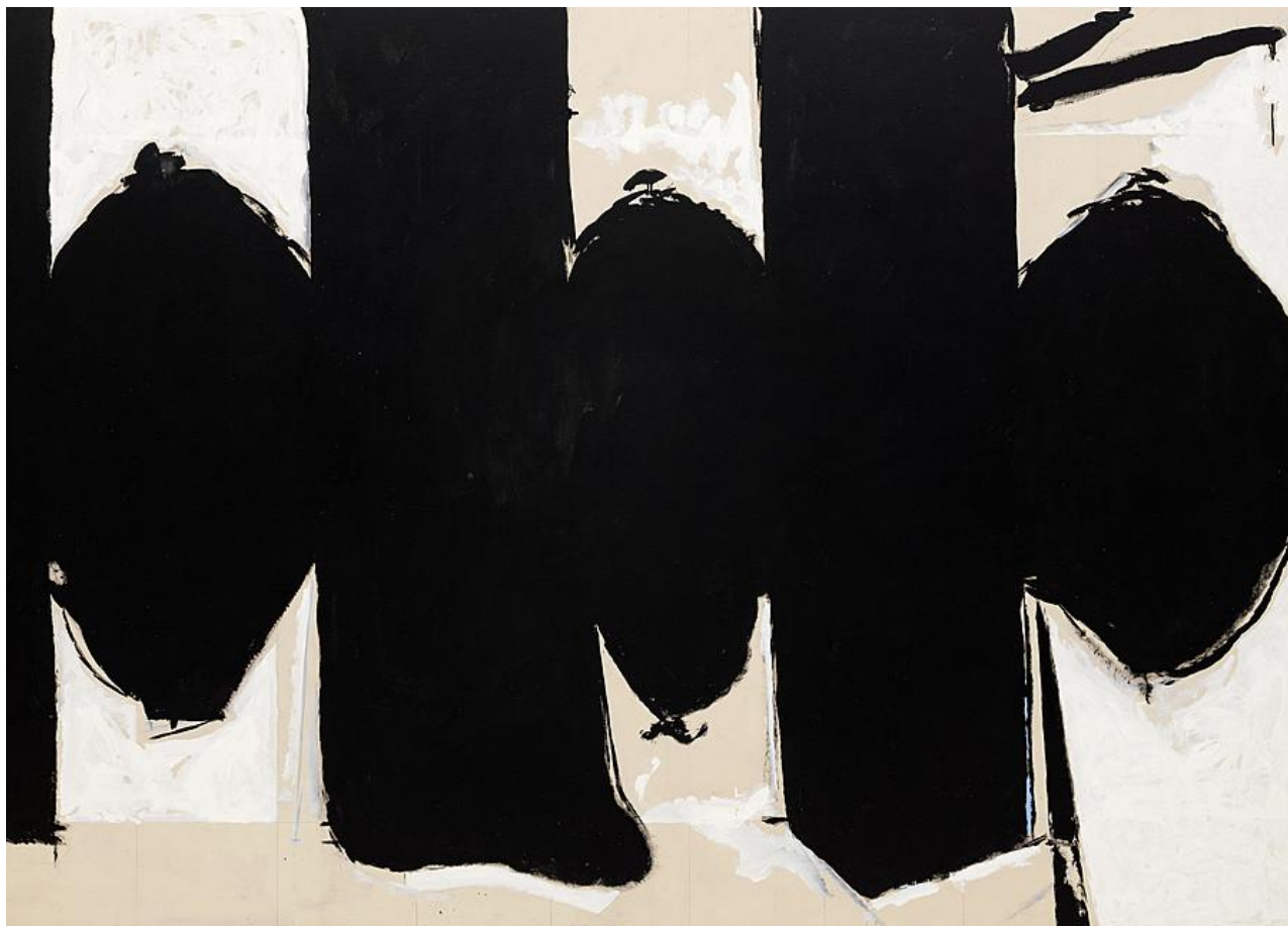
Slika 3. Robert Motherwell – Elegy to the Spanish Republic No.110 (1971.), akril s grafitom i ugljen na platnu 19