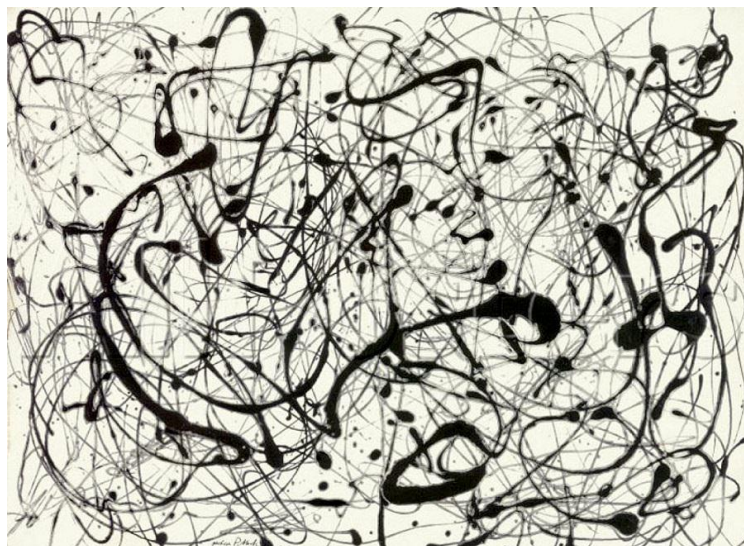
Slika 20. Number 14 (1951), emajl 67

izložbi. Iako je izložba postigla veliki uspjeh, Pollock nije uspio prevladati sumnju u sebe te ju je ostatak života pokušavao svladati kroz piće. Između 1951. i 1952. napravio je seriju slika kapajući i lijevajući crnu emajliranu boju 66 preko platna (Slika 20.). Pollock je napravio još nekoliko „drip“ slika, no prestao je koristiti tu tehniku.(Oliver Claire,Artists in Their Time: Jackson Pollock, 2003)