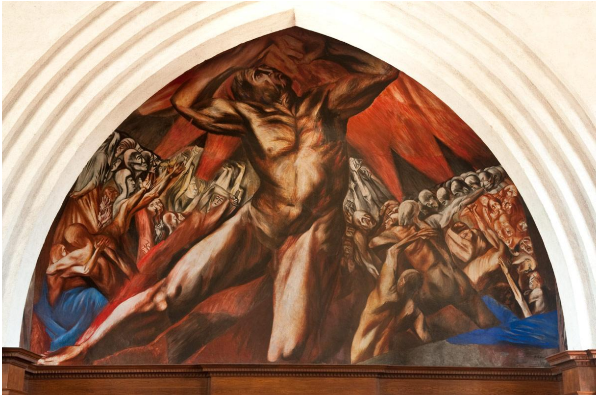
Slika 9. Jose Clemente Orozco – Prometej (1930.), mural 43

kako slika Man at the crossroads u newyorškom Rockefeller Centru. Ovo djelo je bilo uništeno prije nego je završeno jer je prikazivalo Vladimira Lenjina, komunističkog vođe ruske revolucije. Siqueiros je bio najotvoreniji i politički najaktivniji od meksičkih muralista. 1936. godine Pollock je direktno radio za Siqueirosa u njegovoj radionici. (O'Hara Frank, Jackson Pollock, 1959)