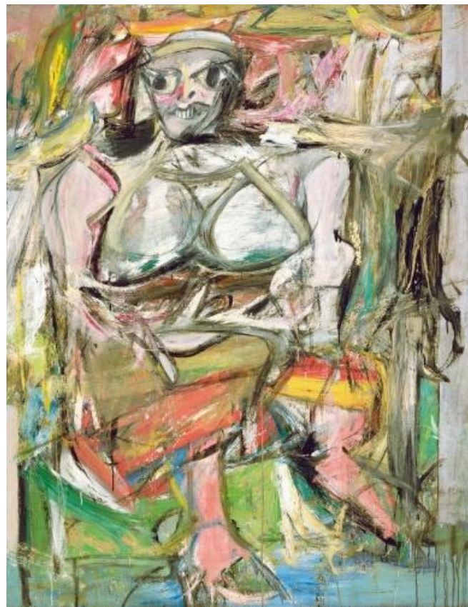
Slika 1. Willem de Kooning – Woman I (1950. -1952.) , ulje, emajl, ugljen na platnu 11

Iako je stekao svoj ugled serijama apstraktnih slika, bio je okrenut tradicionalnim temama i naposljetku postaje poznat po svojim slikama žena, koje je slikao kroz karijeru. Kasnije se okrenuo krajolicima, te ih je nastavio slikati i u svojim osamdesetima, kada mu je um bio pomućen Alzheimerovom bolešću. U intervjuu koji je proveo David Sylvester za BBC, 1962. godine, de Kooning priča o slikama koje je napravio nakon serije „Žena“: „Slike prikazuju emocije, većina njih. Većina njih su krajolici, autoceste i osjećaji toga, izvan grada- s osjećajem odlaženja u grad ili izlaženja iz njega. Ja nisam ruralni lik. Nisam- kako bih to rekao- „seosko dijete“. Ja sam ovdje i volim New York. Ali volim ići van autom... Jednostavno sam lud za vožnjama, cestama i autocestama.“ 10 Poznat po kontinuiranom radu na svojim platnima, de Kooning ih je često ostavljao s dojmom nedovršenosti, kao da je slika još u procesu kretanja i stvaranja do konačne definicije. (Ross Clifford, Abstract Expressionism: Creators and Critics , 1990)