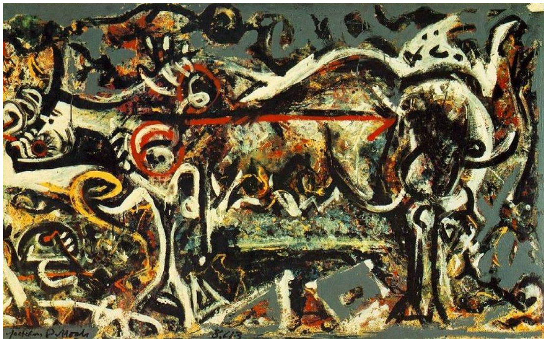
Slika 15. Jackson Pollock – She Wolf (1943.), ulje na platnu 57

glava bika, slična stiliziranim bikovima Pabla Picassa, glava na desno je od bizona kao na novčićima iskovanima između 1913. i 1938. godine. 1944. godine kada je MoMA 55 (Museum of Modern Art) otkupila sliku She Wolf za svoju muzejsku kolekciju Pollock ju je odbio objasniti govoreći kako je ona „nastala zato jer ju je on morao naslikati. Svaki pokušaj da kažem više o tome... samo bi je uništilo.“ 56