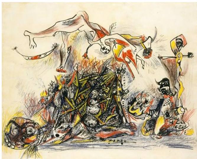
Slika 16. Jackson Pollock – War (1947.), tinta, gvaš, olovka 58