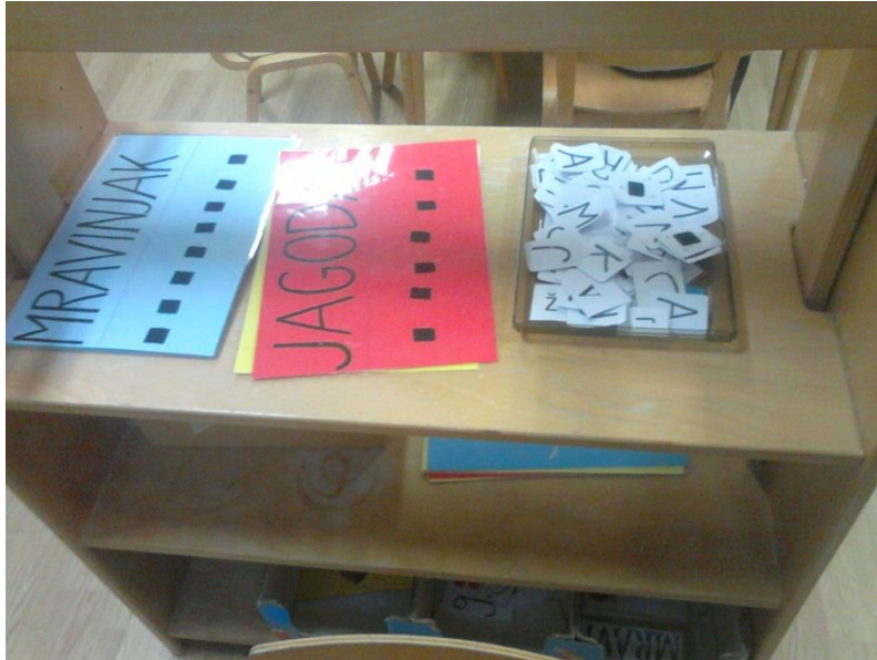
Slika 2. Metodički artefakti za razvoj početne pismenosti