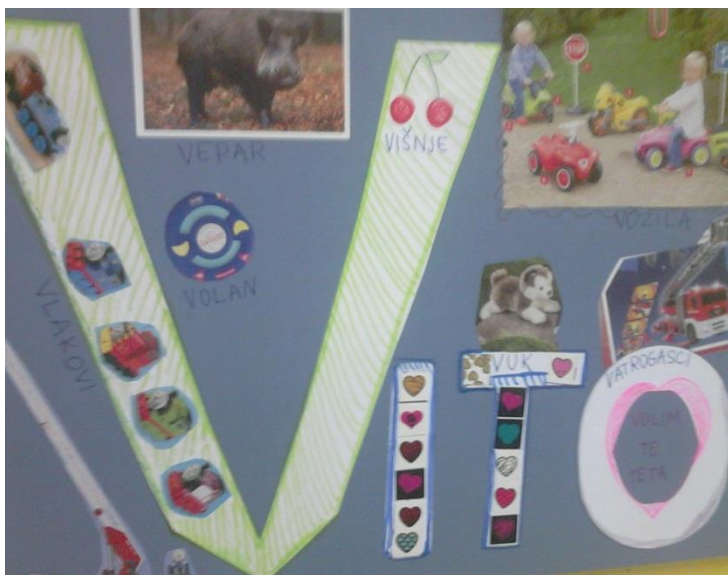
Slika 3. Ime dječaka koje je sam ukrasio