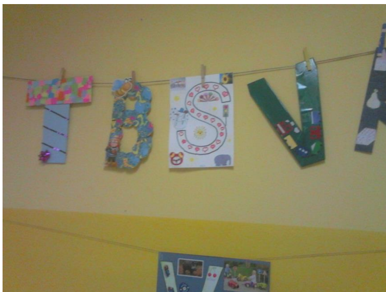
Slika 4. Slova koja su zajedno izradili djeca i roditelji