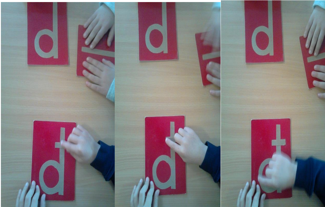
Slika 6. Upoznavanje sa slovom đ taktilnom tehnikom hrapavih slova