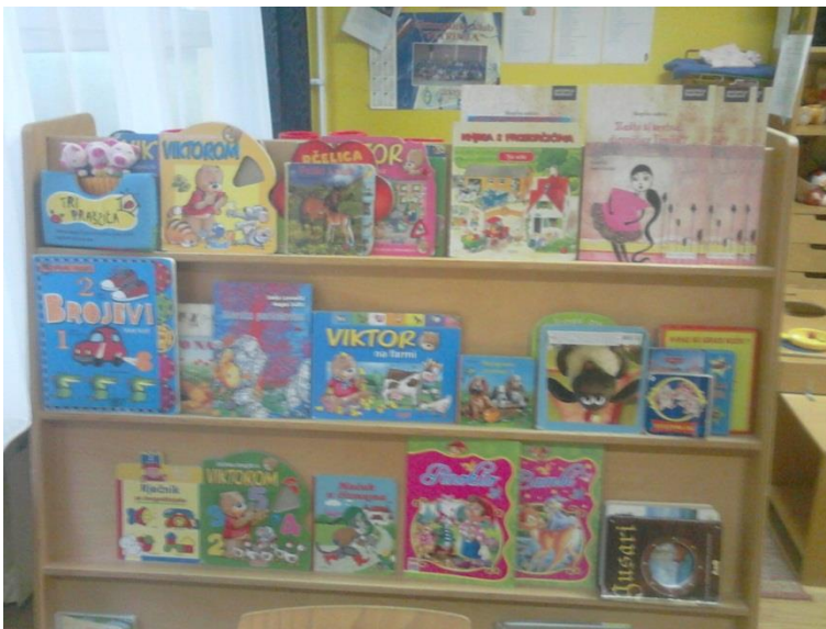
Slika 1. Slikovnice ponuđene u kutiću početne pismenosti