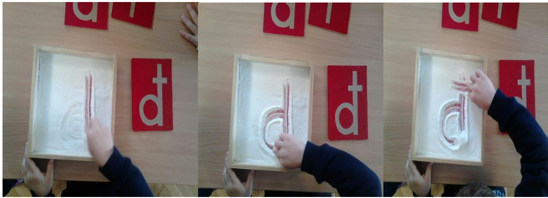
Slika 7. Nakon hrapavih slova dječak upisuje slovo đ u pijesku