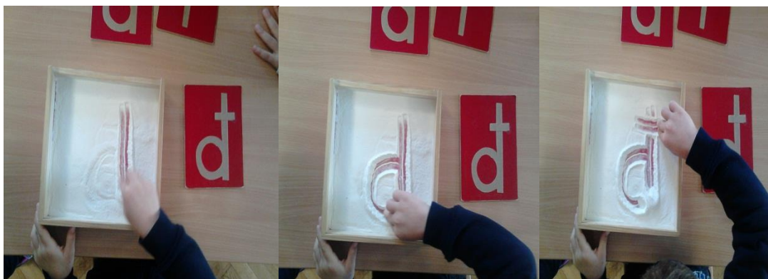
Slika 7. Nakon hrapavih slova dječak upisuje slovo đ u pijesku