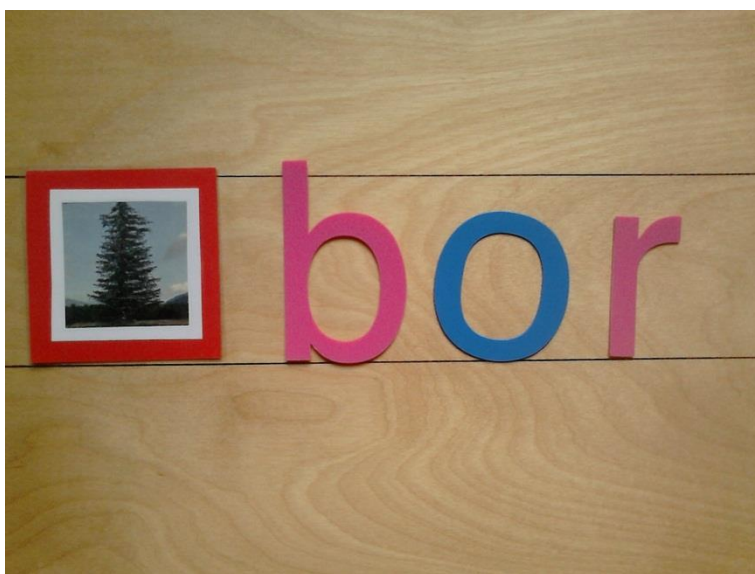
Slika 8. Pisanje pomoću pomične abecede i kartice sa slikama