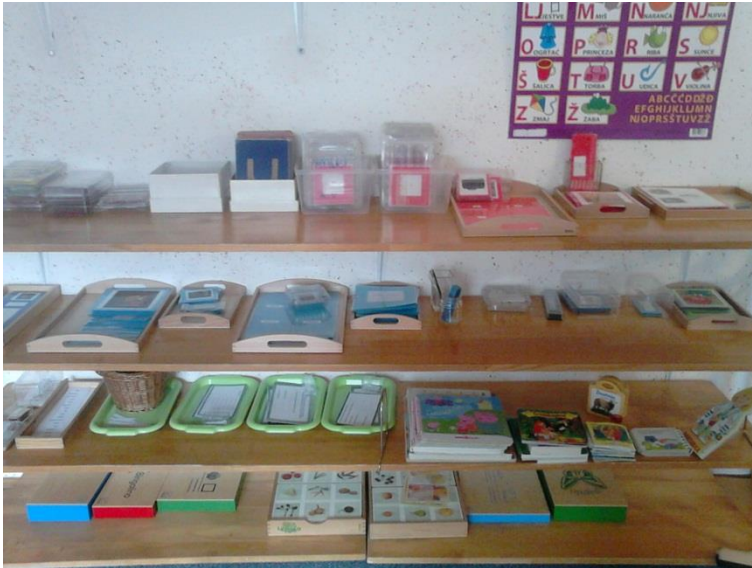
Slika 5. Montessori materijal za jezični razvoj djece predškolske dobi