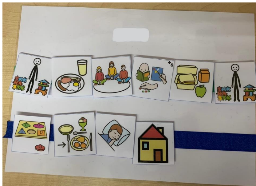
Slika 3. Individualni raspored za N.N.

Napomena. Autor: Centar za odgoj, obrazovanje i rehabilitaciju Križevci