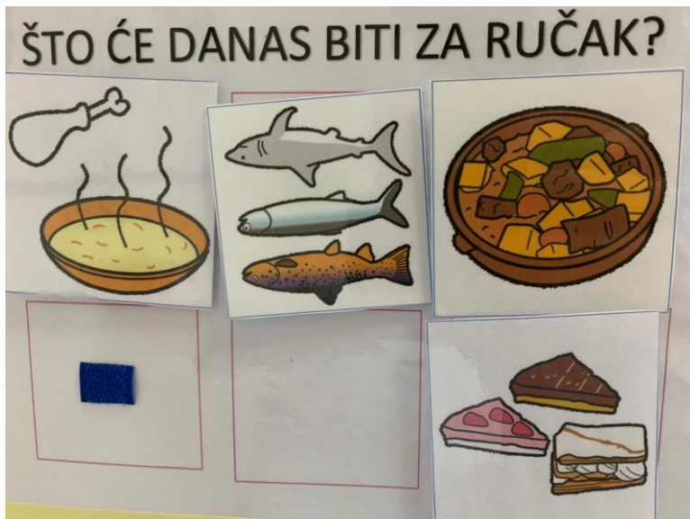
Slika 2. Raspored ručka

Napomena. Autor: Centar za odgoj, obrazovanje i rehabilitaciju Križevci