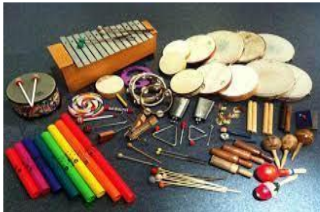
Slika 4. Orffov instrumentarij

Govoreći o glazbi u ranoj dobi, potrebno je spomenuti Carla Orffa, njemačkog skladatelja, koji je osmislio instrumente za uvođenje djece u svijet glazbe. „Njegov pristup, poznat kao Orff Schulwerk metoda, sjedinjavao je ritmičan govor nalik rapu , geste, pokrete te pjevačke improvizacije i sviranje jedinstvenih udaraljki“ (Campbell, 2005; str. 181). Njegova metoda provodi se tako da se djeca kreću, plješću i/ili sviraju instrumente, pritom izgovarajući dječje pjesmice ili priče. „Način proizvodnje zvuka na pojedinom instrumentu pogoduje razvoju motorike i koordinacije ruke, podlaktice, zapešća, šake i prstiju“ (Blanka Šmit, 2001; str. 56). Razvojem motorike ruke, ujedno se priprema djecu i za početno pisanje (Blanka Šmit, 2001). Instrumenti koji se koriste zovu se „Orffov instrumentarij“ (Slika 4.) i dijele se na udaraljke s neodređenom visinom tona (zvečke, drveni štapići, bubnjevi, tamburin i sl.) te na instrumente s određenom visinom tona (ksilofon, metalofon, zvončići i sl.).