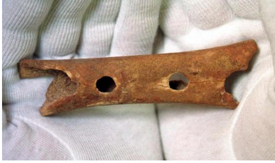
Slika 1. Instrument nađen u Sloveniji