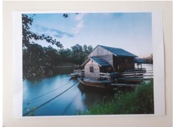
Fotografija 10. Rijeka

https://express.24sata.hr/galerije/galerija-7883?page=1 (26.01.2021.)