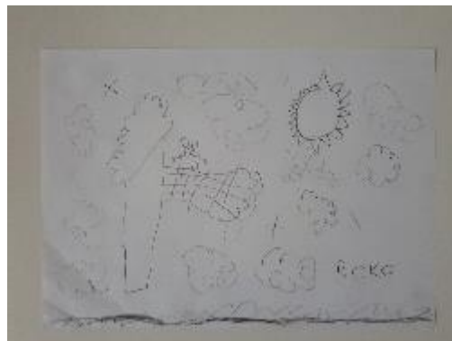
Fotografija 27. Roko (6 godina)