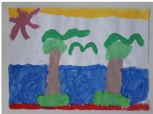
Fotografija 32. Sven (6 godina)