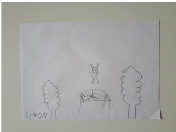
Fotografija 4. Simon (6g.): “Malinko je cijelo vrijeme skakao po trampolinu.”