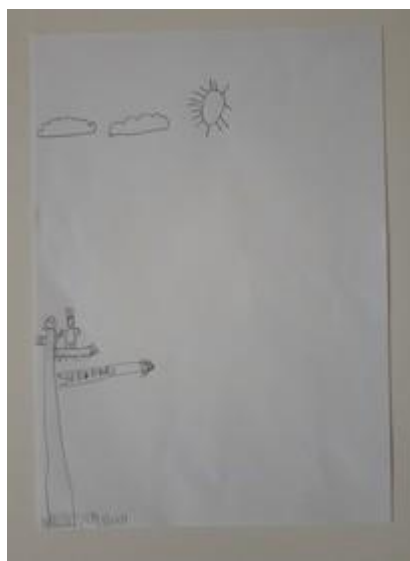
Fotografija 25. Sven (6 godina)