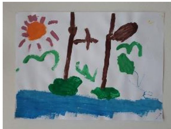
Fotografija 31. Franka (6 godina)