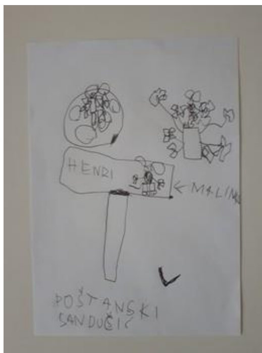
Fotografija 1. Lovro( 7g.): “Malinko je bio u poštanskom sandučiću, na drvu i jezercu (malom jezeru).”

Radovi odgovaraju fazi izražavanja složenijim simbolima koja je karakteristična za dob djece od 6 do 7 godina. Djeca su dala imena crtežima koja su nacrtala. Crteži su ispunjeni složenim simbolima koji se ne odnose na neke konkretne objekte već predstavljaju žurbu ili akciju.