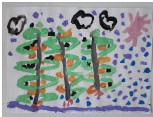
Fotografija 33. Jakov (7 godina)