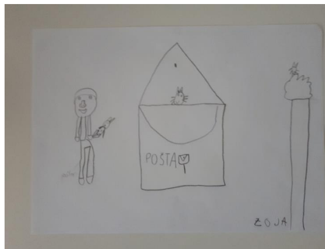
Fotografija 3. Zoja (6 godina): “Malinko je bio na drvetu i u poštanskom sandučiću.”

Na fotografijama 2. i 3. u prikazu ljudskog lika vidljivo je da se pojavljuje tijelo. Ruke likova izlaze iz tijela, a ne iz glave te završavaju prstima. Djeca su također nacrtala kosu i dijelove lica poput nosa, usta i oči te pripadajuću odjeću.