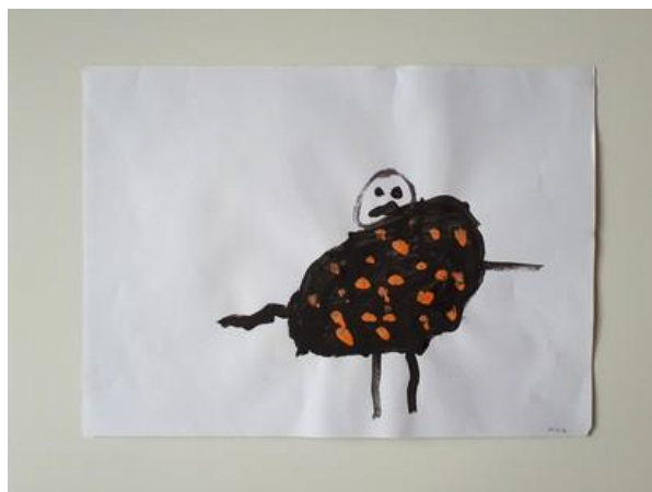
Fotografija 18. Mika (6 godina):

U određenim radovima uočeno je da su djeca određene boje unijela kao stalne i određene znakove za neke pojave npr. na fotografiji 17. djevojčica Z. je naslikala stablo smeđe boje, a krošnju zelene. U radovima je vidljivo da su djeca vrlo slobodna u odabiru boja i načinu slikanja te da je motivacija pomogla u originalnom stvaranju.