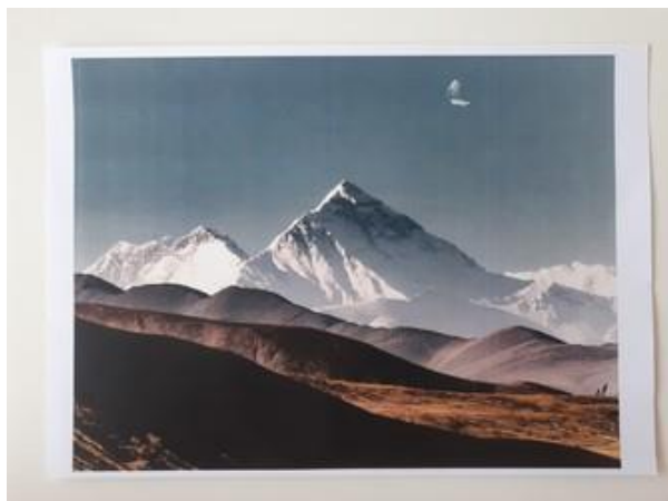
Fotografija 7. Planine

https://image.dnevnik.hr/media/images/920x695/Dec2019/61804108.jpg (26.01.2021.)