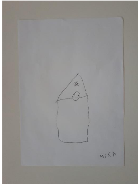
Fotografija 6. Mika (6 godina): “Malinko je u poštanskom sandučiću.”

Na fotografijama 3. i 6. vidljivo je kopiranje mišljenja da je Malinko u poštanskom sandučiću, ali djeca su to nacrtala na drugačije načine, upotrebljavajući drugačije simbole. Djeca su uključivala veći broj detalja u crtež poput drveća i oblaka. Smatram da je aktivnost bila uspješna i da su djeca mogla izmaštati završetak slikovnice, iako su određeni dijelovi aktivnosti unaprijed bili zadani. Djeca nisu kopirala izgled likova poput plišanoga zeca Malinka i Henryja iz slikovnice te su sama izmaštala njihov izgled i osobine. Slikovnica je pružala djeci estetski doživljaj, proširivala njihov vokabular te omogućila kreativno izražavanje.