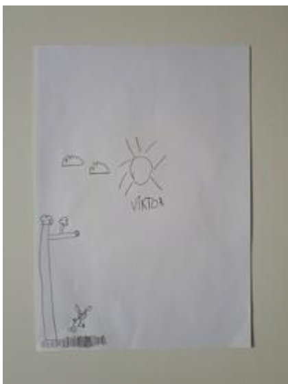
Fotografija 24. Viktor (6 godina)