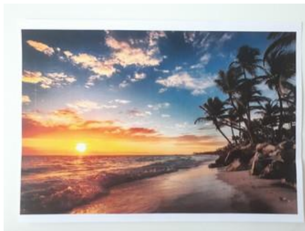
Fotografija 8. Otok