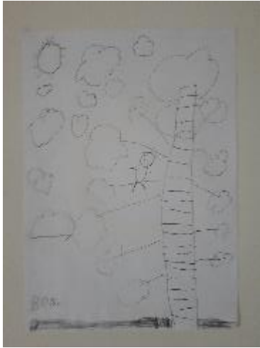
Fotografija 28. Bono (6 godina )