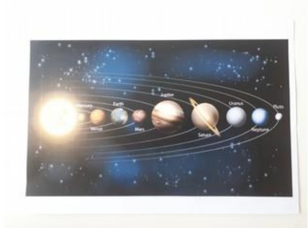
Fotografija 12. Planete