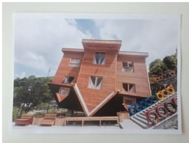
Fotografija 13. Neobična građevina

https://www.euro.cz/mf-galerie/kuriozni-domy/galerie-6338-8/ (26.01.2021.)