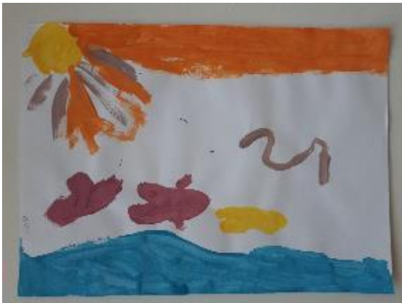
Fotografija 30. Gloria (6 godina)