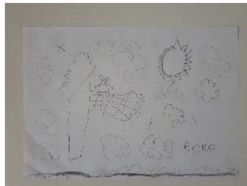
Fotografija 27. Roko (6 godina)