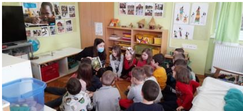
Fotografija 14. Fotografija motivacije likovne aktivnosti

Fotografija 13. “Kako vam izgleda ova građevina? Mislite da se u njoj može živjeti? Zamislite vi neku svoju građevinu u kojoj je sve naopačke i koja je okrenuta naopačke. Kako bi izgledala njezina unutrašnjost, kako biste se kretali u njoj? Od čega bi se sve sastojala?”