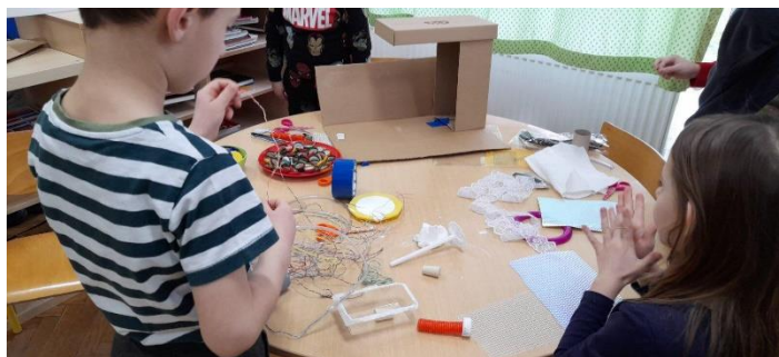
Fotografija 43. Fotografiranje dijelova aktivnosti