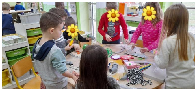
Fotografija 42. Fotografiranje dijelova aktivnosti