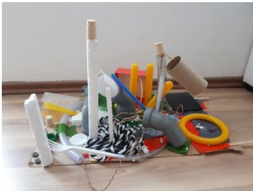
Fotografija 22. Jakov, Una, Muiz ( 6 i 7 godina): “ Mi jako želimo da padne snijeg, pa smo napravili stroj koji će ispuštati pahuljice.”

Stroj s fotografije 22. prikazuje različitost materijala i elemenata. Ova grupa djece je željela da padne snijeg pa su uz pomoć različitih tuljaca, plastičnih elemenata, žica, vezica kombinirali kako da ga izrade.