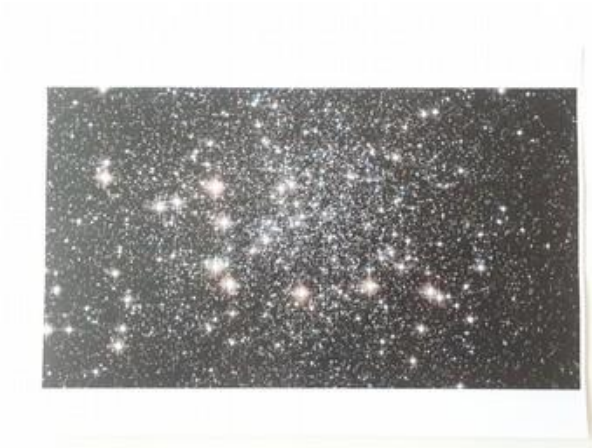
Fotografija 9. Zvezdano nebo

https://express.24sata.hr/galerije/galerija-7883?page=1 (26.01.2021.)