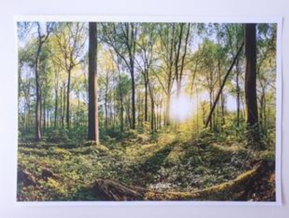
Fotografija 11. Šuma

https://www.shutterstock.com/image-photo/sunset-forest-705454117 (26.01.2021)