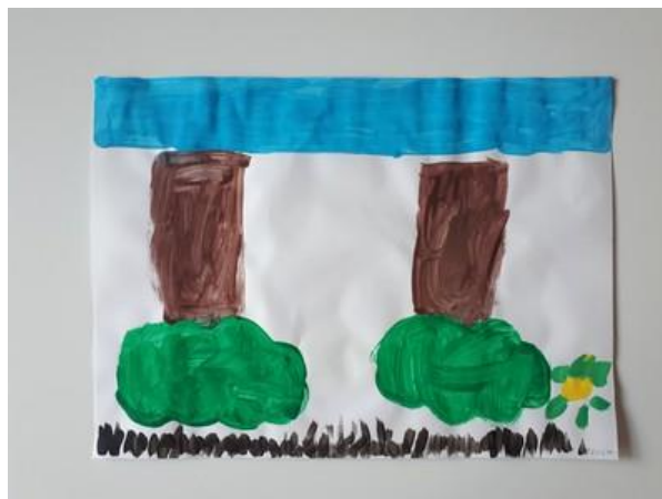
Fotografija 17. Zoja (6 godina):

“Ovo je moja neobična šuma, drveća su naopako, trava je crna, a nebo plavo.”