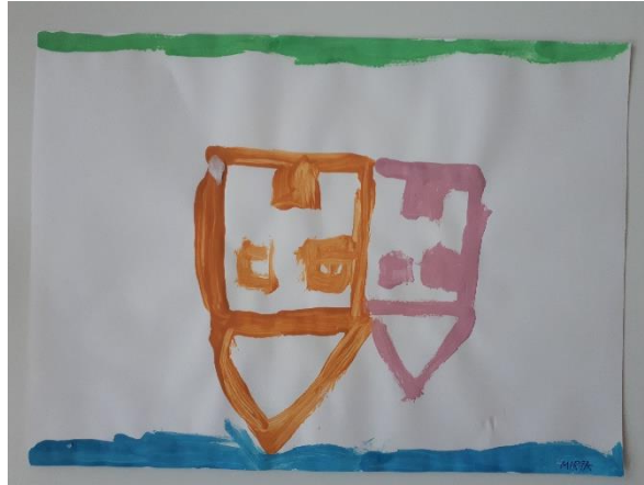
Fotografija 20. Mirta (6 godina):

“Ovo je moja neobična građevina koja je naopačke, trava je plava, a nebo zeleno.”