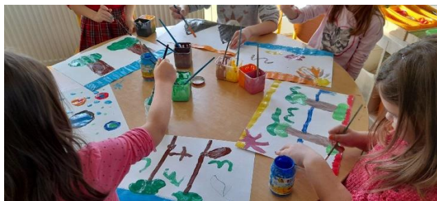
Fotografija 40. Fotografiranje dijelova aktivnosti