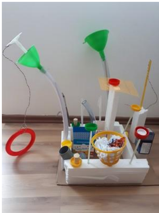
Fotografija 21. Sven, Bono, Simon (6 godina): “Ovo je naš neobičan stroj. Služio bi nam za proizvodnju lego kockica.”

Tijekom konstruiranja stroja s fotografije 21. dječaci su imali poteškoća kako da cijevi budu čvrste. Prvo su pokušali zalijepiti ih na karton, ali nisu stajale uspravno pa su došli na ideju da iskoriste stiropor. Cijevi su stavili unutar stiropora, a stiropor zalijepili za karton. Kada su to uradili samo su nadodavali elemente poput čepova, fasadnih mrežica, lijevka, kutija. Dječaci jako vole lego kocke pa su i samostalno odlučili da žele napraviti takav stroj koji može proizvoditi lego kocke.