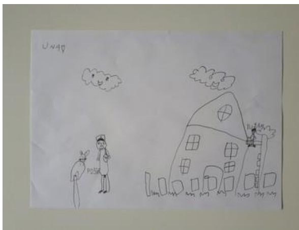
Fotografija 2. Una (6.g), “Malinko je cijelo vrijeme bio u poštanskom sandučiću, a Henry je tužan.”

Na fotografiji 1. dječak L. Je zamislio da je Malinko bio u jezeru i na drvu te je simbolima prikazao žurbu. Prikazao je da je Malinko već posjetio ta mjesta te da se skriva na posljednjem mjestu u poštanskom sandučiću.