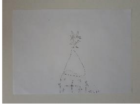
Fotografija 29. Muiz (6 godina)