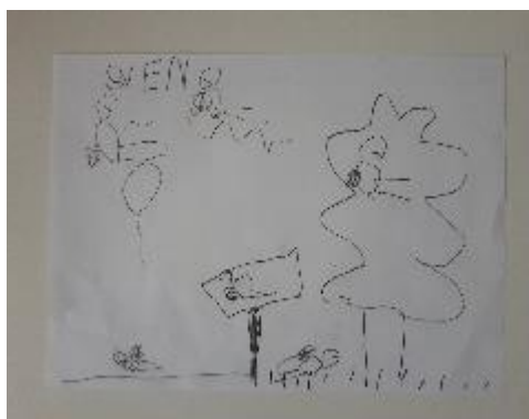
Fotografija 26. Sven (6 godina)