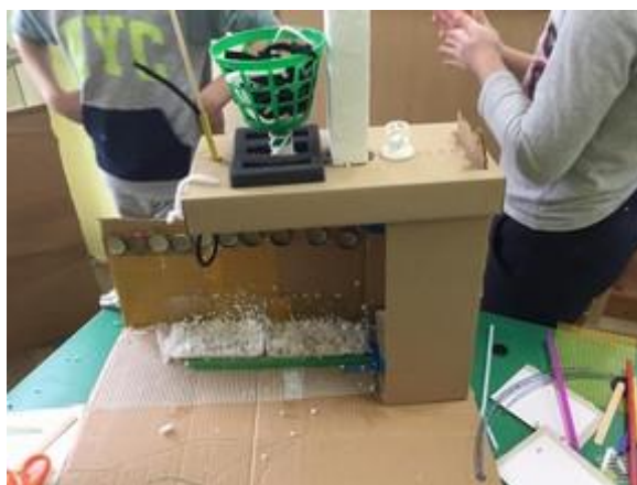
Fotografija 41. Zoja, Ida, Rok (6 godina)