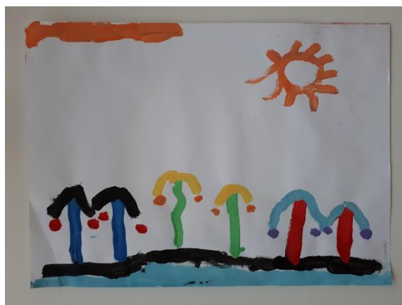
Fotografija 19. Simon (6 godina):

U radovima je vidljivo da djeca povezuju vlastito iskustvo i svjesnost o okolini npr. fotografija 15. dječak L. je izmaštao neobičan otok te je točkicama naslikao korona virus uz objašnjenje da se korona i tamo nalazi, na fotografiji 18. dječak M. je naslikao neobičan planet koji je isto zagađen kao što je i planet Zemlja.