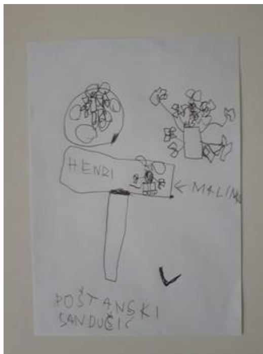
Fotografija 1. Lovro( 7g.): “Malinko je bio u poštanskom sandučiću, na drvu i jezercu (malom jezeru).”

Radovi odgovaraju fazi izražavanja složenijim simbolima koja je karakteristična za dob djece od 6 do 7 godina. Djeca su dala imena crtežima koja su nacrtala. Crteži su ispunjeni složenim simbolima koji se ne odnose na neke konkretne objekte već predstavljaju žurbu ili akciju.