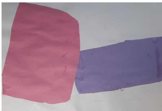
Slika 4. Maja, 4

Djevojčica Maja (4 godine) je na bijeli A4 papir izrezala i zalijepila jedan veći ljubičasti papir i jedan veći rozi papir. Kad sam je upitala kakvo je njezino čarobno more, odgovorila mi je: „Moje more nema životinje, samo je voda“. Njezin stvaralački dio nije trajao dugo, nakon 10 minuta rekla je da je gotova te da će