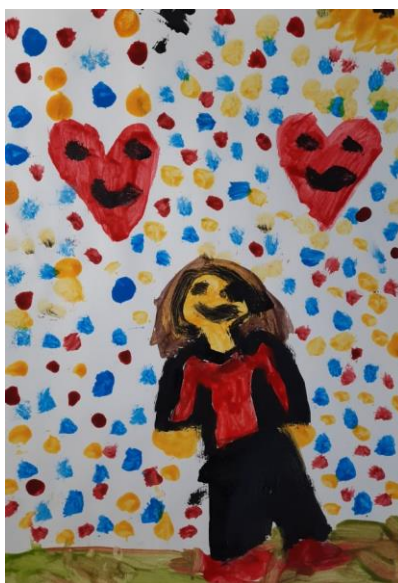
Slika 10. Ema, 6

Dječak Maksim (5.5 godina) je naslikao dvije smeđe figure, zelenu liniju tla i ostatak papira ispunio plavim pahuljama. Na moje pitanje koga je to naslikao rekao je: „Ovo gore je moj tata, ovo dolje je snjegović i pada snijeg“. Dječak je naslikao oblik čovjeka na način da ruke i noge izrastaju iz glave, nema trupa što odgovara načinu slikanja djece od tri do četiri godine. Naslikao je na rukama prste, čovjek ima tri prsta koji ne odgovaraju veličini ruku i ostatku tijela, prsti su veliki tzv. disproporcionalni. Kada sam ga upitala zašto tata ima velike prste, rekao je: „On lovi pahulje“, predimenzioniranje tj. povećanje nekog dijela tijela kako bi se naglasilo što figura radi karakteristično je za dob djece od četiri do pet godina, no može se javiti i kasnije. Zbog toga je pri analizi i procjeni dječjih likovnih radova potrebno imati na umu sve slojeve i aspekte likovnih i životnih značenja (Belamarić, 1987).