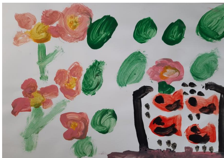
Slika 14. Ivan, 7

Dječak Ivan (7 godina) je svoj papir postavio vodoravno, unatoč tome što je uputa bila postaviti ga okomito. U desnom donjem kutu naslikao je crni okvir akvarija i u njemu četiri ribe sa očima i nasmiješenim ustima, ispod je stavio rozu liniju koja predstavlja stol, ostatak papira popunio je zelenim listovima i rozim cvjetovima. Dječak je od početka stvaralačkog dijela aktivnosti bio nezainteresiran te ga je bilo potrebno poticati. Motivi su kod njega posloženi na drugačija mjesta, organizacija motiva je svojevoljna. Nakon što je završio sa crtanjem akvarija mi je rekao: „Teta ja sam gotov“, no kad sam ga potaknula i pohvalila dovršio je rad.