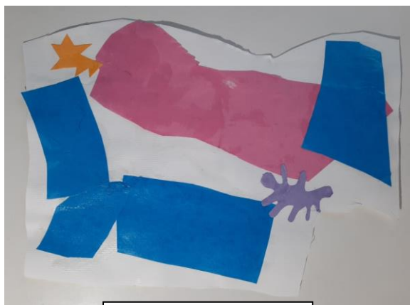
Slika 5. Mila, 4.5

kasnije dovršiti svoj rad no nije ga dovršila. Smatram da djevojčicu nije zainteresirala ova aktivnost, no unatoč tome sjela je za stol i odradila zadatak.