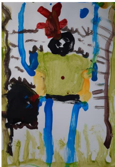
Slika 11. Tin, 5

žuto sunce sa zrakama u desnom gornjem kutu što upućuje na shematski, naučeni prikaz sunca. Također „nasmiješeno“ lice njene sestre i dva srca upućuje na podučavanje djece. Kada sam je upitala što su te šarene točkice okolo rekla mi je: „To mi je slučajno kapnula tempera pa sam onda odlučila tak napraviti da se ne vidi da sam pogriješila“, pri tome se vidi snalažljivost i kreativnost djevojčice.