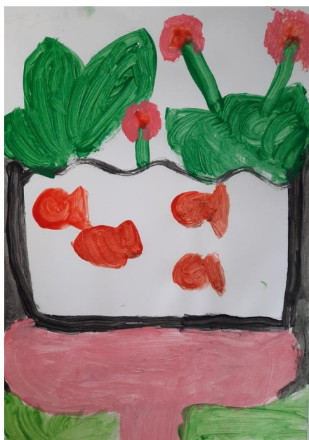
Slika 12. Karla, 7