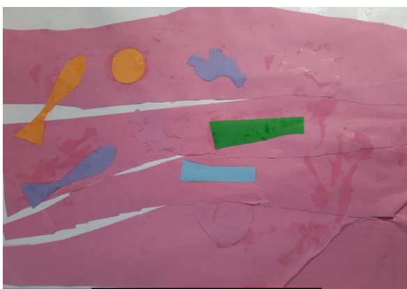
Slika 6. Vita, 3.5

Djevojčica Mila (4.5 godine) je jedina odlučila izrezati bijeli A4 papir u oblik koji je željela te je rekla da je tako ljepše. Izrezala je i zalijepila plavi i rozi papir te dva oblika ljubičaste i narančaste boje za koje je rekla „Ovo plavo su valovi, a ostalo životinje koje plivaju“. Djevojčica se angažirala u aktivnost i slobodno izrezivala i lijepila oblike na papir.