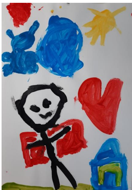
Slika 8. Lukas, 5

Dječak Lukas (5 godina) je naslikao supermana, kuću, plavi oblak, žuto sunce, plavi leptir, crveno srce i zelenu liniju tla. Kada sam ga upitala koga je zamislio i koga će slikati, rekao je: „Supermana, on ima razne moći“, unatoč tome što je zadatak bio zamisliti mamu ili tatu. Na to mi je odgojiteljica rekla da uvijek slika ili crta supermana bez obzira koji motiv ili tema se obrađuje. Naslikao je figuru čovjeka bez detalja ili složenijih oblika kao što su prsti, nos, uši, kosa. Plavi oblak i žuto sunce sa zrakama je primjer podučavanja djece i shematskog prikaza, odnosno naučeno slikanje stvari. Boje koje dječak koristi su lokalne, tj. boje motiva su jednake bojama u stvarnosti, što je karakteristično za tu dob djece, oni tragaju za stvarnom bojom predmeta.