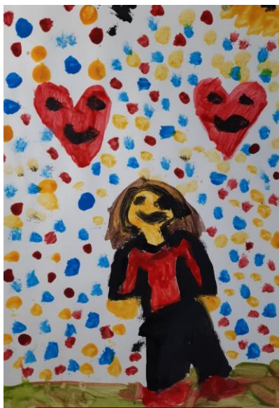
Slika 10. Ema, 6

Dječak Maksim (5.5 godina) je naslikao dvije smeđe figure, zelenu liniju tla i ostatak papira ispunio plavim pahuljama. Na moje pitanje koga je to naslikao rekao je: „Ovo gore je moj tata, ovo dolje je snjegović i pada snijeg“. Dječak je naslikao oblik čovjeka na način da ruke i noge izrastaju iz glave, nema trupa što odgovara načinu slikanja djece od tri do četiri godine. Naslikao je na rukama prste, čovjek ima tri prsta koji ne odgovaraju veličini ruku i ostatku tijela, prsti su veliki tzv. disproporcionalni. Kada sam ga upitala zašto tata ima velike prste, rekao je: „On lovi pahulje“, predimenzioniranje tj. povećanje nekog dijela tijela kako bi se naglasilo što figura radi karakteristično je za dob djece od četiri do pet godina, no može se javiti i kasnije. Zbog toga je pri analizi i procjeni dječjih likovnih radova potrebno imati na umu sve slojeve i aspekte likovnih i životnih značenja (Belamarić, 1987).