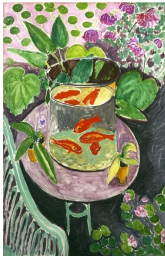
Slika 1. Henri Matisse, Goldfish , 1911. Ulje na platnu, 146x97 cm

Odabrana djela prikazuju umjetnikov stil stvaranja u različitim razdobljima i primjerene su djeci predškolske dobi. Boje su izražene, djela su šarena i vesela, te kod promatrača pobuđuju maštu i emocije.