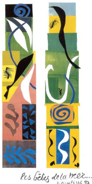
Slika 2. Henri Matisse, Beasts of the Sea , 1950. Kolaž, 295,5x154 cm

zajedničko djelovanje, također koristi kontrastne boje (zelenu i crvenu). Neke crte su precizno i tanko povučene dok su neke površine obojane kistom tako da se još vidi prijelaz tj. na nekim dijelovima se vidi boja od ispod. Matisse radi vidljive poteze kistom u raznim smjerovima.