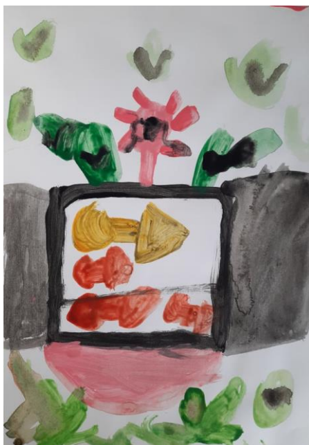
Slika 13. Kevin, 7

Djevojčica Karla (7 godina) je naslikala crni okvir akvarija, unutra četiri narančaste ribe, ispod akvarija rozi stol i zelenu površinu, iznad akvarija je naslikala zelene listove i roze cvjetove. Djevojčica je za vrijeme stvaranja ispitivala detaljna pitanja u vezi opisa djela. Njezin rad je vrlo uredan, crte i površine su precizne i čiste. Djevojčica je rekla da kad odraste želi postati umjetnica te mi je rekla da kod kuće sama slika, crta ili izrađuje kreativne radove.