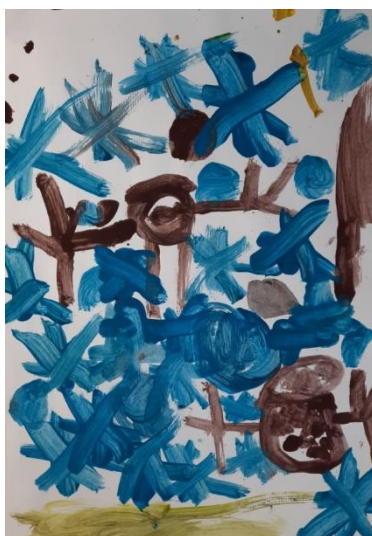
Slika 9. Maksim, 5.5

Dječak Lukas (5 godina) je naslikao supermana, kuću, plavi oblak, žuto sunce, plavi leptir, crveno srce i zelenu liniju tla. Kada sam ga upitala koga je zamislio i koga će slikati, rekao je: „Supermana, on ima razne moći“, unatoč tome što je zadatak bio zamisliti mamu ili tatu. Na to mi je odgojiteljica rekla da uvijek slika ili crta supermana bez obzira koji motiv ili tema se obrađuje. Naslikao je figuru čovjeka bez detalja ili složenijih oblika kao što su prsti, nos, uši, kosa. Plavi oblak i žuto sunce sa zrakama je primjer podučavanja djece i shematskog prikaza, odnosno naučeno slikanje stvari. Boje koje dječak koristi su lokalne, tj. boje motiva su jednake bojama u stvarnosti, što je karakteristično za tu dob djece, oni tragaju za stvarnom bojom predmeta.