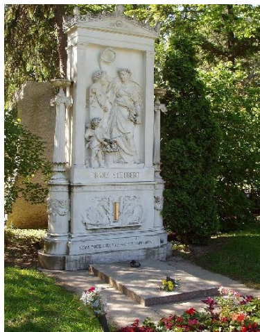
Slika 6.: Grob Franza Schuberta na bečkom groblju "Zentralfriedhof" 8

U bečkom parku „Stadtpark“, 1872. godine, podignut je memorijal Franzu Schubertu. Godine 1888. Schubertov i Beethovenov grob je premješten u središnje bečko groblje "Zentralfriedhof". Tamo se nalaze grobovi Johanna Straussa II. I Johannes Brahmsa. Groblje u Währingu pretvoreno je 1925. godine u park koji je nazvan „Schubert Park“, a bivši grob mu je označen bistom.