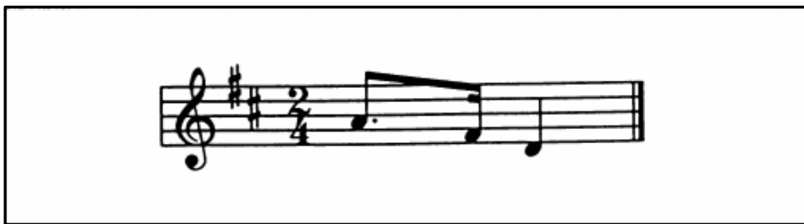
Slika 1. Audijeva posebna pjesma

Primary Measures of Music Aptitude je grupni test namjenjen za uzrast od 5 do 8 godina. Sadrži tonski i ritmički dio, a svaki dio ima 40 zadataka prije kojih su primjeri za vježbu. Jedan zadatak čine po dvije glazbene cjeline koje se izlažu jedna za drugom. Svaki zadatak imenovan je nekim predmetom (npr. knjiga, lutka). Nakon što posluša par glazbenih fraza dijete treba odrediti da li su one bile iste ili različite i zatim na prilagođenom listu za odgovore zaokružiti točan odgovor. Ako su fraze iste treba zaokružiti par istih „smajlića“, a ako su različite, par različitih (Slika 2). Djetetu za rješavanje ovog testa nije potrebno znati čitati i pisati niti prethodno glazbeno obrazovanje ili iskustvo.