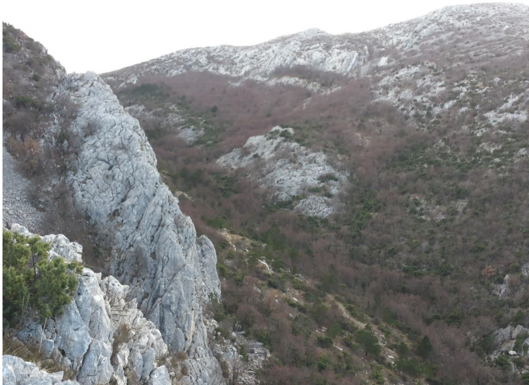
Slika 4. Mjesto na kojem su se okupljale vještice