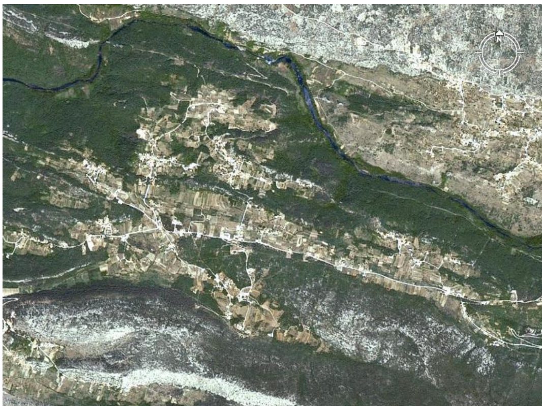
Slika 1. Satelitska snimka sela Kučiče

U ovom završnom radu govorit će se o usmenim narodnim bajkama sela Kučiče. Selo Kučiče malo je mjesto u Dalmatinskoj zagori koje se nalazi na visoravni uz rijeku Cetinu. Prvi se put spominje 1315. godine u darovnici kneza Jurja Šubića. Kučiče je od grada Omiša udaljeno svega petnaestak kilometara te po zadnjem popisu stanovništva broji nešto više od šesto stanovnika. Iako naizgled malo selo, veoma je tradicijski orijentirano te je bogato kulturno-povijesnom materijalnom i nematerijalnom baštinom.