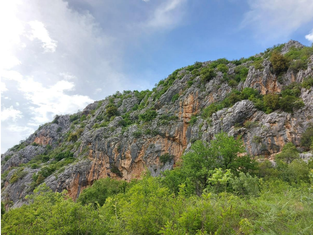
Slika 3. Crvene stine