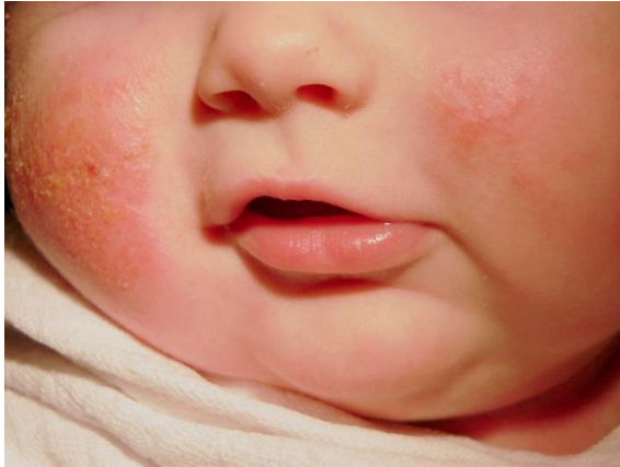
Slika 3. atopijski dermatitis – izvor - https://ljekarne-prima-farmacia.hr/savjeti/kako-lijeciti-atopijski-dermatitis-kod-djece-4/