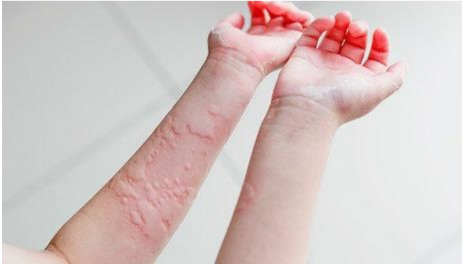
Slika 4. Urtikarija

Urtikarija je bolest koja se javlja najčešće kod djece, s prevalencijom od 20%. Urtike su uzdignuta žarišta koja se javljaju na površinskom dijelu kože, nemaju pravilan oblik i izazivaju intenzivan svrbež. U većini slučajeva nestaju kroz nekoliko dana, ali mogu biti kronične i trajati dulje od 6 tjedana. Urtikarija je uglavnom posljedica nutritivne ili medikamentozne alergije, no ukoliko se radi o kroničnoj urtikariji uzrok je najčešće nepoznat (Mardešić i sur., 2003).