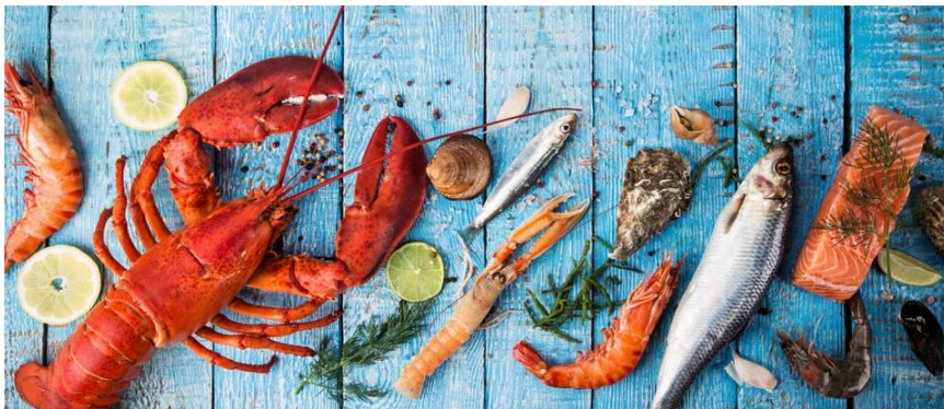
Slika 1. Alergeni

Još jedna od namirnica koje često uzrokuju alergijske reakcije su jaja. Jaja su namirnica koju ne podnosi svaki organizam. Iako su prehrambeno vrijedne, kao i mlijeko sadrže neke bjelančevine koje mogu uzrokovati alergijske reakcije. Reakcija se može javiti češće na bjelanjak, ali i na žumanjak. Kao i na mlijeko, češće na jaja reagiraju djeca nego odrasli, a postoji nekoliko čimbenika koji na to utječu: obiteljska anamneza, atopijski dermatitis, druge alergije i dob. Osim jaja, osobe s alergijom trebali bi izbjegavati svu prehranu koja u sebi sadrži jaja (tjesteninu, majonezu, razne kolače...) (Bošnjir i sur., 2009).