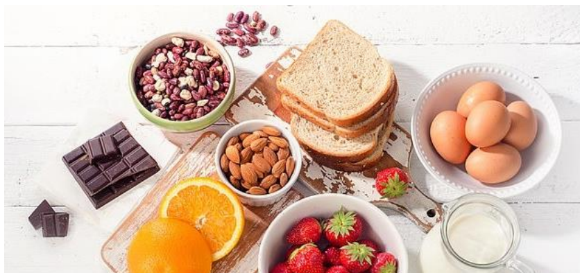
Slika 2. Najčešći alergeni

pas i bakalar. Školjke koje najčešće izazivaju reakcije su dagnje. Alergija na ribe i školjke može biti usko povezana, osobe koje su alergične na školjke često su alergične i na neke riblje proteine. Dva su glavna proteina koja uzrokuju alergijske reakcije, a sadrže ih ribe i školjke, to su tropomiozin i parvalbumin (karakterističan za bakalar) (Bošnjir i sur., 2009). Riba pripada u hranu koja je bogata histaminom, a trovanje histaminom događa se u slučajevima lošeg skladištenja ili pokvarene (stare) ribe (Lugović-Mihić i sur., 2012).