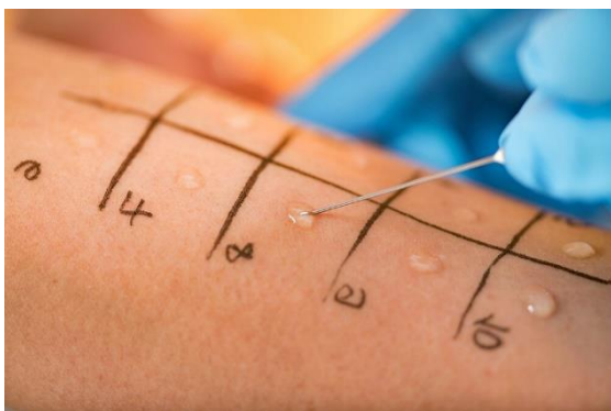
Slika 7. Prick ubodni kožni test

Prvi i neizostavni dio postavljanja dijagnoze je kožno testiranje ubodnim (prick) testom. Ubodni test radi se tako da se set od 10 najčešćih alergena ubodom lancete unose na površinski sloj kože u području podlaktice. Rezultati su vidljivi nakon 15-30 minuta, a ukoliko je test pozitivan na području određenog alergena stvori se crvenilo koje je popraćeno svrbežom (Popović-Grle, 2007). Dobna granica za ovaj test ne postoji, stoga se koristi za dijagnosticiranje alergija kod djece, osobito kod onih koji su skloni angioedemima i urtikarijama. Najčešće se koriste nutritivni i inhalacijski alergeni: pelud trave ili stabala, perje, prašina, dlake životinja, tkanine, gljive, jaja, mlijeko, meso, riječna i morska riba (Lipozenčić i sur., 2011).