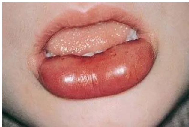
Slika 5. Angioedem na ustima