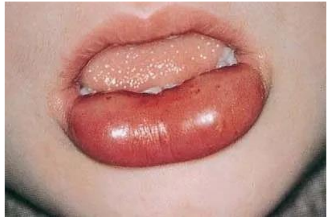
Slika 5. Angioedem na ustima