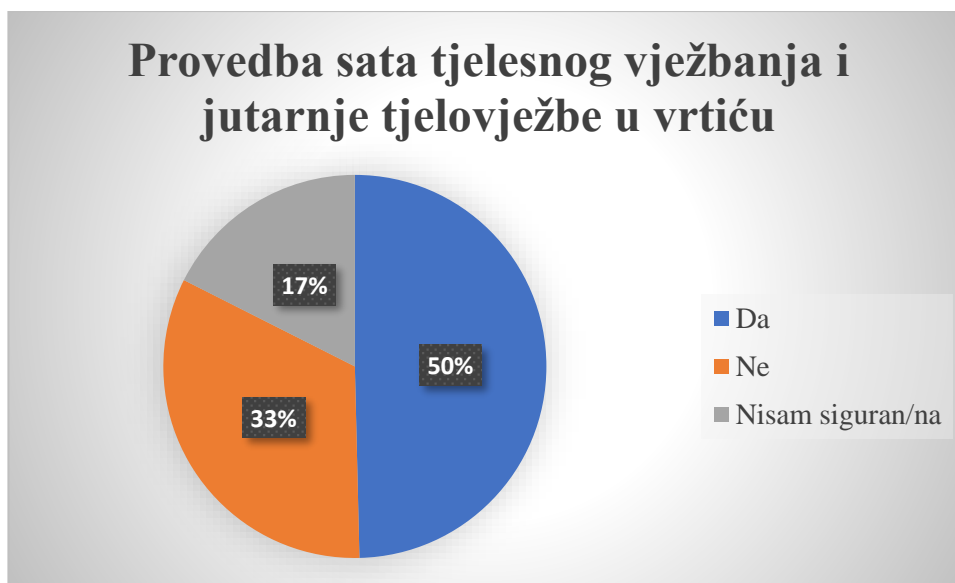
Slika 4. Provedba tjelesnih aktivnosti u vrtiću.

životu te samo 4 osobe nemaju takav stav. Njihov stav može biti pod utjecajem okoline ili može biti nezainteresiranost pri rješavanju upitnika. Velika razina slaganja s važnostima tjelesnog vježbanja može biti posljedica medijskog izlaganja teme tjelesnog vježbanja kao važnog za kvalitetan rast i razvoj te osvješćivanja ljudi o pojavi sjedilačkog načina života i njegovoj štetnosti. Izračunom pointbiserijalne korelacije dobiveno je da ne postoji statistički značajna korelacija ( r=-0,034 , p=0,70 ) izračunata na uzorku veličine 131 u stavovima prema tjelesnom vježbanju i stavovima o važnosti fizičke aktivnosti odgajatelja i roditelja čime je pokazana netočnost druge hipoteze.