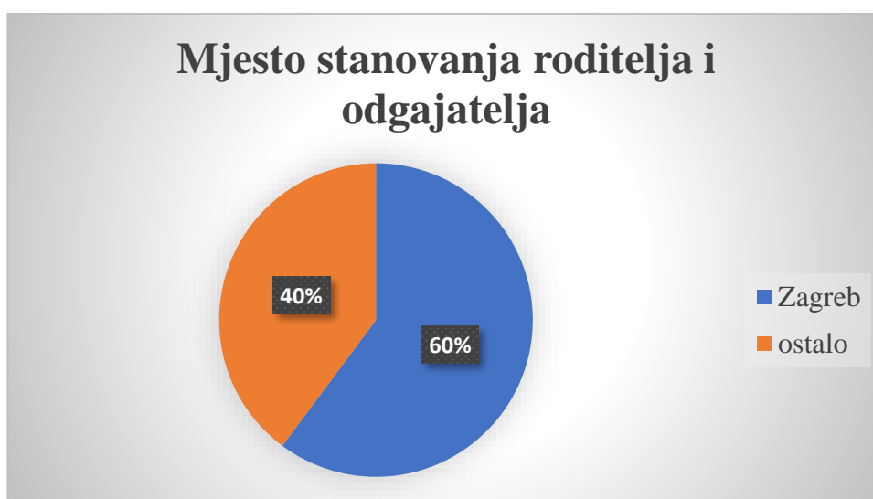
Slika 3. Mjesto stanovanja sudionika istraživanja.

Sudionici s obzirom na mjesto stanovanja bili su većinski iz Zagreba N=85 , a iz ostatka Hrvatske ih je bilo 46 te se oni protežu skroz od Osijeka do Dubrovnika (Tablica 3.). Za nadolazeća istraživanja bilo bi zanimljivo ispitati stavove po pojedinim hrvatskim dijelovima na većem uzorku ispitanika kako bi se uvidjele moguće razlike o stavovima tjelesnog vježbanja roditelja i odgajatelja unutar Republike Hrvatske.