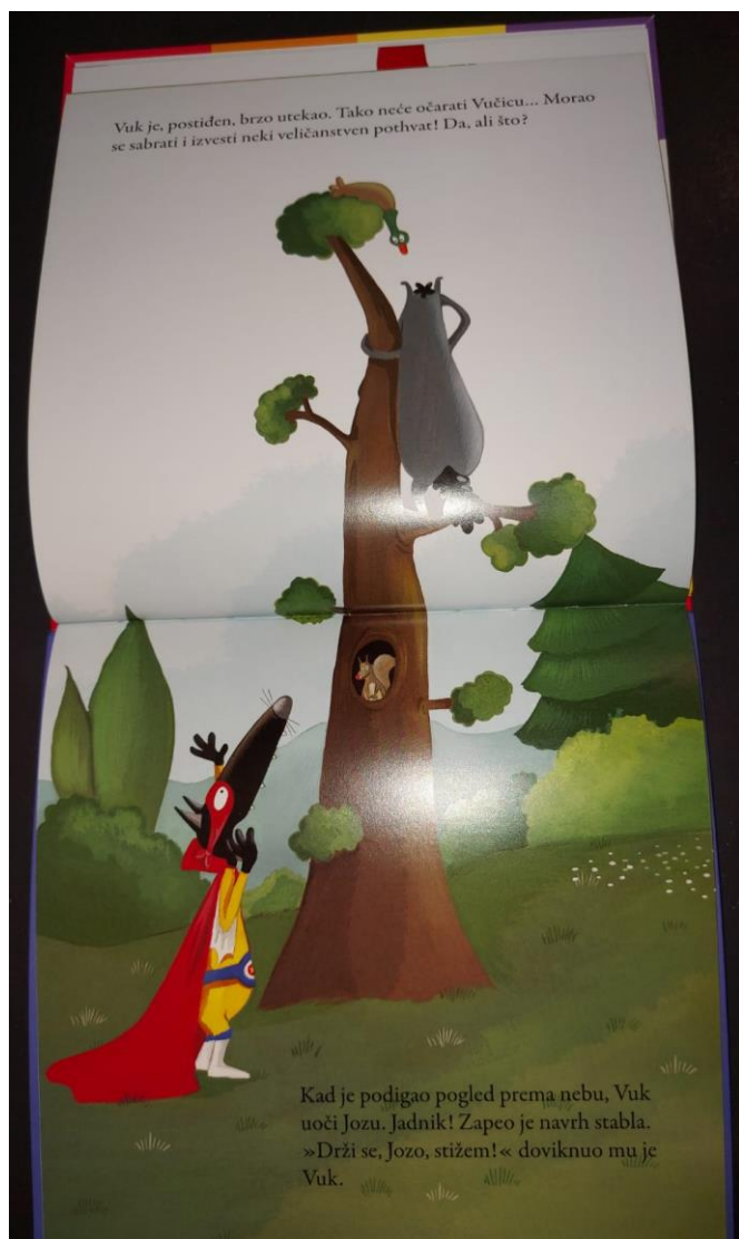
Slika 1 (fotografirano u slikovnici „Vuk koji je želio biti superjunak“)