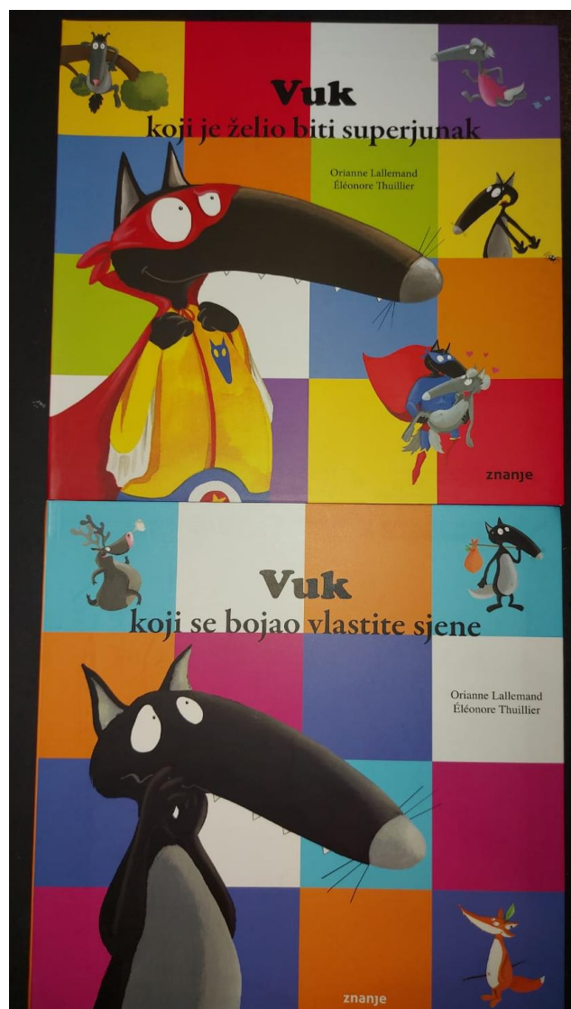
Slika 2 (fotografirane slikovnice „Vuk koji je želio biti superjunak“ i „Vuk koji se bojava vlastite sjene“)

Ilustracije predočavaju, ali i nadopunjuju tekst, pridaju pažnju emocijama likova, opisuju sadržane radnje, djeci daju inspiraciju za maštoviti prikaz sadržaja (Slika 3). Na taj način stvaraju interes kod djece čiji je jedan od važnijih poticaja sama likovna i grafička strana (Čačko, 2000). Budući da u ovom serijalu prevladavaju ilustracije u odnosu na tekst, one moraju biti šarolike i svestrane kako bi upotpunile riječi. Jasne su do te mjere da bi i djeca koja ne znaju čitati, samim prelistavanjem, mogla stvoriti priču, koja bi vjerojatno bila vrlo približna onoj koja se dobije čitanjem.