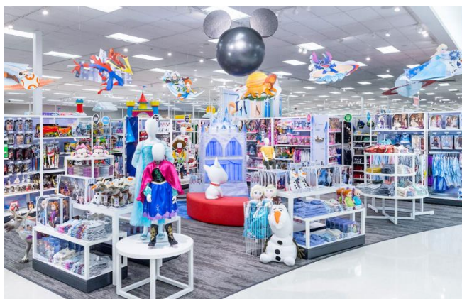
Slika 6. Proizvodi filma Frozen