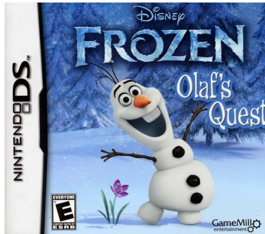
Slika 2. Videoigra Olafova potraga

Disney nije distribuirao nijednu službenu igru, već je licencu prodao drugim kompanijama. Tako su, naprimjer, 2013. godine izdali igru za Nintendo – Olafova potraga ( www.gamasutra.com ), a 2015. godine napravili posebno izdanje za Playstation – Slobodni pad: Borba grudama (Perez, 2015).