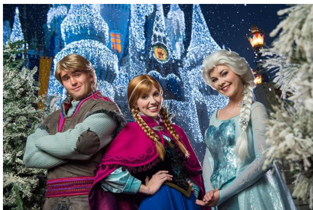
Slika 7. Frozen atrakcija u Disneyworldu

Unutar Disneyworlda organiziraju se brojni događaji te se nalaze mnoge atrakcije, pa tako i Frozen ima svoje vlastite. U prvoj godini izlaska, događaji su bili toliko popularni da su se morali produžiti za mjesec dana. Neki od događaja bili su: povorke, pjevanje zajedno s likovima, ritmičko klizanje, upoznavanje likova, plesne zabave i tako dalje (Wynne, 2014). Danas se u Disneyworldu može družiti s likovima, fotografirati s njima, pogledati predstave, igrati se u snijegu, voziti na Frozen rollercoasteru , odsjesti u Frozen sobi i mnogo toga drugoga ( www.disneyworld.eu ). Osim toga, postoji i organizirane ture u Norveškoj, zemlji koja je inspirirala stvaratelje ovog filma ( www.visitnorway.com ).