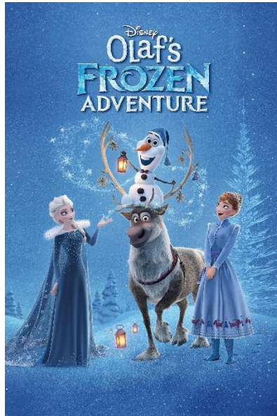
Slika 3. Film Olafova pustolovina

2017. godine, u vrijeme blagdana, emitiran je kratki animirani film Olafova pustolovina , a 2020., u vrijeme COVID-19 pandemije, izašao je kratki serijal Kod kuće s Olafom ( www.disney.fandom.com ).