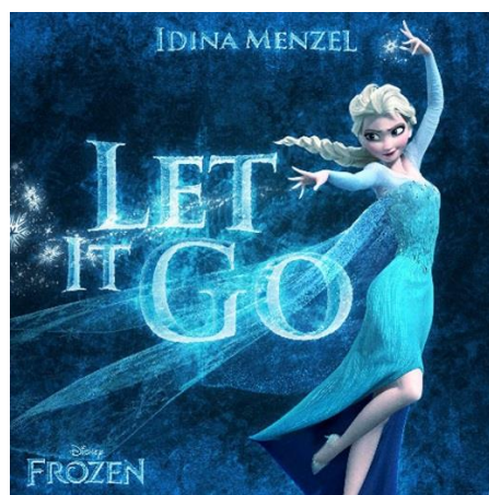
Slika 3. Pjesma Let it go

Frozen franšiza sadrži mnoge pjesme koje su doživjele velik uspjeh, kao što su: Let it go , Into the unknown , Frozen Heart , Do you want to build a snowman , For the first time in forever , Love is an open door , In summer , Fixer Upper te Reindeers are better than people (Stelle, 2020).