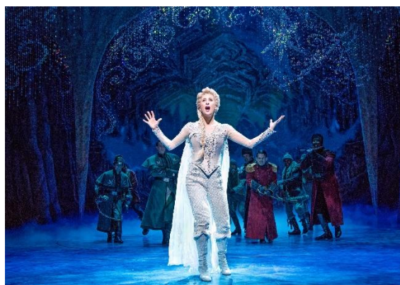
Slika 4. Mjuzikl Frozen

U sklopu Disneyjeva događaja „Disney na ledu“, 2014. godine krenula je i predstava na ledu Frozen , koja je prodala 250 000 karata prvog dana kad su karte puštene u prodaju (Palmeri, 2014). Još jedan veliki događaj koji je nastao po uzoru na ovaj film je i broadwayski mjuzikl Frozen , kojeg je gledalo više od milijun ljudi (Evans, 2020).