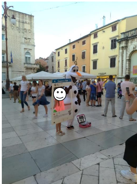
Slika 1. Naplaćivanje fotografiranja s maskotom Olafa

Kako je Frozen stekao veliku popularnost, tako je i postalo popularno sve vezano uz ovaj film. Njihovi proizvodi i usluge kontinuirano se šire te je Frozen postao zasebna franšiza unutar Disneyja (Nyh, 2015). Unutar franšize nalaze se proizvodi, atrakcije u Disneyjevom parku, predstava Disney on Ice , mjuzikl na Broadwayu, video igre, knjige, dva kratka animirana filma i razni drugi događaji i atrakcije.